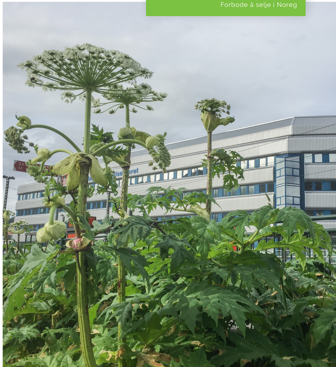
Kjempebjørnekjeks ved bybanestoppet Florida i Bergen.

SVARTELISTESTATUS: Svært høg risiko. Forbode å selje i Noreg