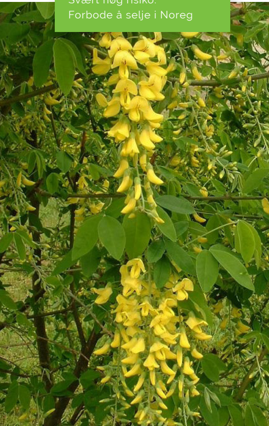
Gullregn / Alpegullregn

SVARTELISTESTATUS: Svært høg risiko. Forbode å selje i Noreg