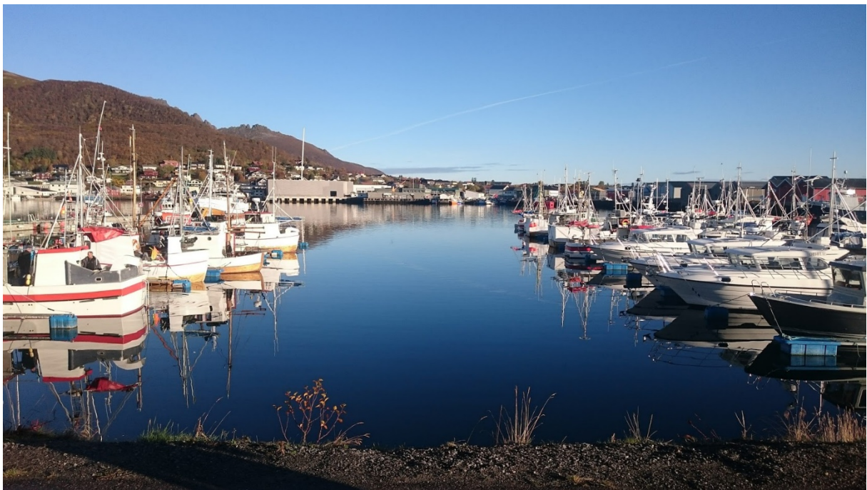
Indre deler av Myre havn

Under befaringen i Myre havn fikk vi inntrykk av at avfallsplanen i havna blir fulgt tett opp av den lokale havnemyndigheten. Det ble også gitt en demonstrasjon av et meldesystem som omfatter samtlige yrkesutøvere i havna. Vi fikk inntrykk av at terskelen for å reagere på forsøpling i havna er satt lavt. Havnesjefen er imidlertid ikke delegert forsøplingsmyndighet og etterspør bedre oppfølging, særlig ovenfor næringslivet. Hovedutfordringen virker å være knyttet til dumping av organisk avfall fra tilvirkning av fisk.