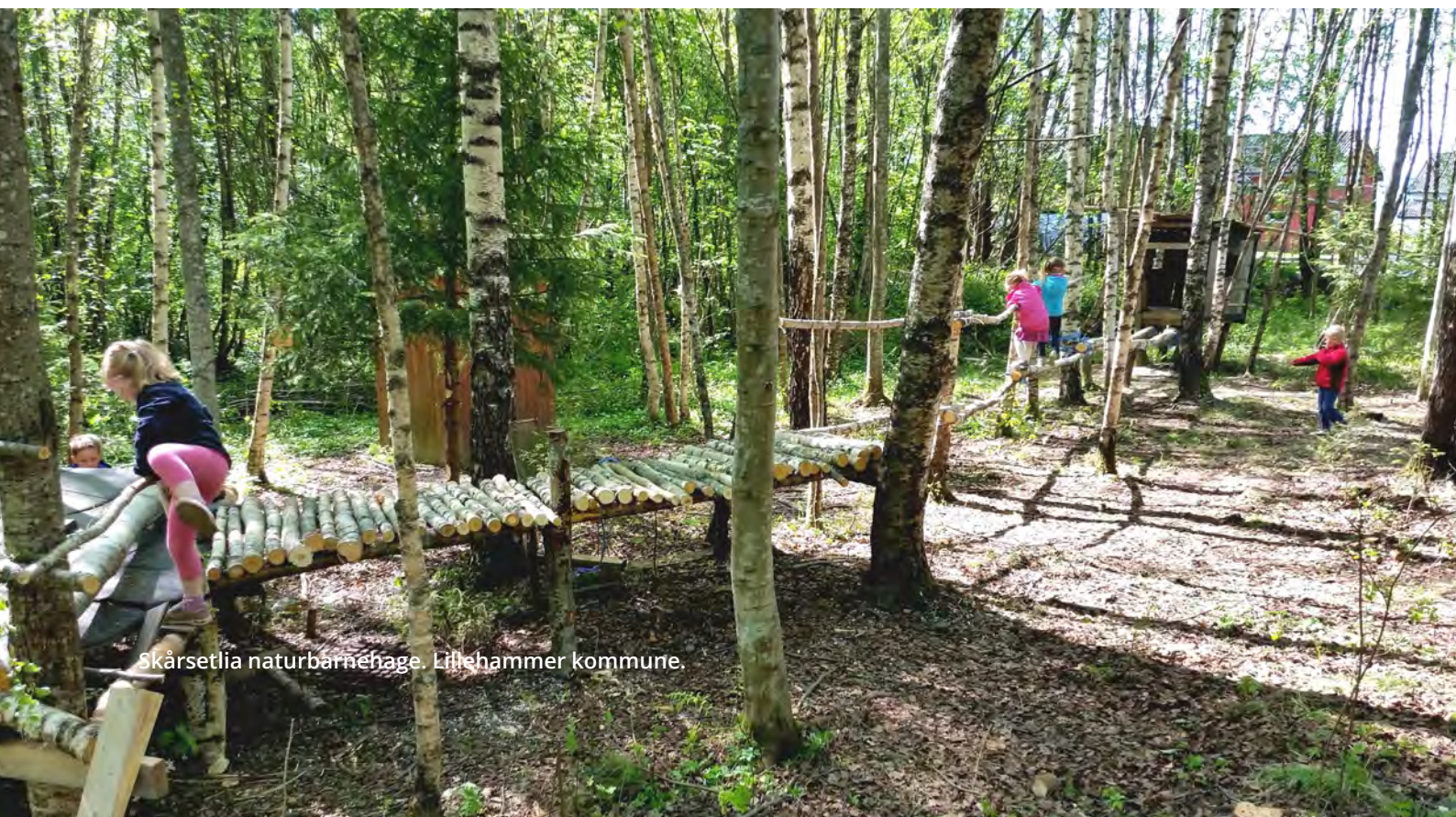
Skårsetlia naturbarnehage, Lillehammer kommune.

Urban fortetting og transformasjon gir gjerne positiv effekt i forhold til dagens bustad-, areal- og transportplanlegging. Dette opnar for at ein i større grad kan ta framtidens transportauke