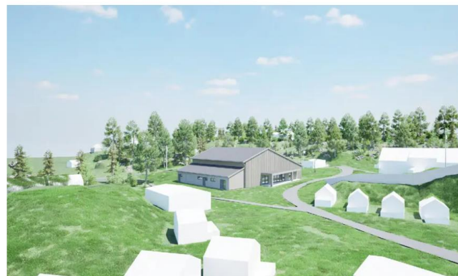
Slik ser man for seg den nye møtehallen.

På sitt årsmøte vedtok Justøyfamiliens bibelcamping (JFC) at de skal bygge en ny hall. Det kan bety slutten på en årelang konflikt med campingens hyttenaboer.