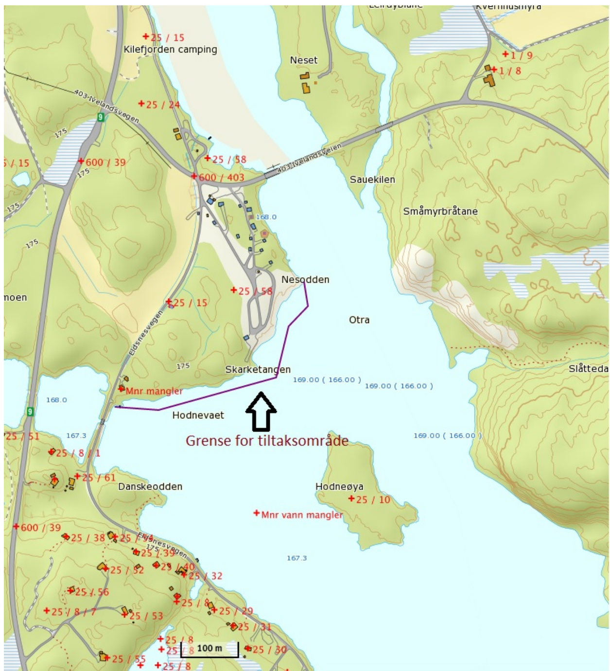
Kart over lokalitet 14 – Kilefjorden. Området er en mil nedenfor kommunesenteret Evje.