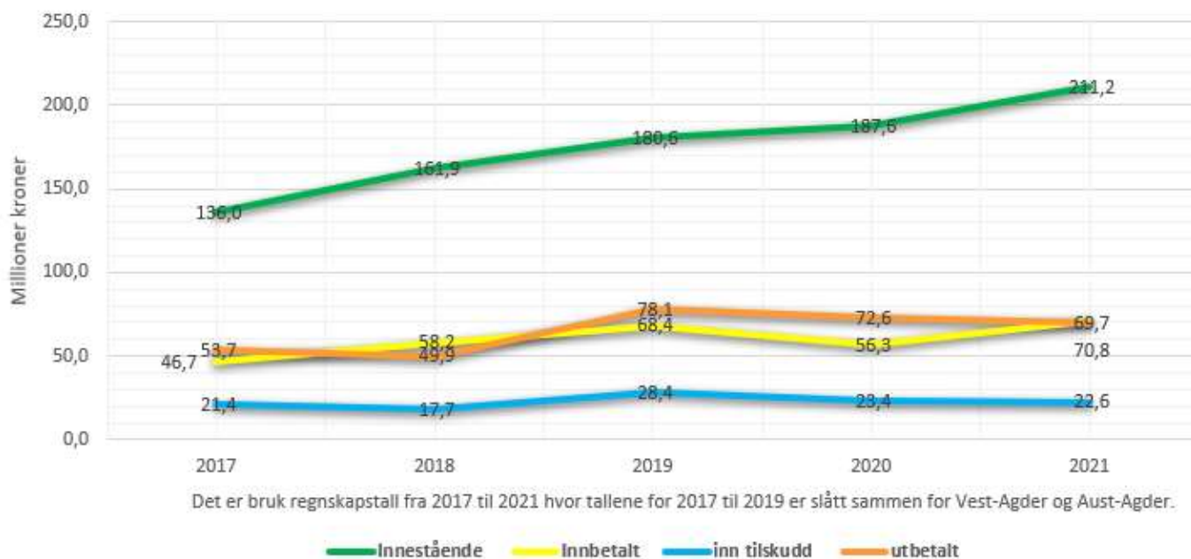
Figur 2: Innestående skogfond (UB), innbetalt skogfond, innbetalt tilskudd og sum utbetalt