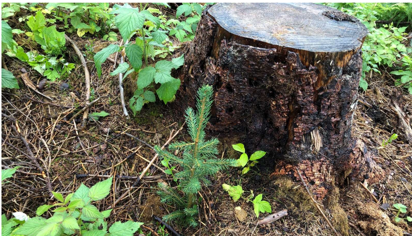
Tabell 3: Skogkultur 2021 – etterarbeid.