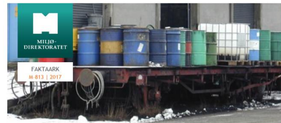
Mulig forurensning i grunnen kan variere med type bransje