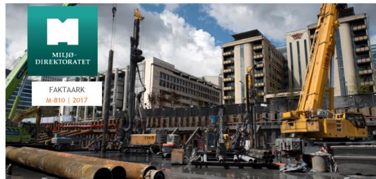
Kommunen er forurensningsmyndighet for forurenset grunn i bygge- og gravesaker.