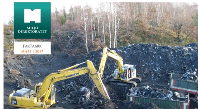
Opprydding i forurenset grunn ved bygge- og gravearbeid er tiltakshavers ansvar.

Vurdere andre relevante stoffer enn de det er utarbeidet normverdier mht. historikk