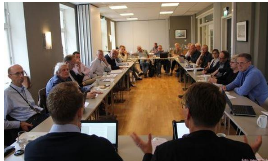
Rundebordskonferanse i 2016 om klimaarbeidet i Agder.