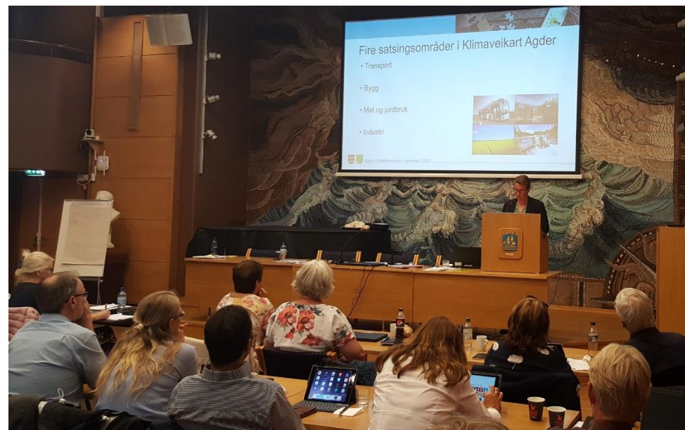
Klimaveikart Agder presenteres for bystyret i Grimstad