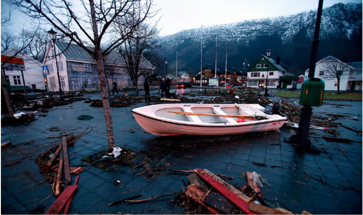
Etter Dagmar i Nordfjordeid november 2011.

Bølgepåvirkning er ikke inkludert i tallene. Se mer om dette i kap. 2.4 om lokale forhold.