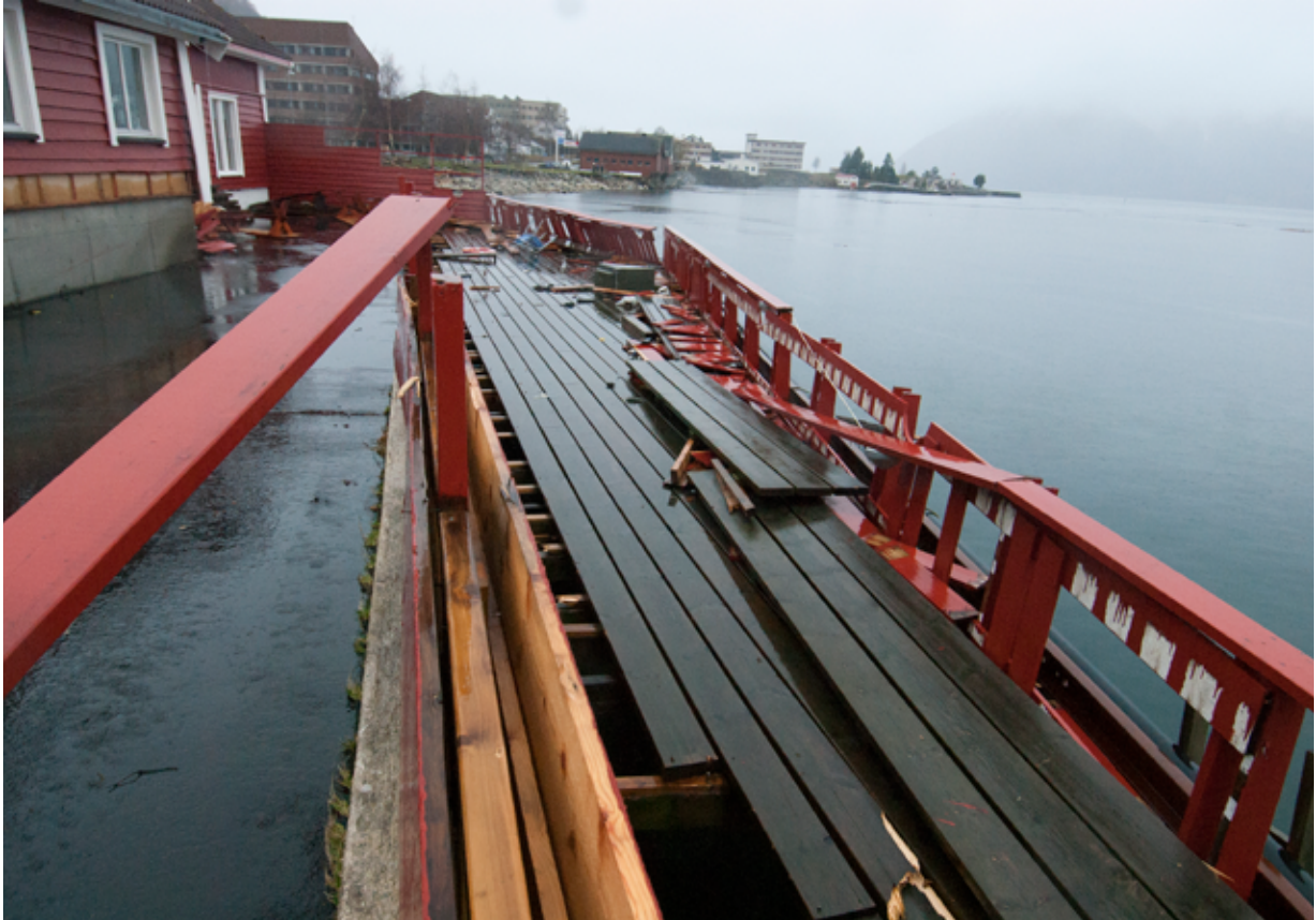
Stormfloen under Dagmar november 2011 gjorde store skader, her fra Leikanger.

Klimaendringene vil forsterke de utfordringene som dagens klima fører med seg og legge til noen nye. Mange av bygningene, anleggene og infrastrukturen som føres opp i dag, vil ha lang levetid og det kan være verd å merke seg at omgivelsene rundt disse også kan komme til å endre seg som følge av at klimaet endrer seg. Havnivåstigning og økt frekvens av stormflo er slike klimaendringer. Det er fortsatt usikkerhet knyttet til hvor mye havet vil stige, men retningen er gitt. For mer informasjon om hvordan kommunen kan ivareta klimatilpasning og samfunnssikkerhet i planlegging etter plan- og bygningsloven, se Klimahjelperen .