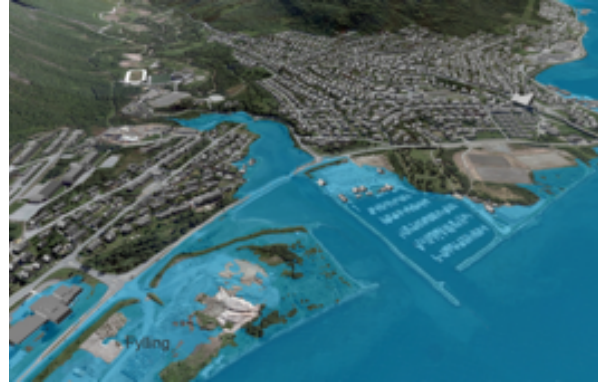
Eksempel på hvordan havnivåstigning og stormflo kan illustreres, her vist i Tromsø kommunes KlimaGIS-kart (stormflo 322 cm i år 2100 fra 2009-rapporten)

dokumentert at det foreligger tilstrekkelig sikkerhet, jf. pbl. § 28-1 første ledd. Kommunen har plikt til å informere om naturfare som er kjent der faren ikke framkommer av plangrunnlaget. Utbygger må så utrede sikkerheten. Dersom kommunen ikke informerer om kjent fare, kan den bli kjent erstatningsansvarlig.