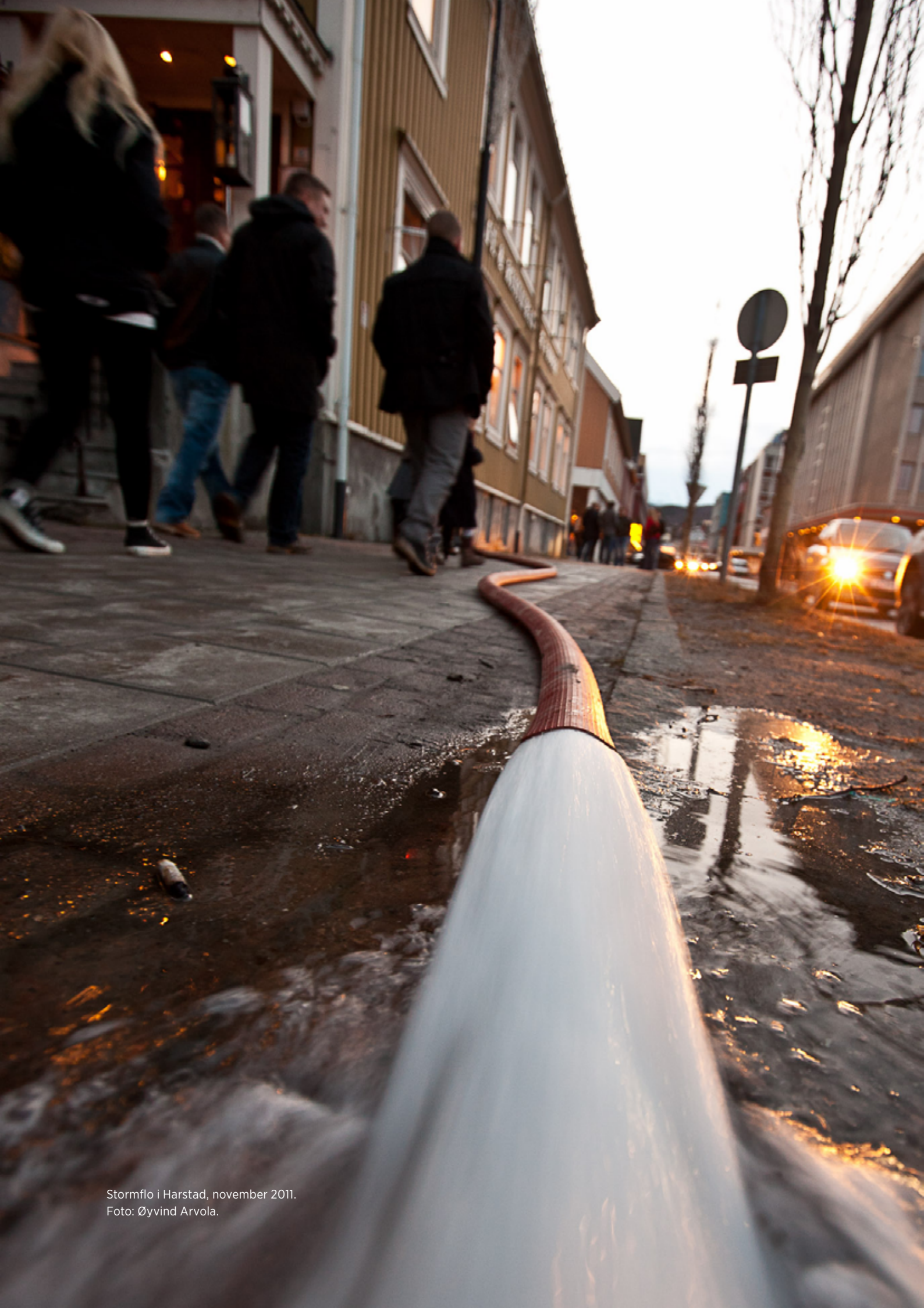
Stormflo i Harstad, november 2011.