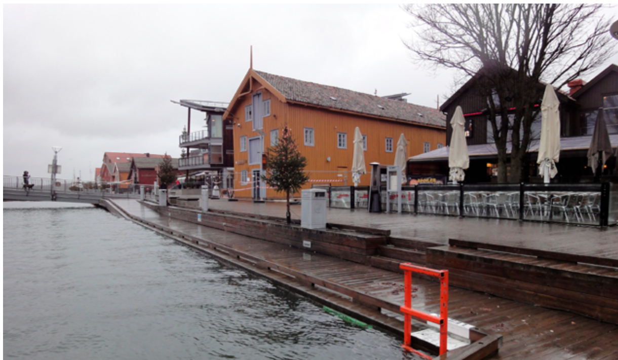
Stormflo i Tønsberg desember 2013.