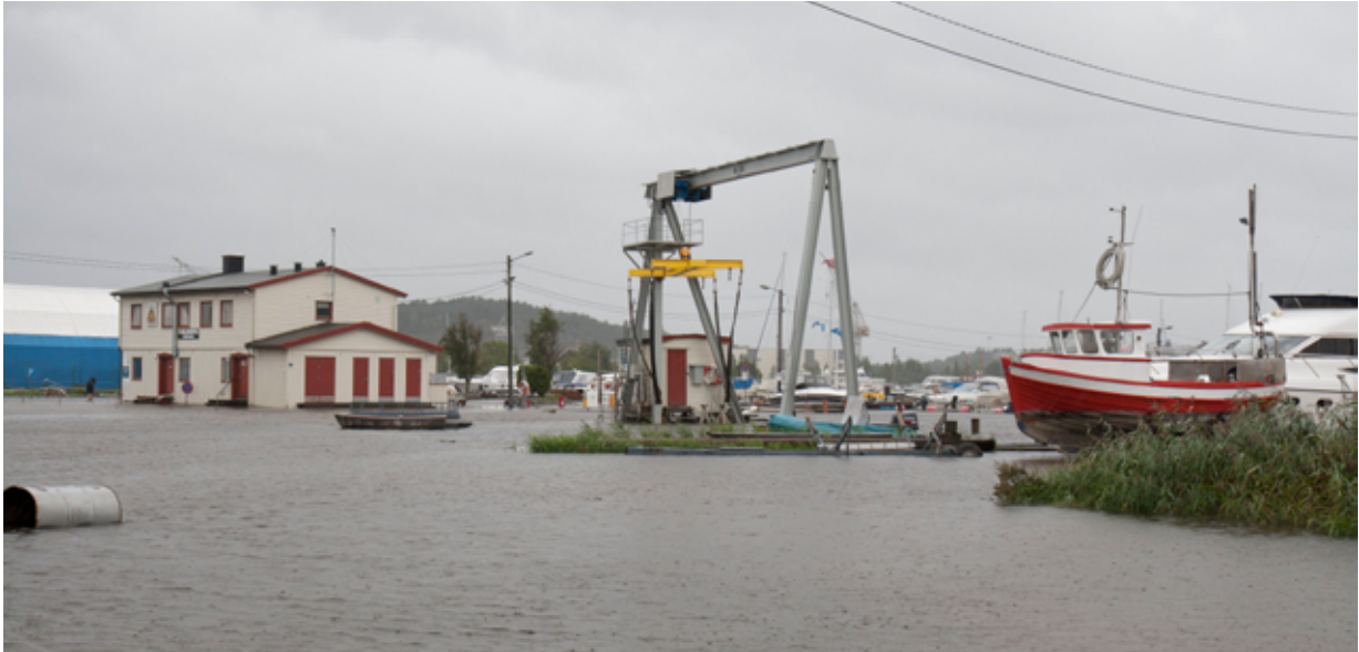
Stormflo i Fredrikstad.