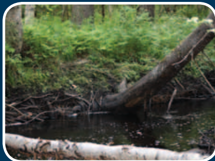
Utgraving i elvekant