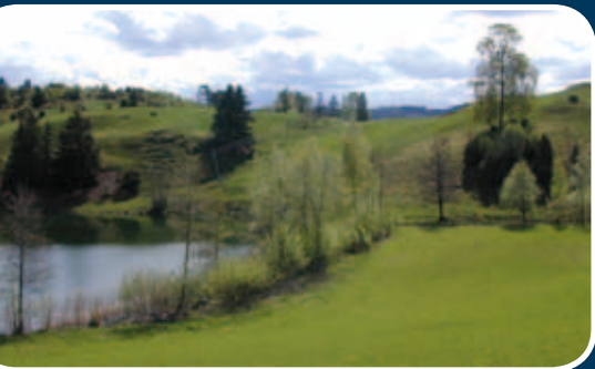
Kantsone mot dyrket mark