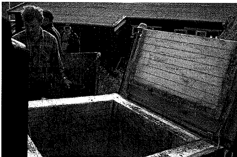
Varmkompostering av matavfall

Regelen er at det er den enkelte sitt ansvar å ta med seg sitt eige søppel ut av området. På vegen frå Gjendebru turisthytte til bryggja er det likevel sett opp søppelkasse og kasse for tomflasker for å hindre at søppel blir lagt att i naturen. Systemet fungerer bra. På turisthytta blir matavfallet kompostert i eige anlegg som fungerer godt. Behandlinga av restavfallet er ikkje så tilfredsstillande. Fram til nå har dette vore brent i ein stor haug ved fjøset. Brukarane av dei private hyttene frakter sjølv ut søpla frå området.