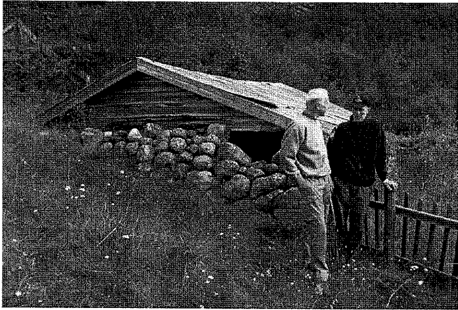
Fylkesmannen og fjellstyreformannen ved det gamle seterfjøset. I bakgrunnen lauvskogen som kryp stadig lengre inn i den tidlegare opne marka kring Gjendebu

Nesten heile området frå bryggja til Storådøla høyrer til den gamle setra. Det bør derfor ryddast så opent at hovudinntrykket, når ein kjem inn frå stiane i Storådalen, Veslådalen, frå Bukkelegeret eller med båten frå vatnet, er at dette er eitt samanhengande kulturmiljø. Ein bør leggje vekt på at bygningar, tun, setervollar og gamle ferdselsvegar blir knytt naturleg saman utan at området vert heilt snaua for vegetasjon.