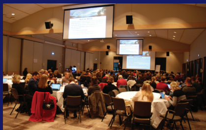
Fylkesmann Knut Storberget på klimakonferanse i november 2019.

“Vi er den første generasjonen som reelt opplever konsekvenser av klimaendringene, og vi er den siste generasjonen - som på en ordentlig måte - kan gjøre noe med det!”