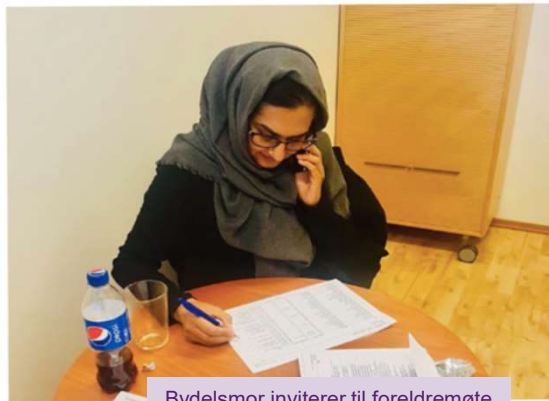
Bydelsmor inviterer til foreldremøte på Stovner videregående