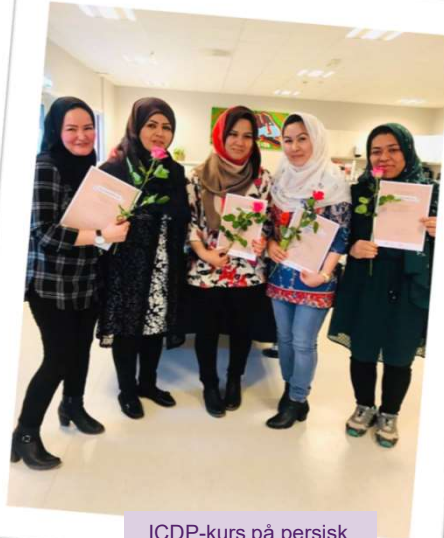
ICDP-kurs på persisk arrangert av bydelsmor