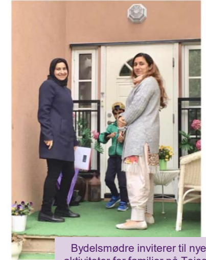
Bydelsmødre inviterer til nye aktiviteter for familier på Teisen