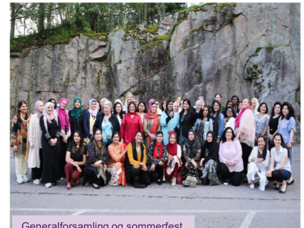
Generalforsamling og sommerfest for bydelsmødre i hele Oslo