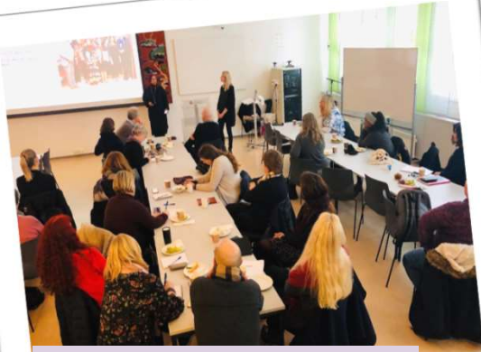
Frokostmøte for tjenesteområdene i bydel Stovner, Alna, Grorud og Østensjø