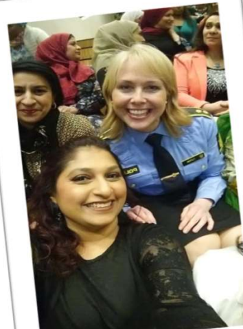
Samarbeid med Politiets minoritetskontakt