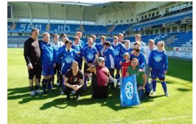
MFK UH-laget – fotballaktivitet, treninger, kamper turneringer