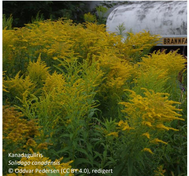
Kanadagullris Solidago canadensis © Oddvar Pedersen (CC BY 4.0), redigert

Jarenvatnet NR, Lågendeltaet NR & Åkersvika NR.