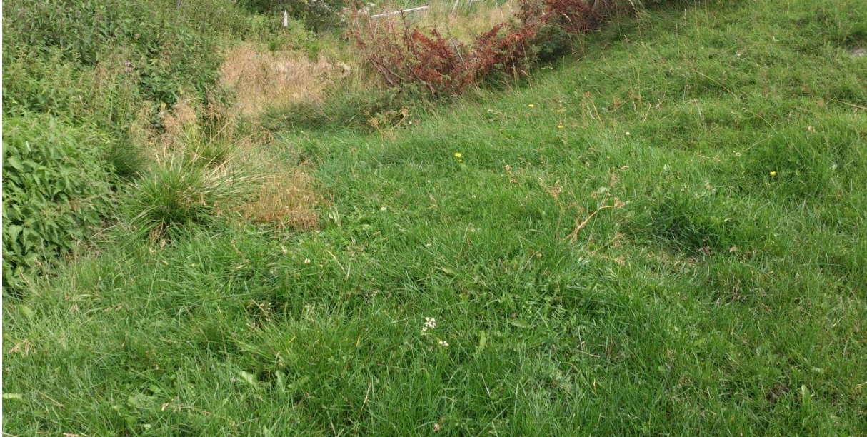
Foto 4. Innmarksbeite - middels fuktig, urterik grasmark med høy dekningsgrad av engkvein, gulaks, rødsvingel og rapparter – forsøksvert B.