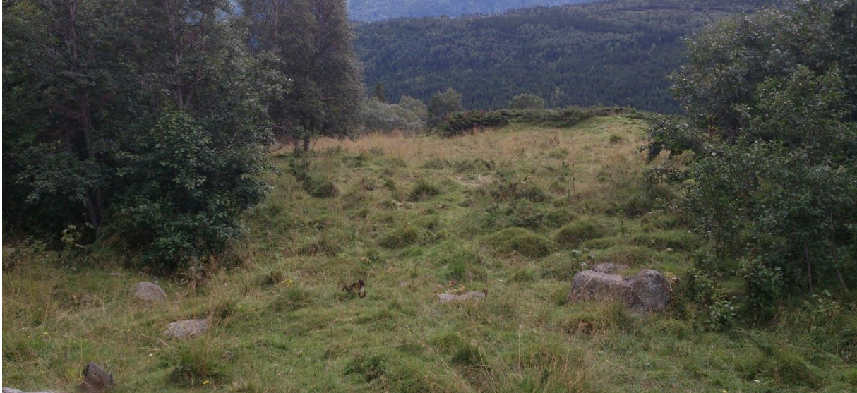
Foto 2. Innmarksbeite - fuktig mark, sølvbunke dominerende grasart – forsøksvert B.