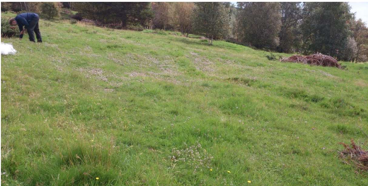
Foto 3. Innmarksbeite - tørrlendt, urterik grasmark med høy dekningsgrad av engkvein, gulaks, rødsvingel og rapparter – forsøksvert A.