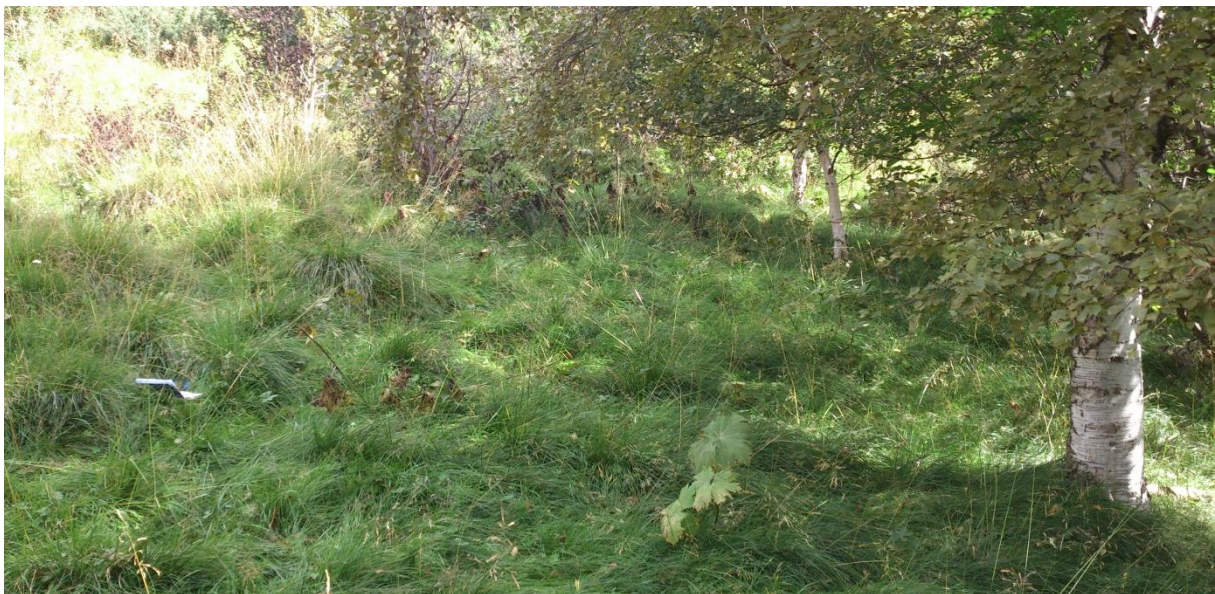
Foto 1. Innmarksbeite - fuktig mark, sølvbunke dominerende grasart – forsøksvert A.

De to utvalgte innmarksbeitene var artsrike, hadde generelt god grasdekning og syntes å være meget representative for beitekvaliteten en kan finne på gode innmarksbeiter. Begge beiten ble beitet om sommeren, hos forsøksvert A av sau og hos forsøksvert B av storfe.