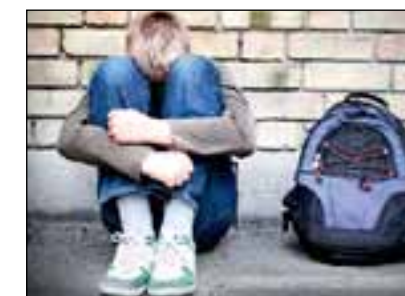
Mobbing i skolen skal ikke tolereres. Ansvaret for at mobbing ikke skal skjue, ligger hos skolens ledelse og lærere.

-Med det fokus som er satt på mobbing, er det viktig å få fram at det også skjer mye bra i Fræna-skolen: Vi har et lærerkorps bestående av personer med stor kompetanse. Og alle de jeg treffer