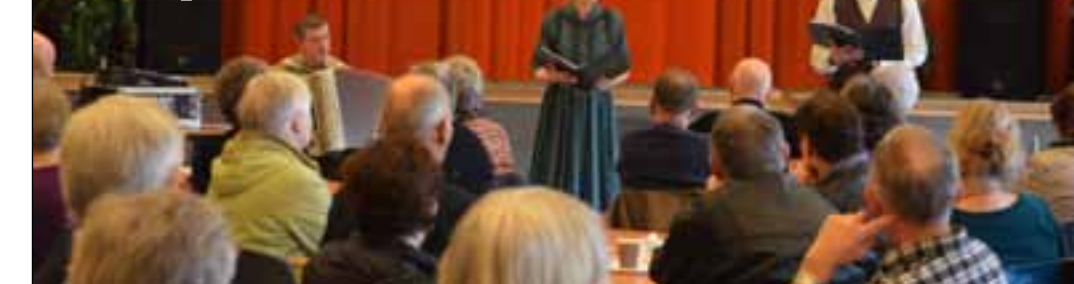
Teatret Vårt med forestillingen «Tideverv» på pensjonistkafe i Malmefjorden.

Ordningen med den kulturelle spaserstokk ble etablert i 2007 og er en oppfølging av stortingsmeldingen "Mestring, muligheter og mening. Framtidas omsorgsutfordringer" utgitt av Helse- og omsorgsdepartementet i 2005 og en avtale om konkretisering av "Omsorgsplan 2015 og 2020", også utgitt av Helse- og omsorgsdepartementet. Midlene skal hovedsakelig benyttes til profesjonell kunst- og kulturformidling av høy kvalitet, gjerne i samarbeid med kunst- og kulturinstitusjoner, kunstnere og andre kulturaktører på lokalt eller regionalt nivå. Nyskaping og utvikling av tilbud skal prioriteres.