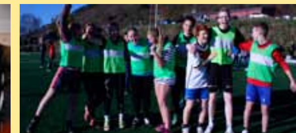
Skulecupen vart avvikla på den nye kunstgras-banen i haust. Vinnarar i år var klasse 10C.