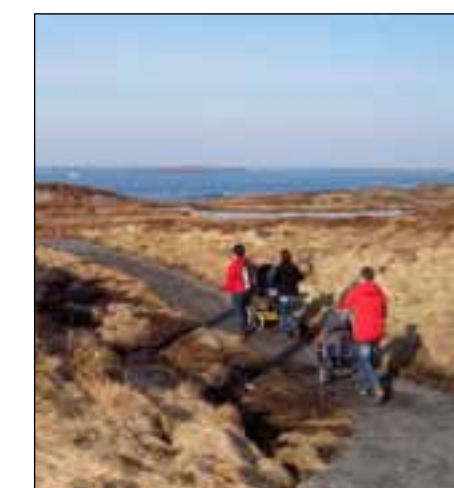
Kyststien i Bud.

Dette viser at det er viktig med slike «anlegg». Denne prioriteringen gjør at enda flere av oss klarer å ta i bruk naturen. Og det legges til rette for at folk som har nedsatt funksjonsevne eller er avhengig av rullestol, også kommer seg ut.