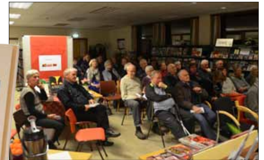
Fra lanseringen av "Gammalt frå Fræna" på Fræna folkebibliotek.

Det er 34. årgang som nå gis ut, og gjennom årenes løp har det blitt 8000 sider med historisk materiale. Det er kulturavdelinga som gir ut Gammalt frå Fræna i samarbeid med Fræna Sogelag, Bud Sogelag og Hustad Sogelag.