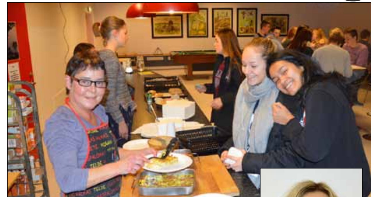
I den nye kantina serveres det god, sunn og rimelig mat.

-Alt starter med ledelsen og lærerne, fortsetter hun. -Hvis de ikke trives og samarbeider godt, vil det kunne påvirke elevgruppene negativt. Ved skolen har det hele tiden vært fokus på å ha en god balanse mellom fordelingen av menn og kvinner i arbeids-stokken og høy trivsel i lærergruppen (50/50).