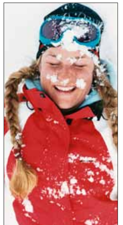
Fræna Friskliv jubilerer.

gjennomført i vår med gode tilbakemeldinger fra deltakerne. Neste kurs starter i uke 9 og går over fem ettermiddager med en ukes mellomrom fra kl. 16:30-19:30. Det er begrenset antall plasser.