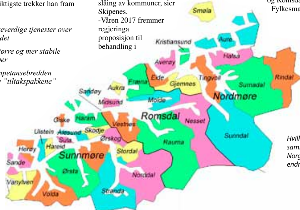
Hvilke kommuner slås sammen? Kommune-Norge foran store endringer.

Medlemmene i gruppa utgjøres av representanter for regionråda (styreleder og daglig leder). Kommunenes Sentralforbund, leder for rådmanns-utvalget, Møre og Romsdal fylke og Fylkesmannen.