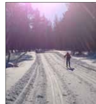
Fristende for de fleste av oss.