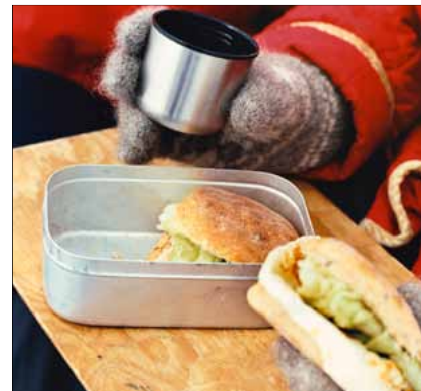
Ut på tur! Da hører også god niste med.

Formålet med kurset er å gi deltakerne praktiske tips og øvelser som kan gjøre det lettere å håndtere hverdagen når det røyner på. Kurset bygger på kognitiv teori, egenkraftmobilisering og Mindfulness/tilstedeværelse. Det første kurset var fullt og ble