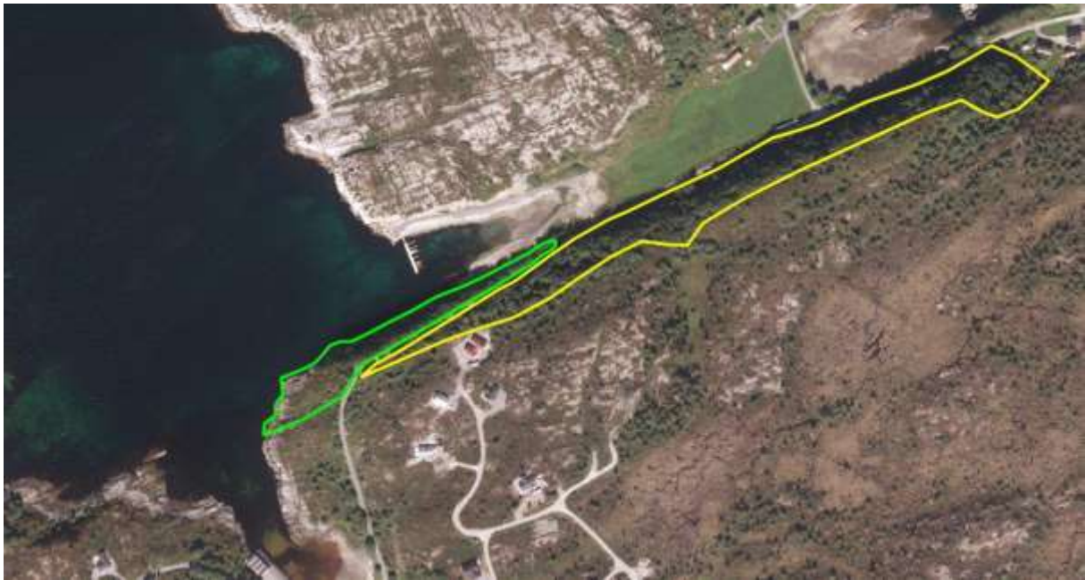
Figur 10. Avgrensing. Lokaliteten er avgrensa med gult.