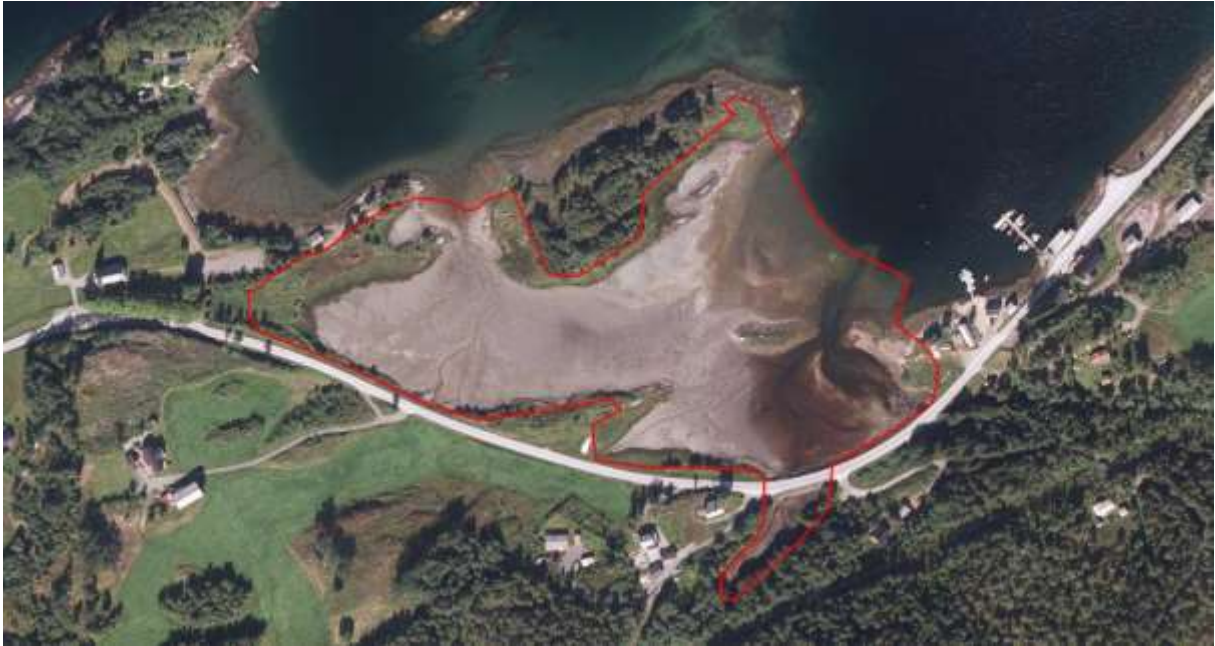
Figur 25. Avgrensing.