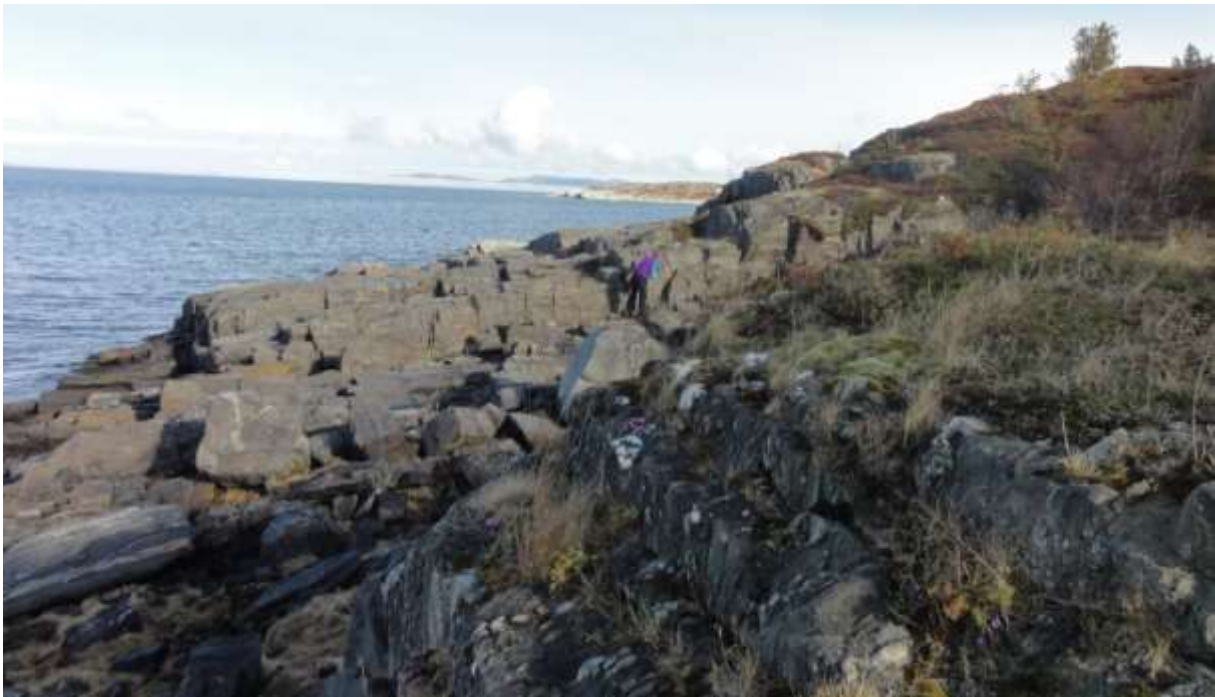
Figur 5. Tatt frå vest mot aust.