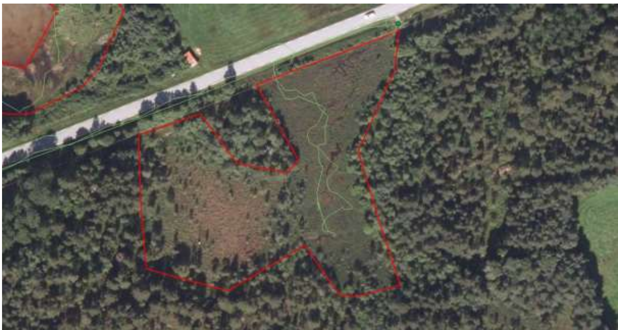
Figur 23. Avgrensing

Artskart: http://artskart.artsdatabanken.no/