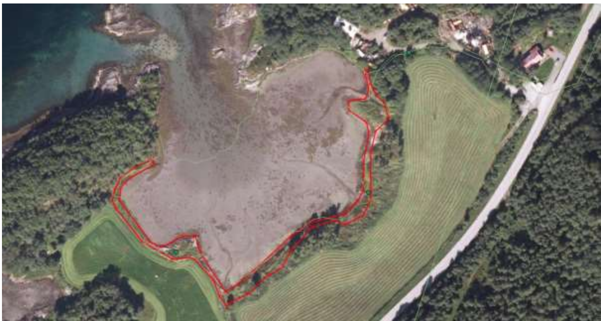
Figur 18. Avgrensing.

Verdivurdering: Etter faktaark for naturtypen frå desember 2014 oppnår lokaliteten låg vekt for parametra areal (ca 3 daa), artsmangfald og raudlisteartar, og låg til middels vekt for parametret tilstand. Ut frå dette får lokaliteten verdien Lokalt viktig - C .