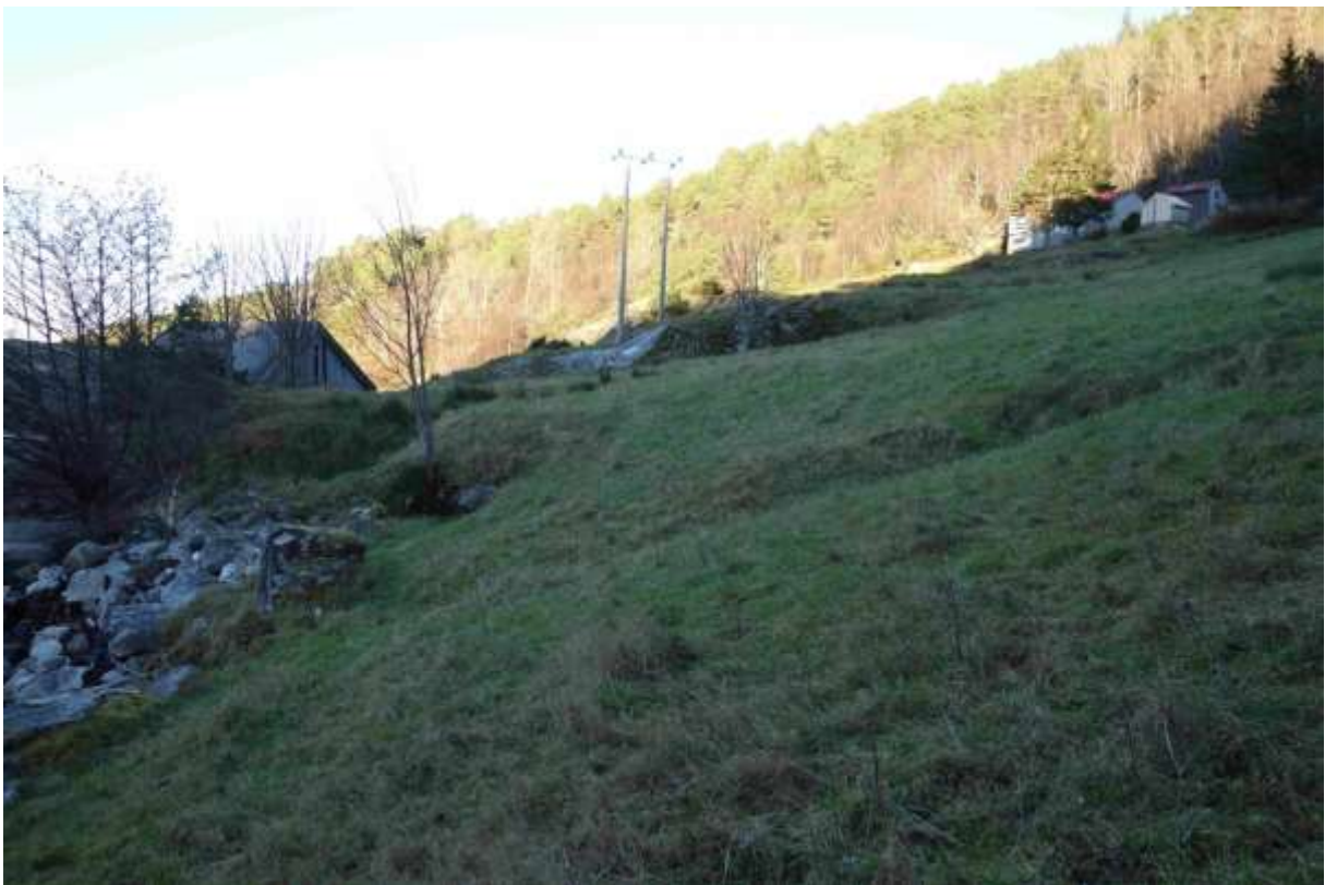
Figur 39. Frå sør mot nord. Biletet er teke heilt nede ved sjøen.