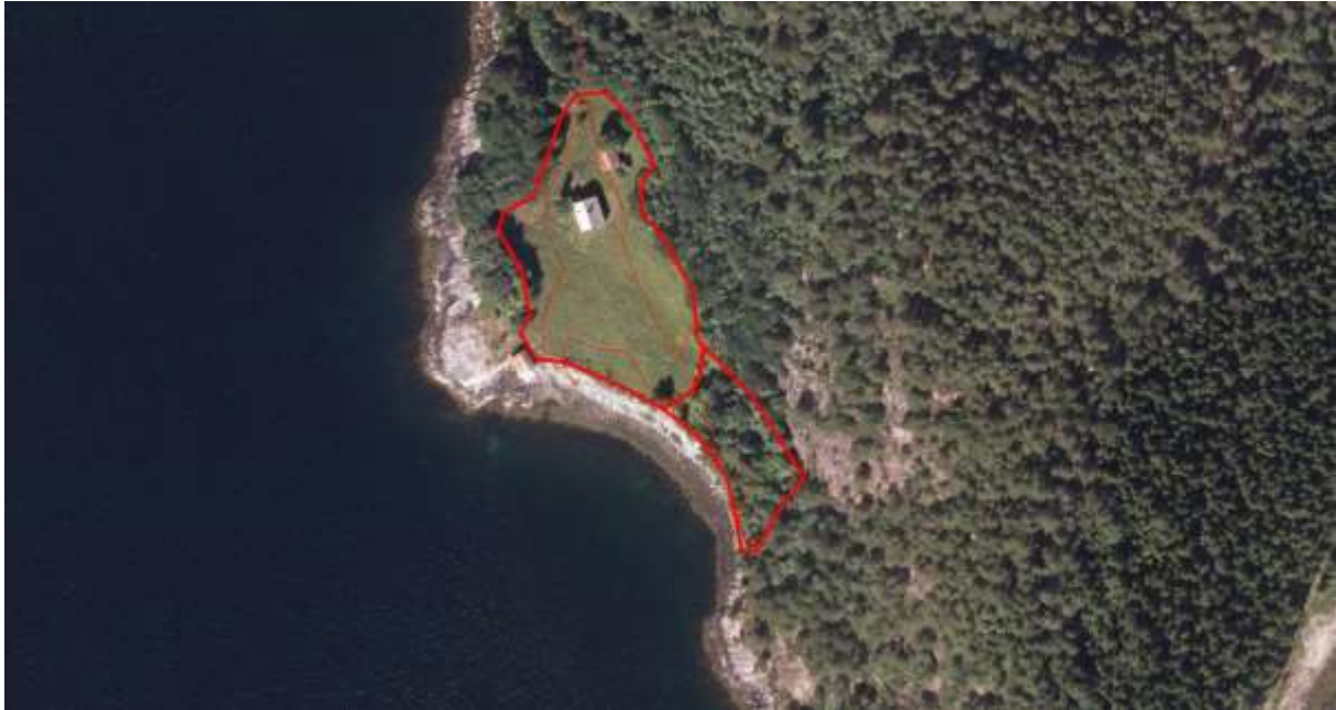
Figur 56. Avgrensing.