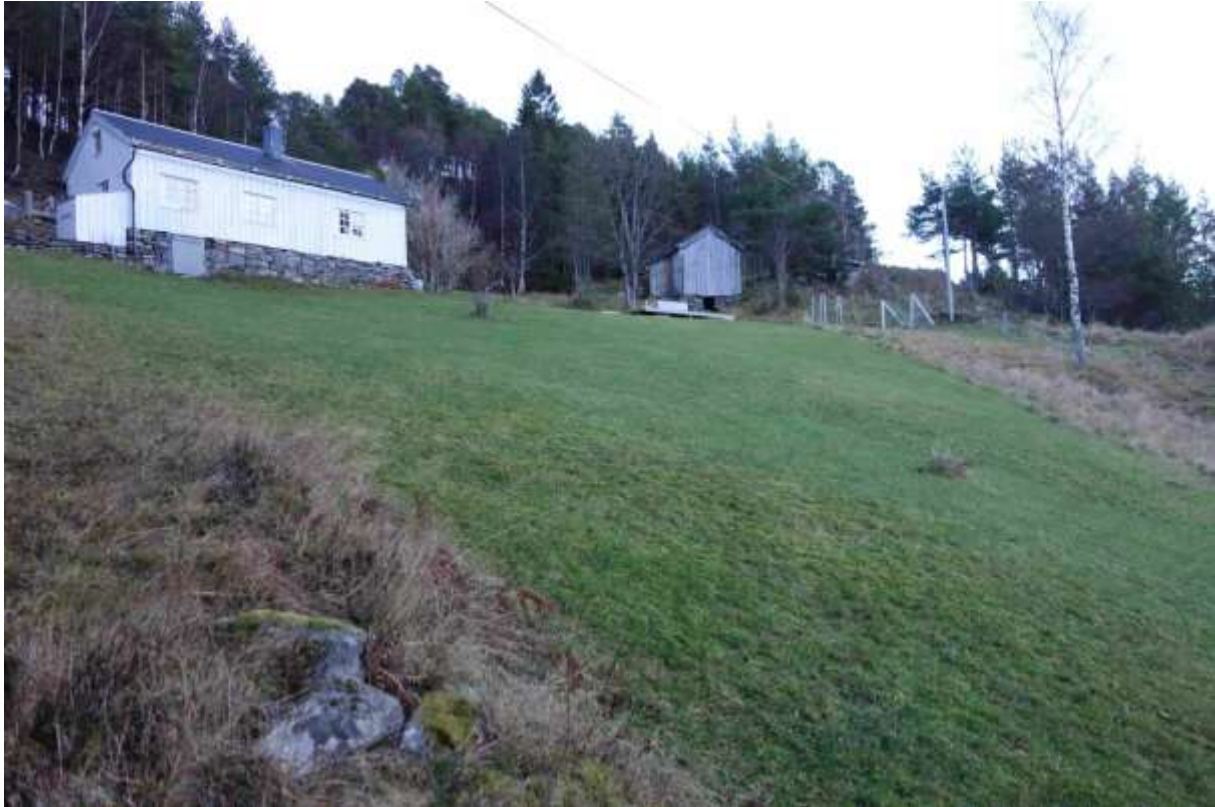
Figur 43. Biletet er teke nede ved sjøen og oppover mot husa.