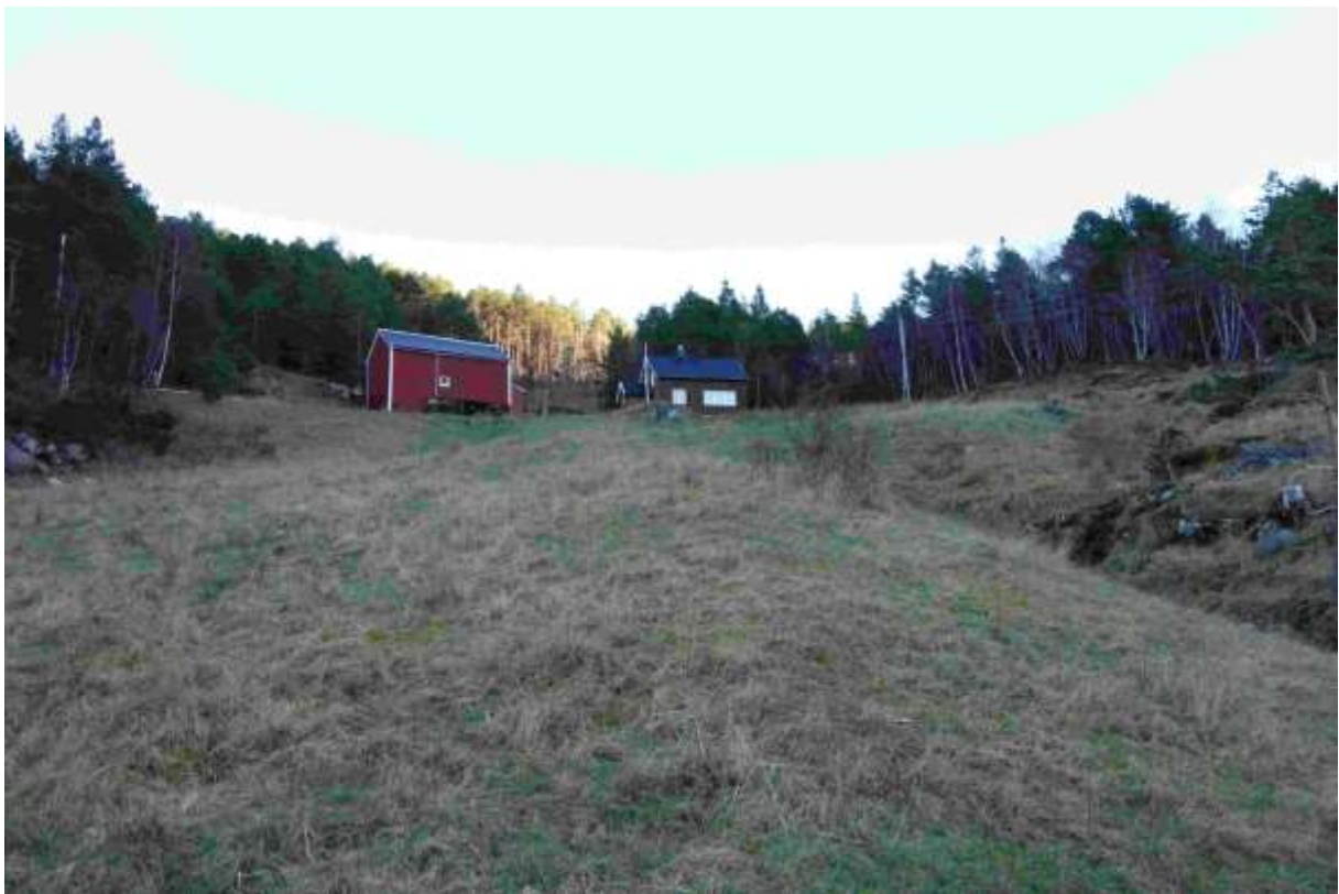
Figur 41. Delar av lokaliteten frå sjøen og opp mot husa.