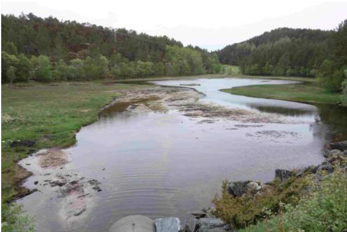
Figur 7 Biletet viser lokaliteten frå nord mot sør. Fotografen står på vegen, og ein skimtar avløpsrøret under vegen i nedre kant av biletet.