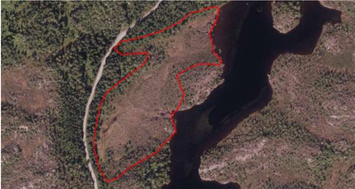
Figur 46. Avgrensing.