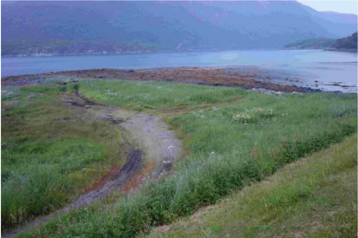
Figur 32. Nord for veggen