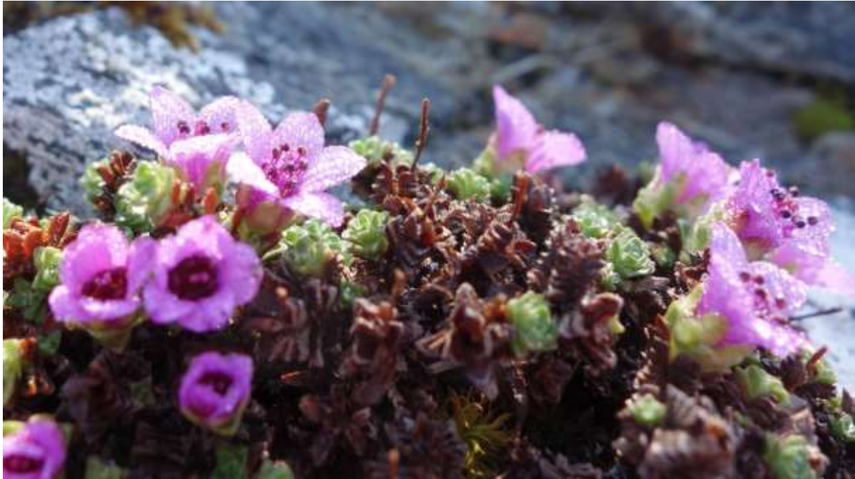
Figur 12 Raudsildre.