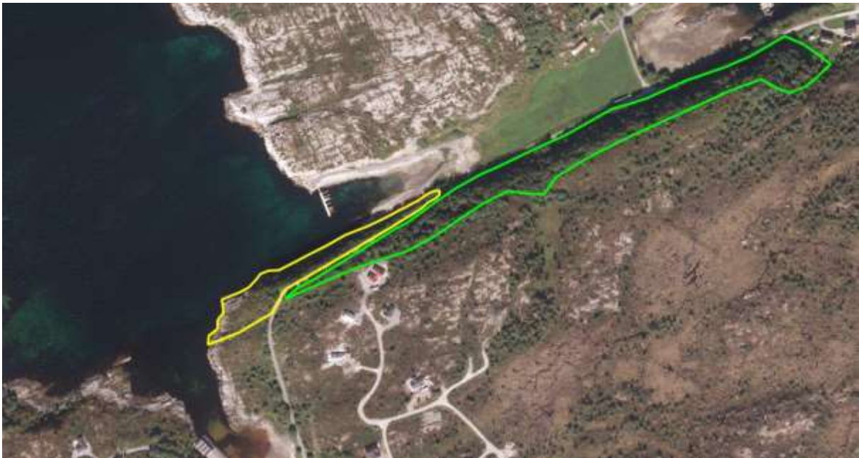
Figur 15. Avgrensing.

Lok. nr. 8. Tverrbotnen. Slåttemyr Verdi: Viktig - B.