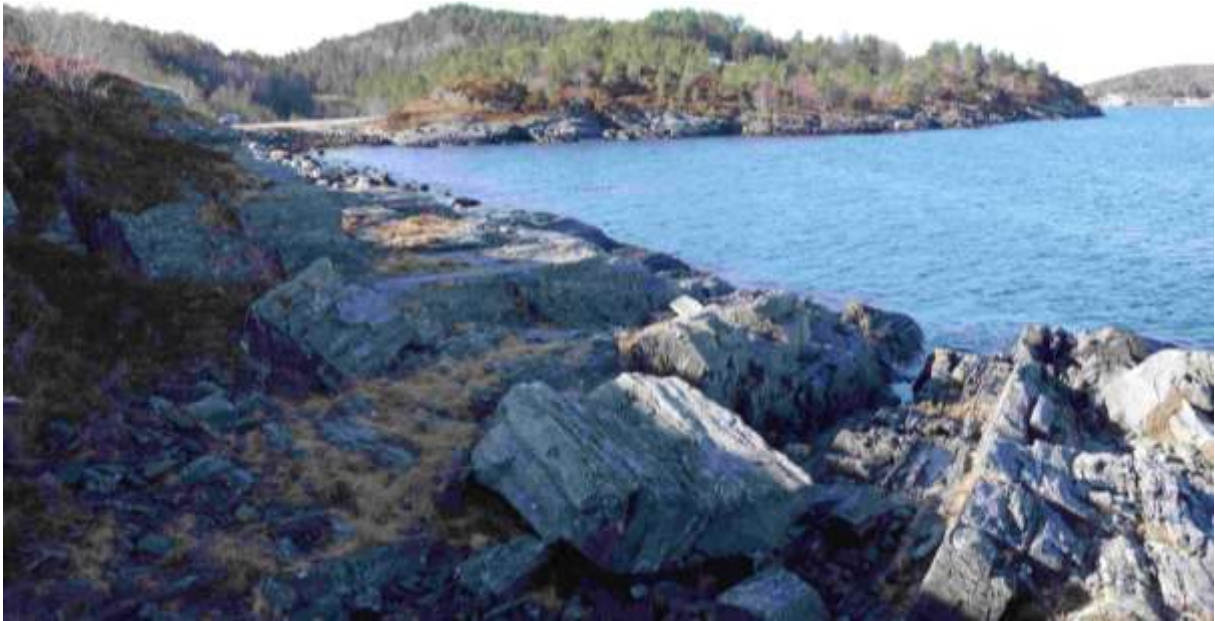
Figur 4. Tatt frå aust mot vest