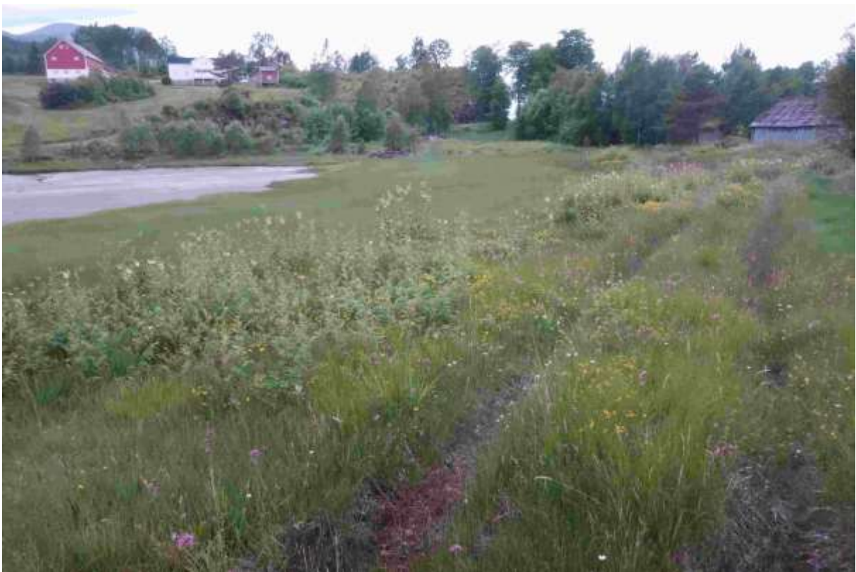
Figur 28. Den sørlegaste delen av strandenga nær Stemshaug kyrkje.