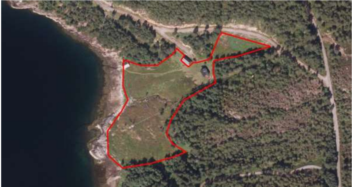
Figur 40. Avgrensing