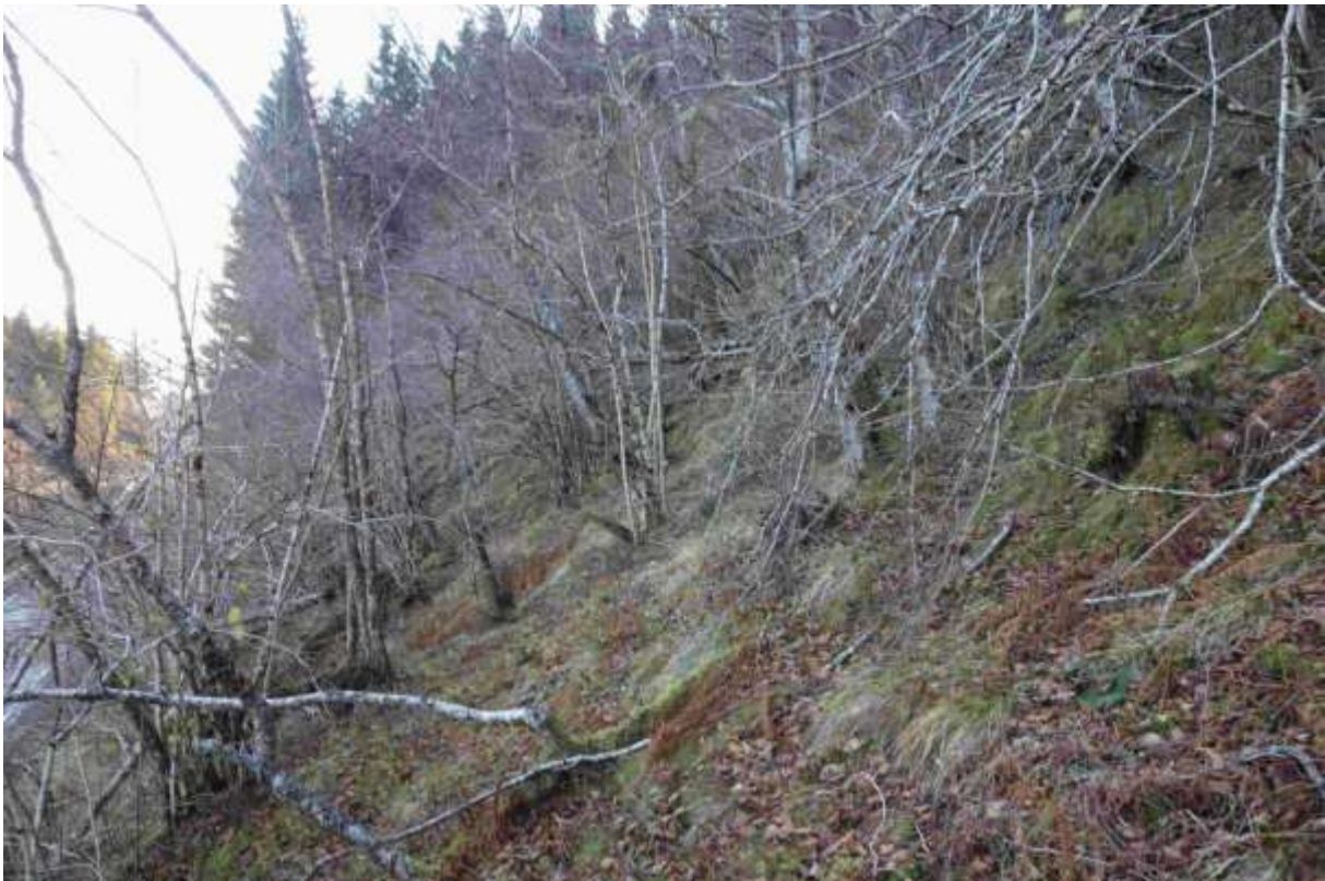
Figur 53. Biletet er teke frå nord mot sør.