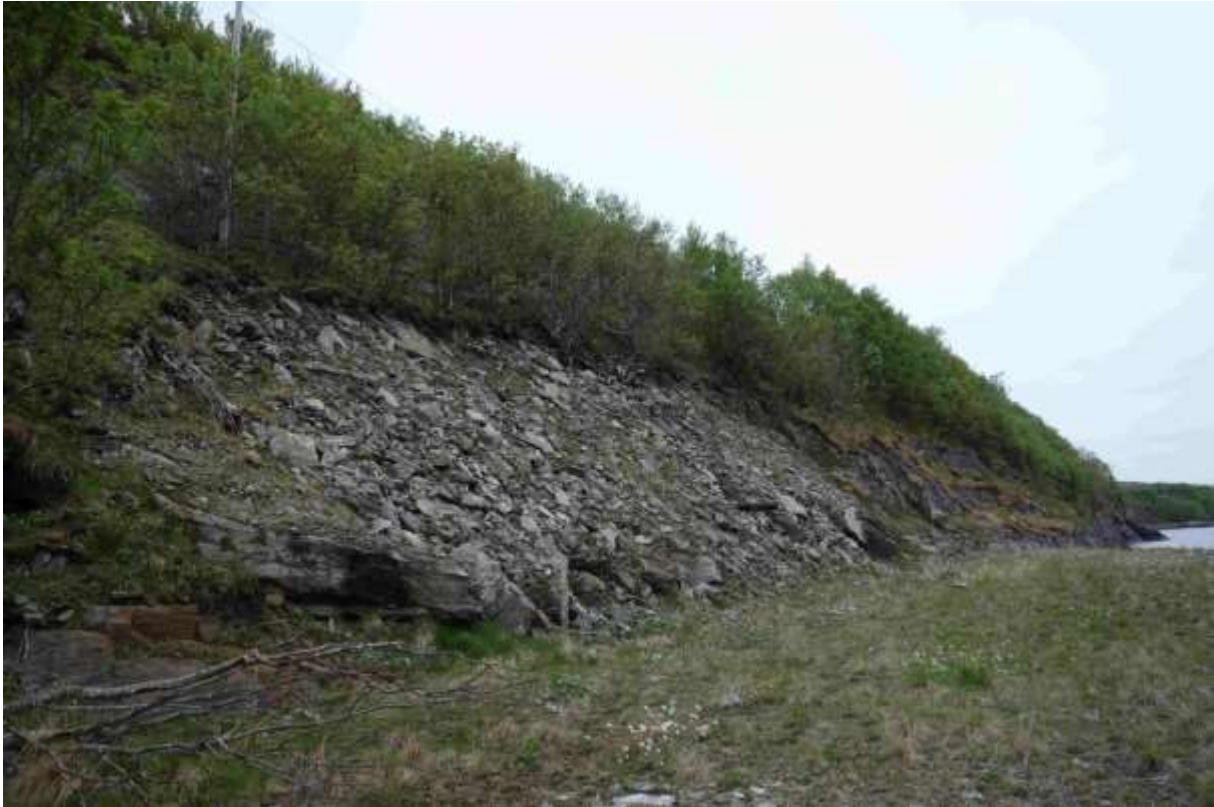
Figur 14 Delar av lokaliteten sett frå aust. Her ser ein massen som er graven ut. Vegen går oppe i lia, og berget held fram ovanfor dette.