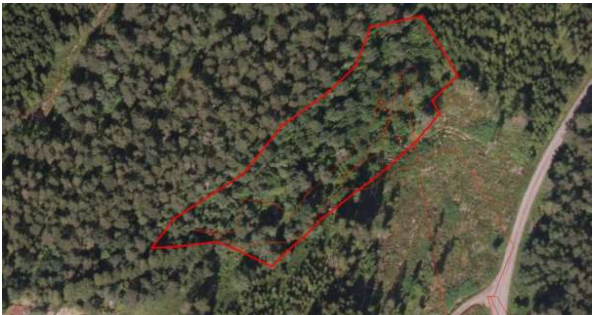
Figur 48. Avgrensing

Finn Oldervik, private artslistar for Aure