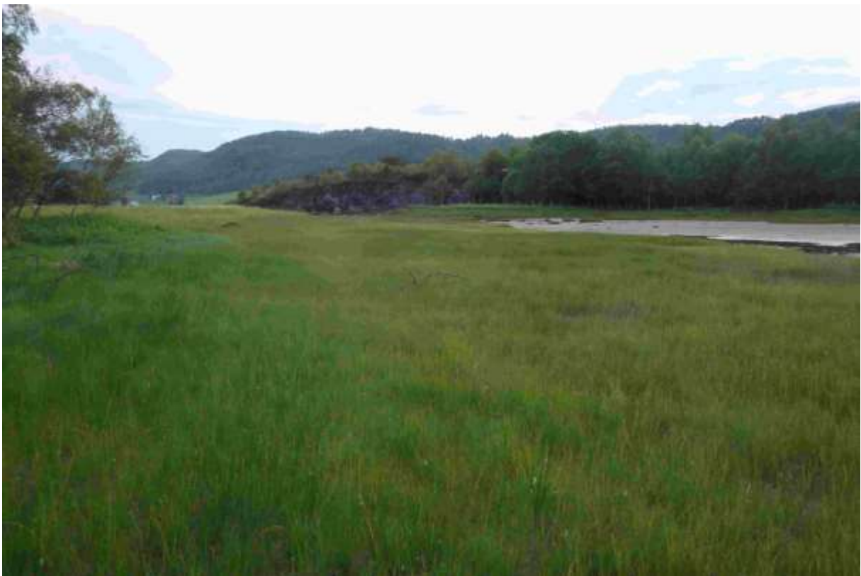
Figur 22. Inne i bukta aust i lokaliteten.