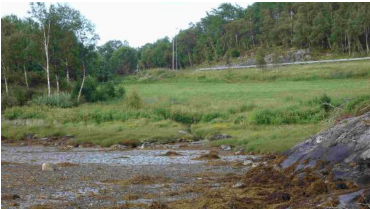
Figur 19. Biletet viser ein liten del av lokaliteten i aust.