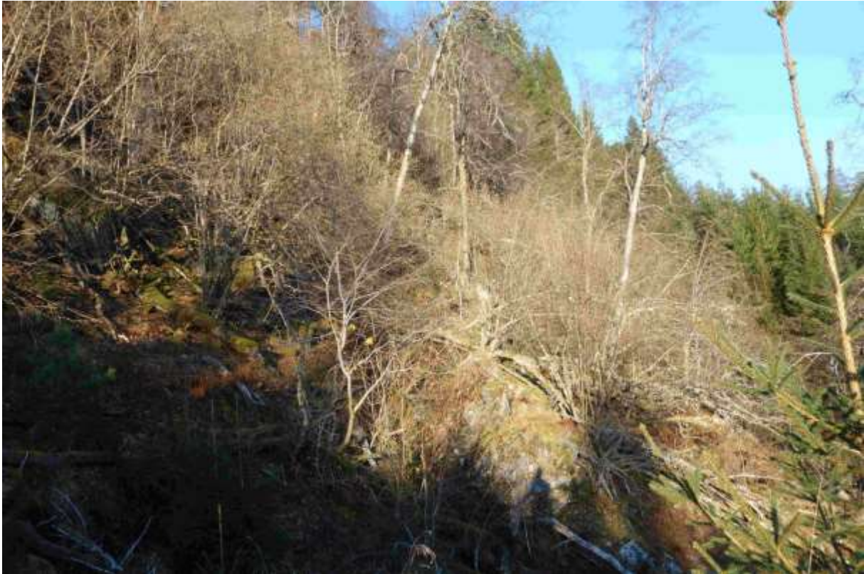
Figur 49. Nedste del av lia. Områda rundt er sterkt prega av tidlegare granplanting.