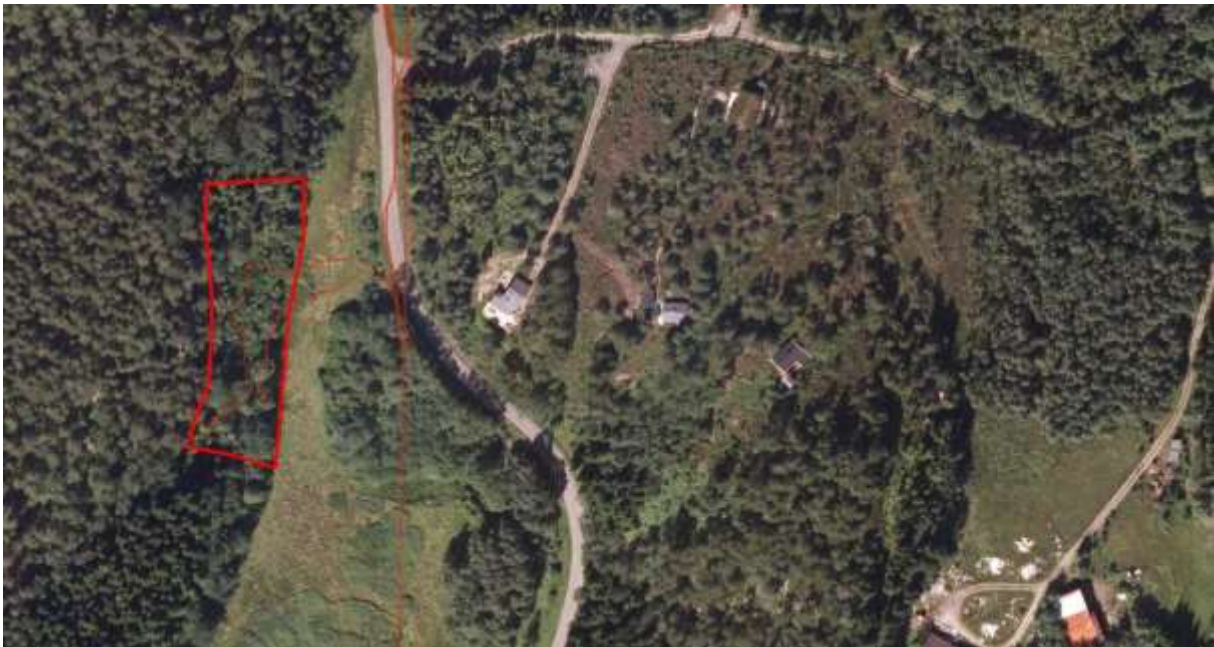
Figur 58. Avgrensing.

Verdivurdering: Etter faktaark for naturtypen frå desember 2014 oppnår lokaliteten middels vekt for parametra areal (ca 3 daa), artsmangfald, påverknad, og habitatkvalitet. I tillegg oppnår den høg vekt for parametra sjeldne og truga naturtypar og framande artar. Ut frå dette vert verdien sett til ein svak Viktig – B .