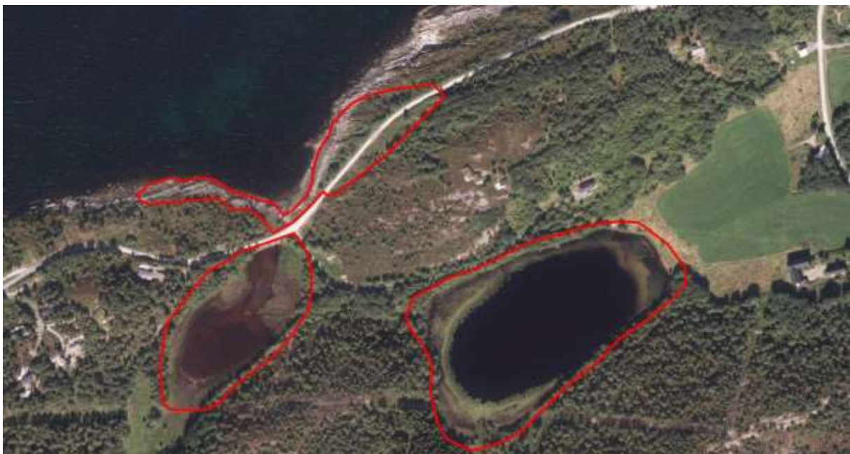
Figur 3. Avgrensing av Lok. nr. 2, Fløvalen, strandberg. Strandberga ved Fløvalen er den nordlegaste av dei tre registrerte lokalitetane i området.

Finn Oldervik, private artslistar for Aure