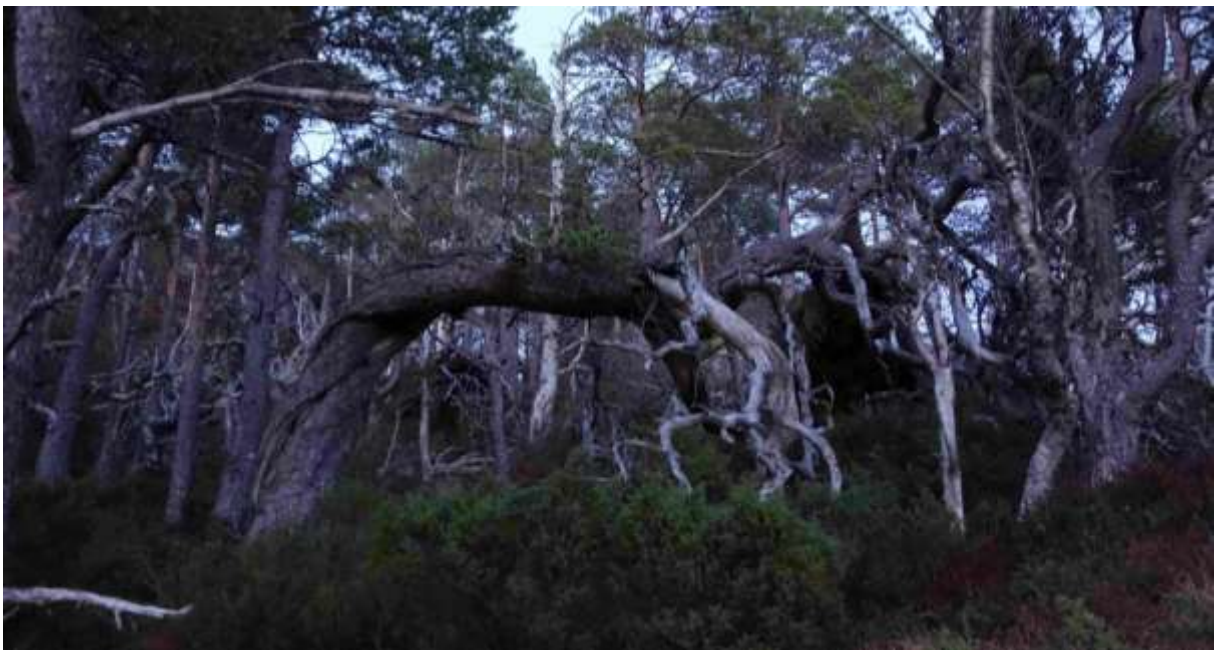
Figur 36. Liggjande død ved sør for Rishaugane.