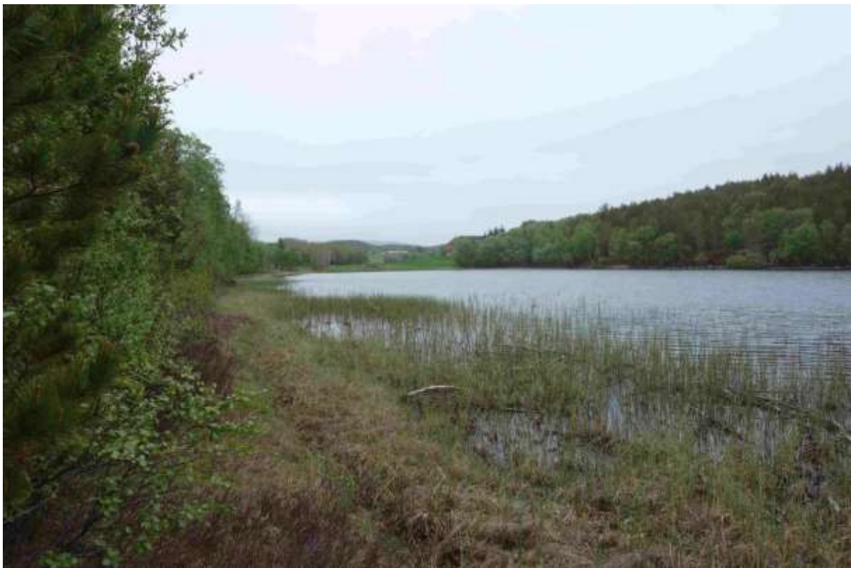
Figur Lokaliteten frå vest mot aust. Her veks sjøsivakset tett.