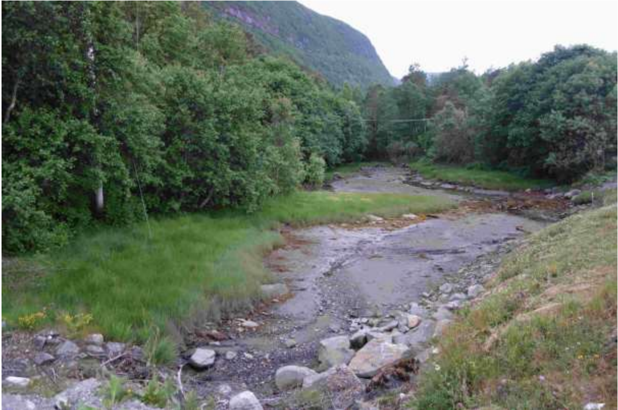
Figur 27. Sør for Fv 364.