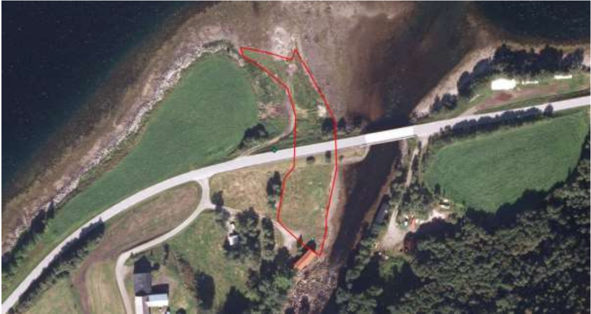
Figur 31. Avgrensing