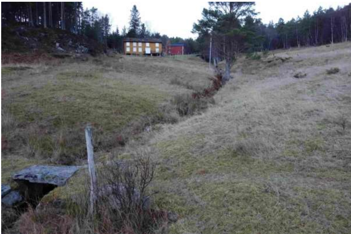
Figur 45. Lokaliteten frå sjøen opp mot husa.