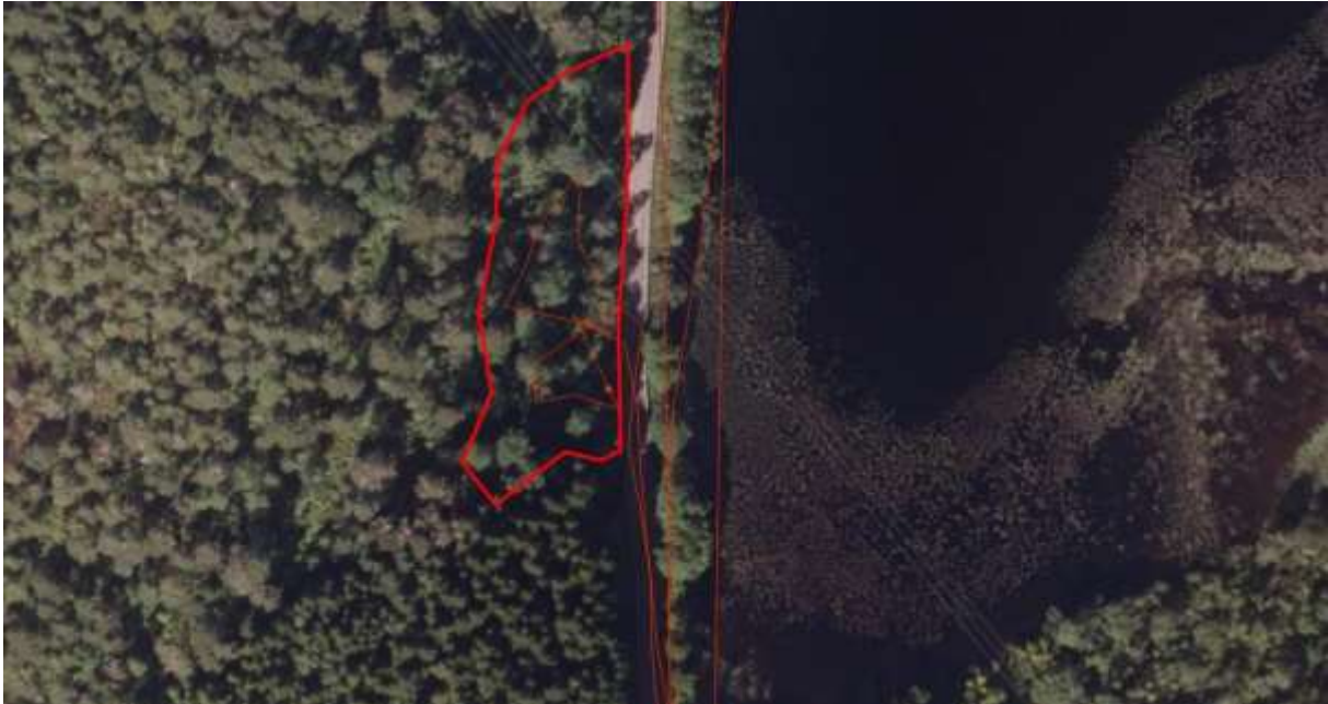
Figur 52. Avgrensing

Oldervik, F. G. 2009. Undersøking av førekomststar av lita ramslaukfluge på Nordre Nordmøre og i Trøndelagsfylka vår/sommar 2011. Bioreg AS Rapport 2011 : 14. ISBN-nr. 978-82-8215-161-0