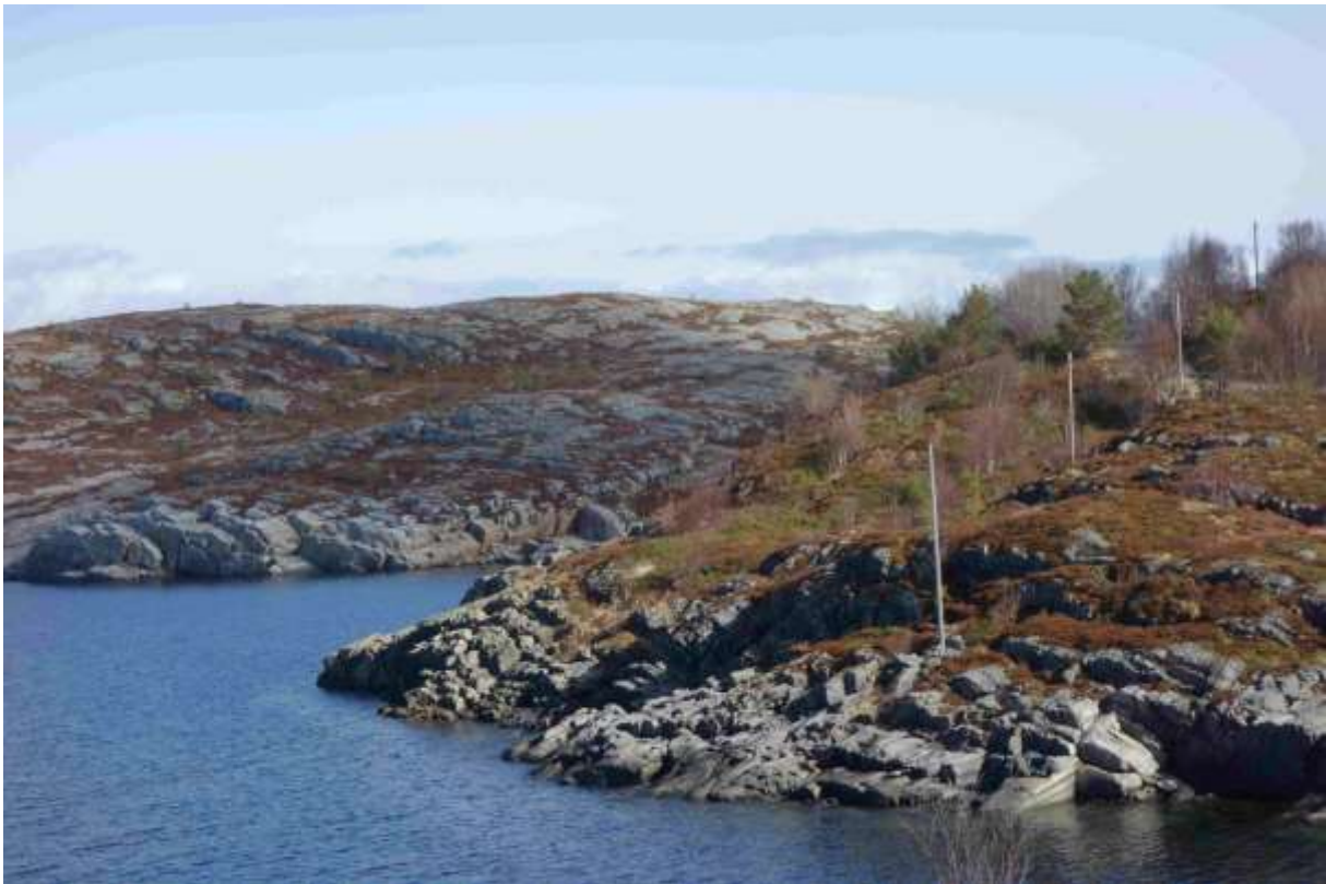
Figur 13 Lokaliteten sett frå sør. Vegen vises så vidt oppe til høgre i biletet

Finn Oldervik, private artslister for Aure