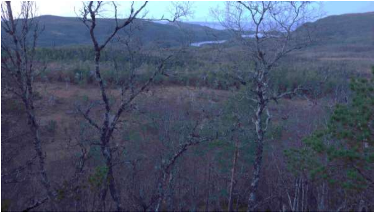
Figur 37. Frå Rishaugane mot nord. Som ein ser er det ein del ståande død ved i lokaliteten, som strekkjer seg forbi myrområde og eit stykke nedover lia.