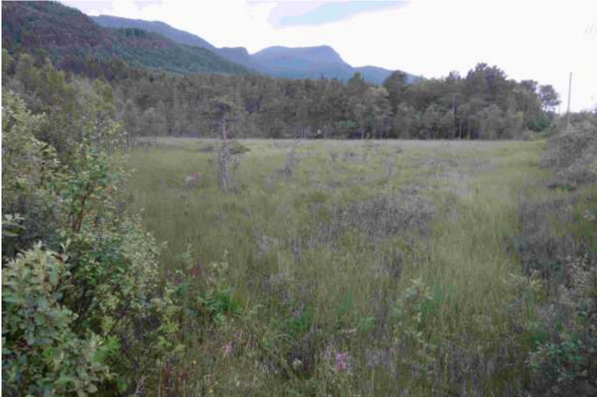
Figur 24. Biletet er teke i vegkanten frå nord mot sør.