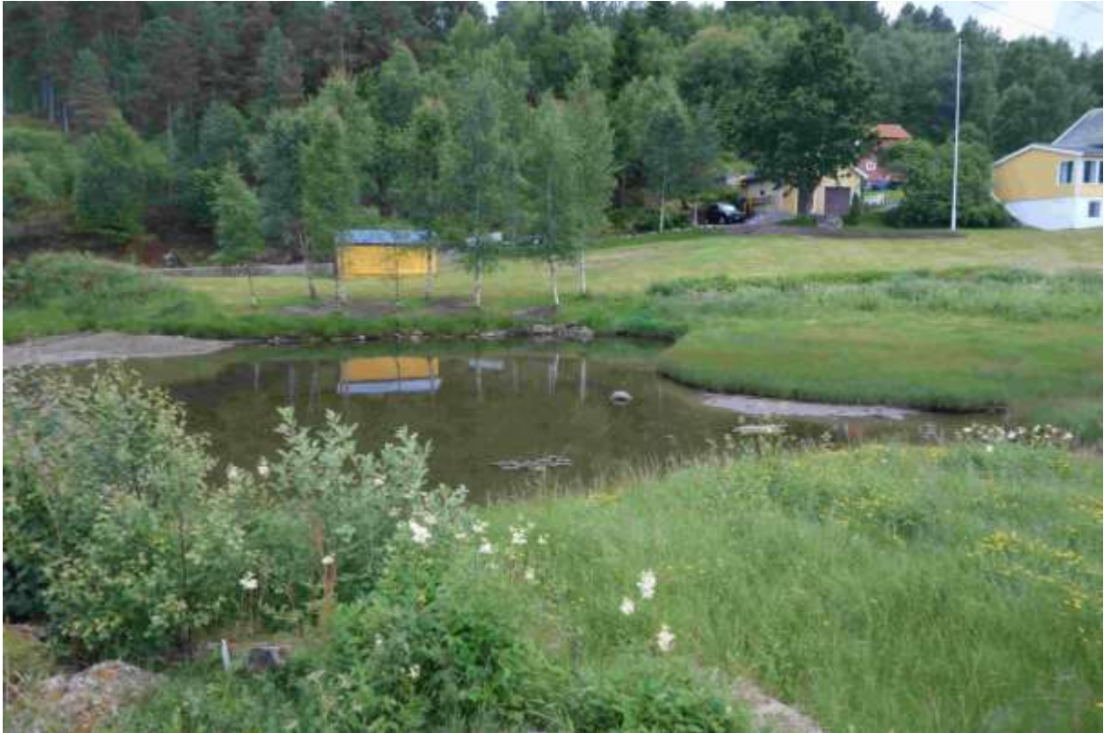
Figur 21. Sør for vegen.