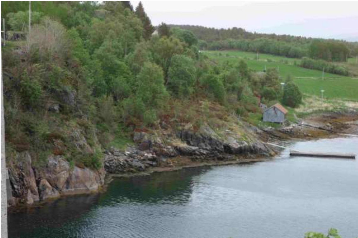
Figur 11 Biletet er teke frå Lesundbrua, og viser heile lokaliteten. Som ein ser er det delvis svært bratt her.