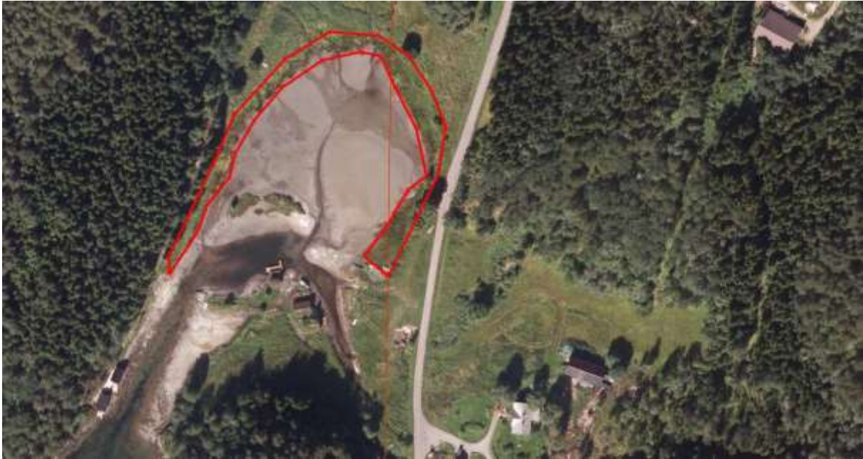
Figur 60. Avgrensing