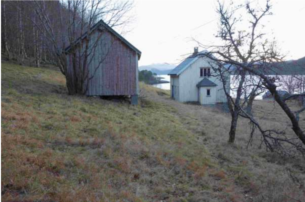
Figur 55. Frå nord mot sør. Den beste delen av slåttemarka ligg sør for husa.