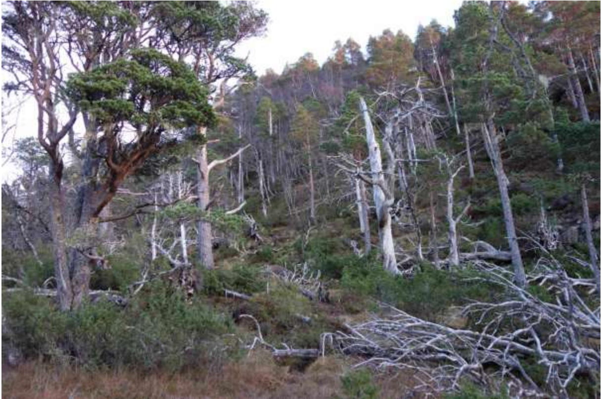
Figur 35. Nord for Ytre Rishaugen ligg mange rotvelt frå orkanen i -92. Her står også noko gadd spreidd.