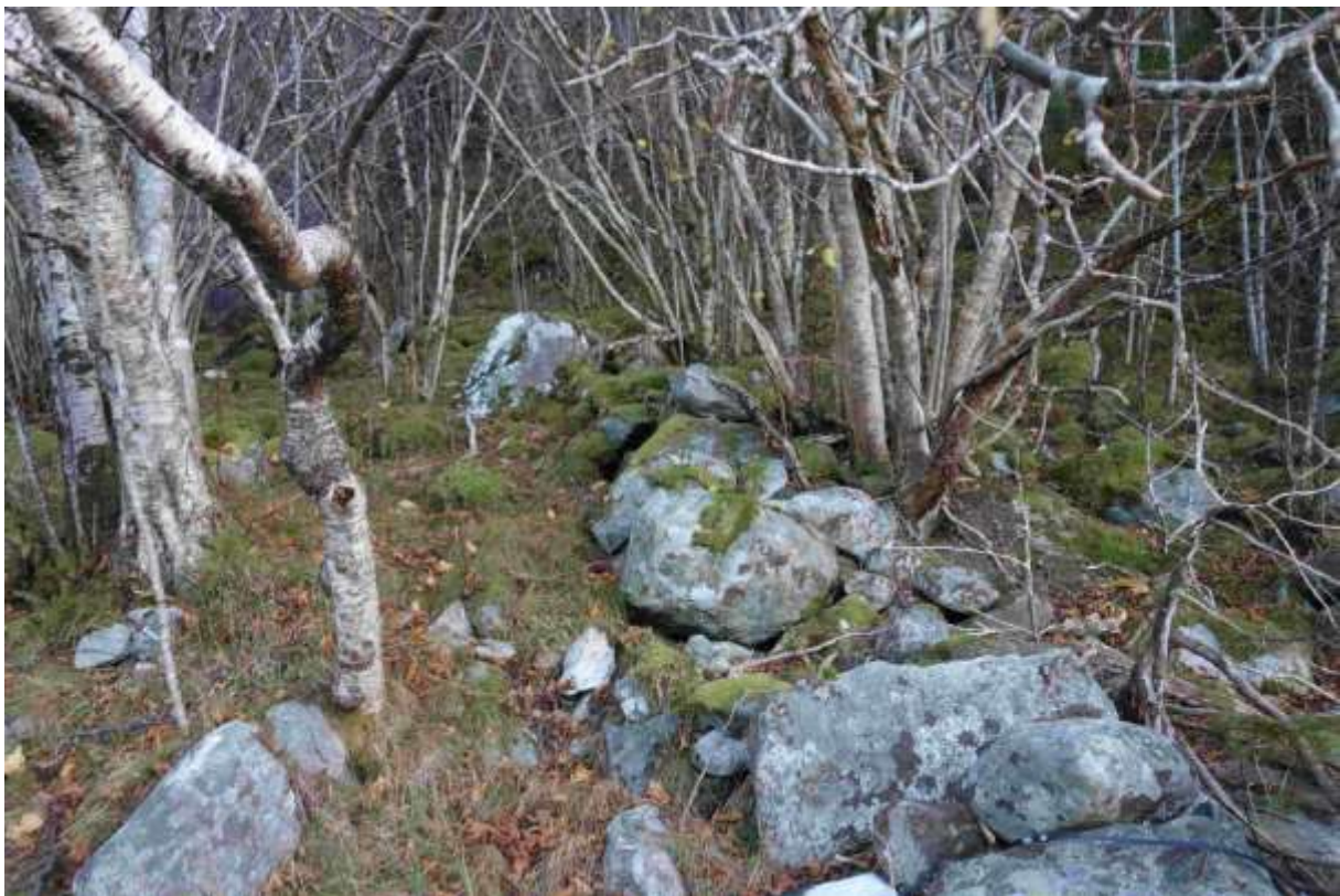
Figur 57. Gamalt steingjerde inne i skogen.