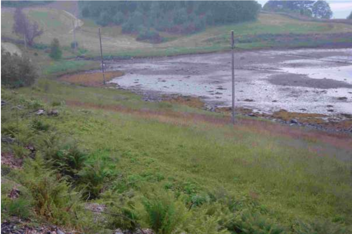
Figur 30. Frå aust mot vest.