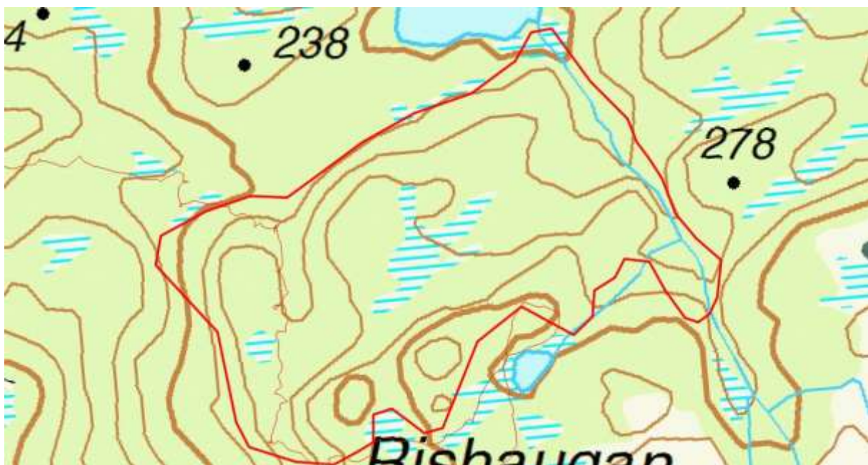
Figur 34. Avgrensing