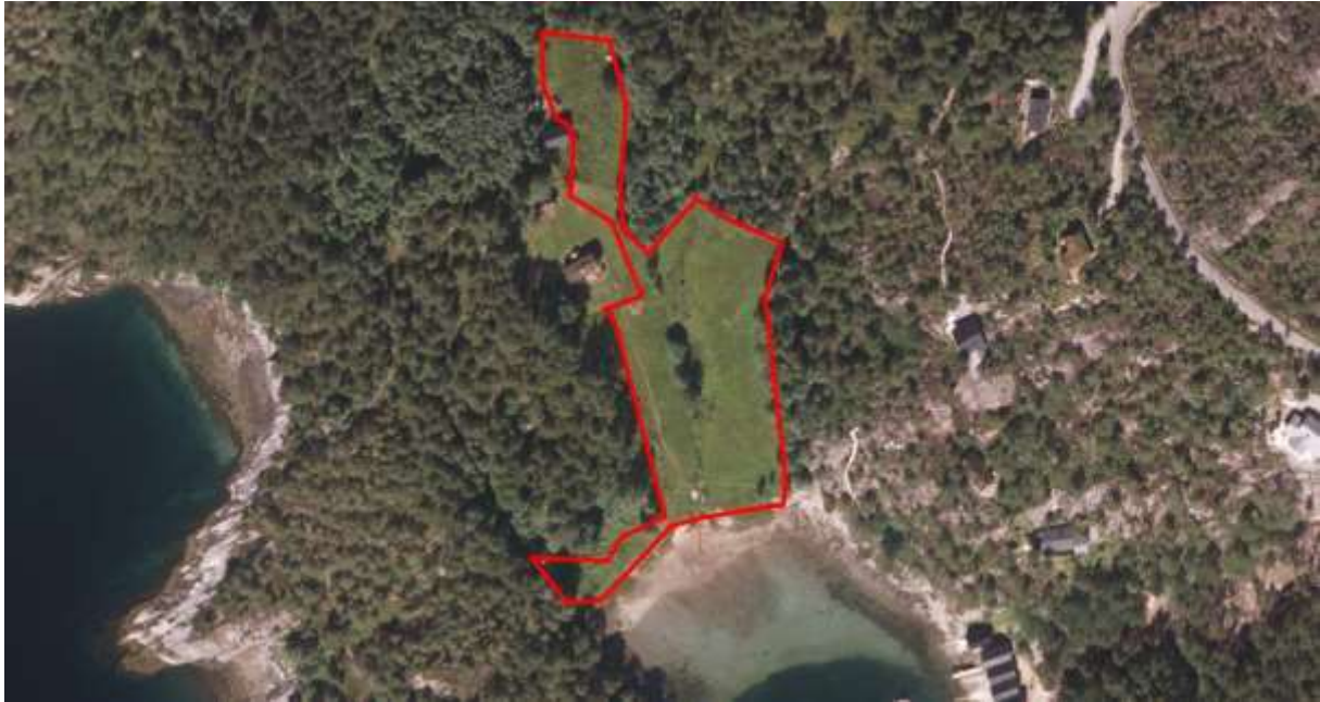
Figur 44. Avgrensing.