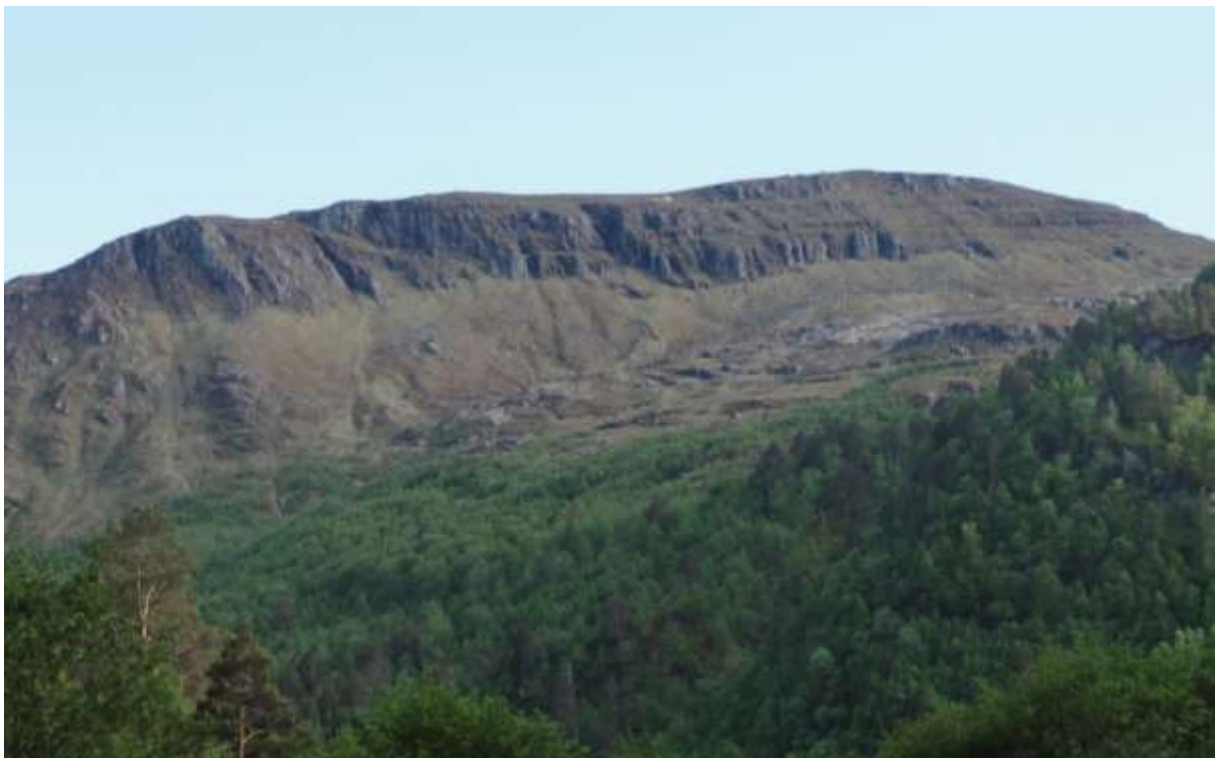
Figur 2. Dette bildet av Kvenngrøa er teke sommaren 2014 og viser lokaliteten på noko av stand.