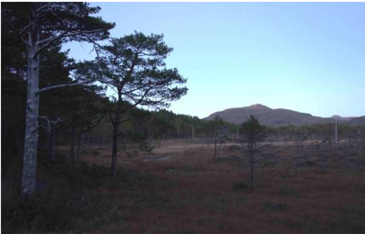
Figur 47. Frå sør mot nord. Som ein ser finst ein del daut ved i området. Truleg er ein del av skogen her gamal trass i små dimensjonar.