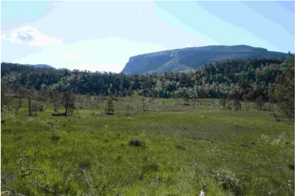
Figur 17 Nordaustre del av lokaliteten.