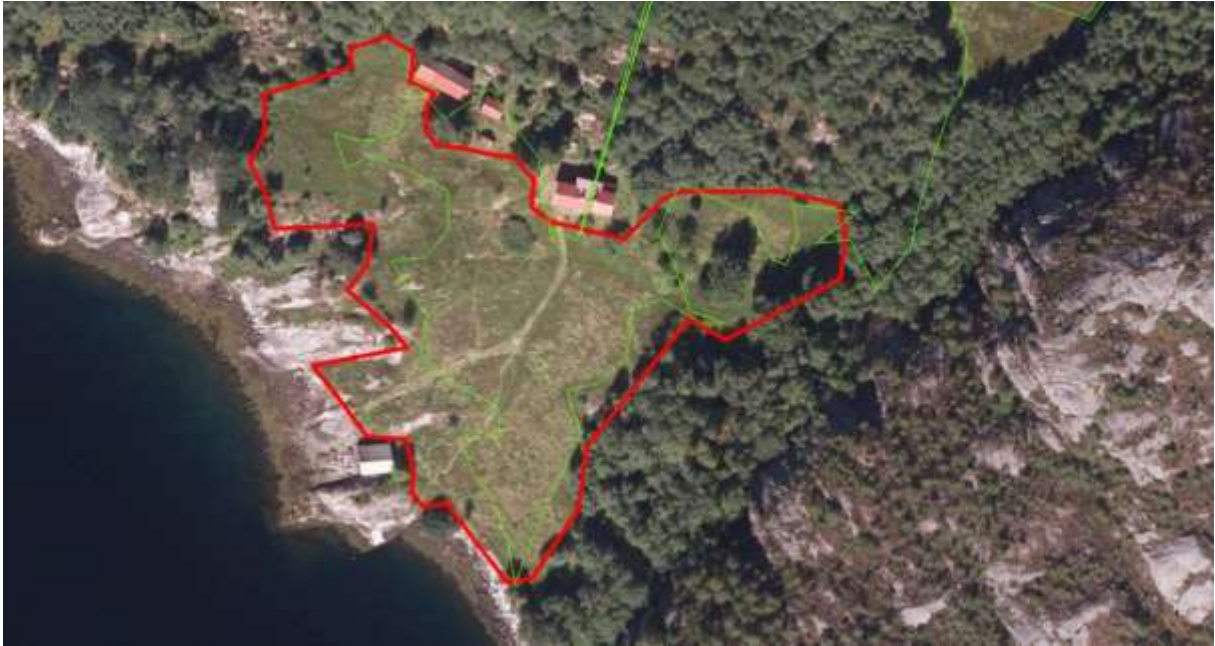
Figur 38. Avgrensing