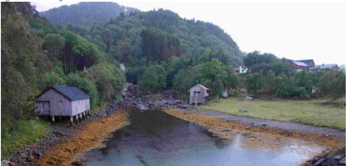
Figur 33. Sør for veggen.