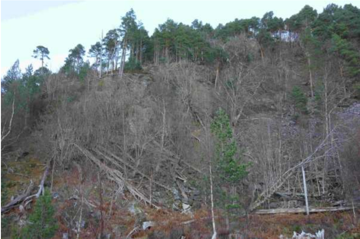
Figur 51. Her ser ein det meste av lokaliteten.