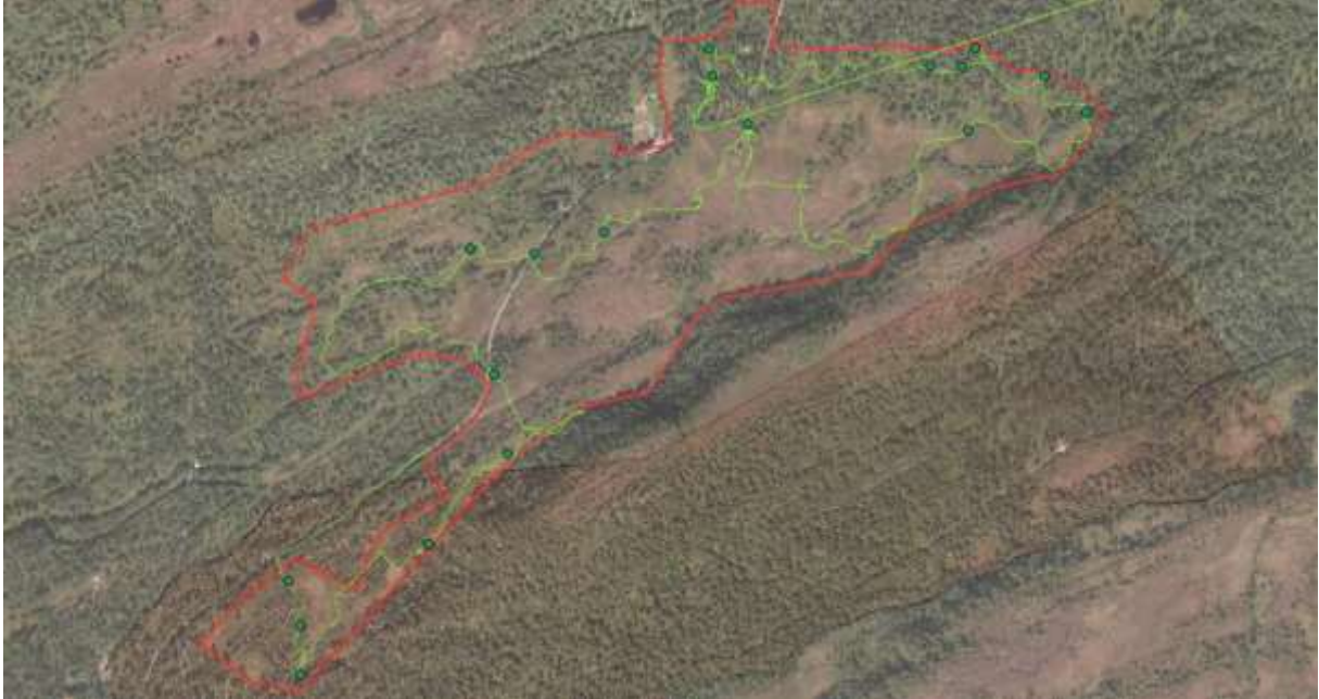
Figur 16 Avgrensing

Finn Oldervik, private artslister for Aure