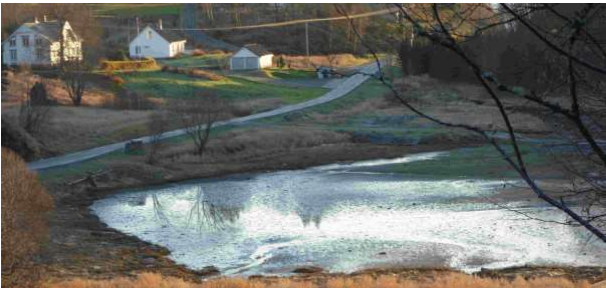
Figur 61. Den austlege delen av lokaliteten mot Fuglvåggarden.