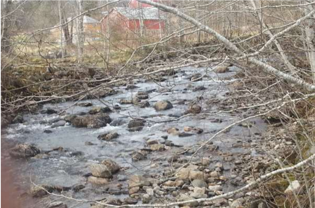
Figur 64. Her ser vi Skausetelva ved eit gammalt grustak eit par hundre meter oppom fylkesvegen.