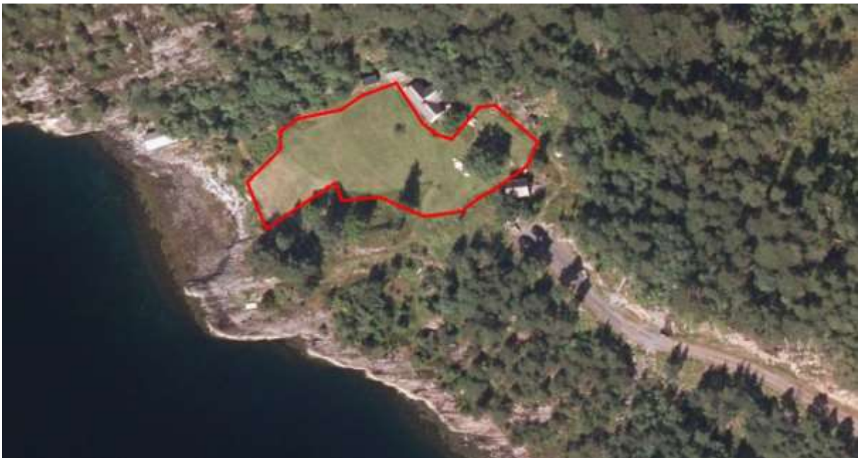
Figur 42. Avgrensing.