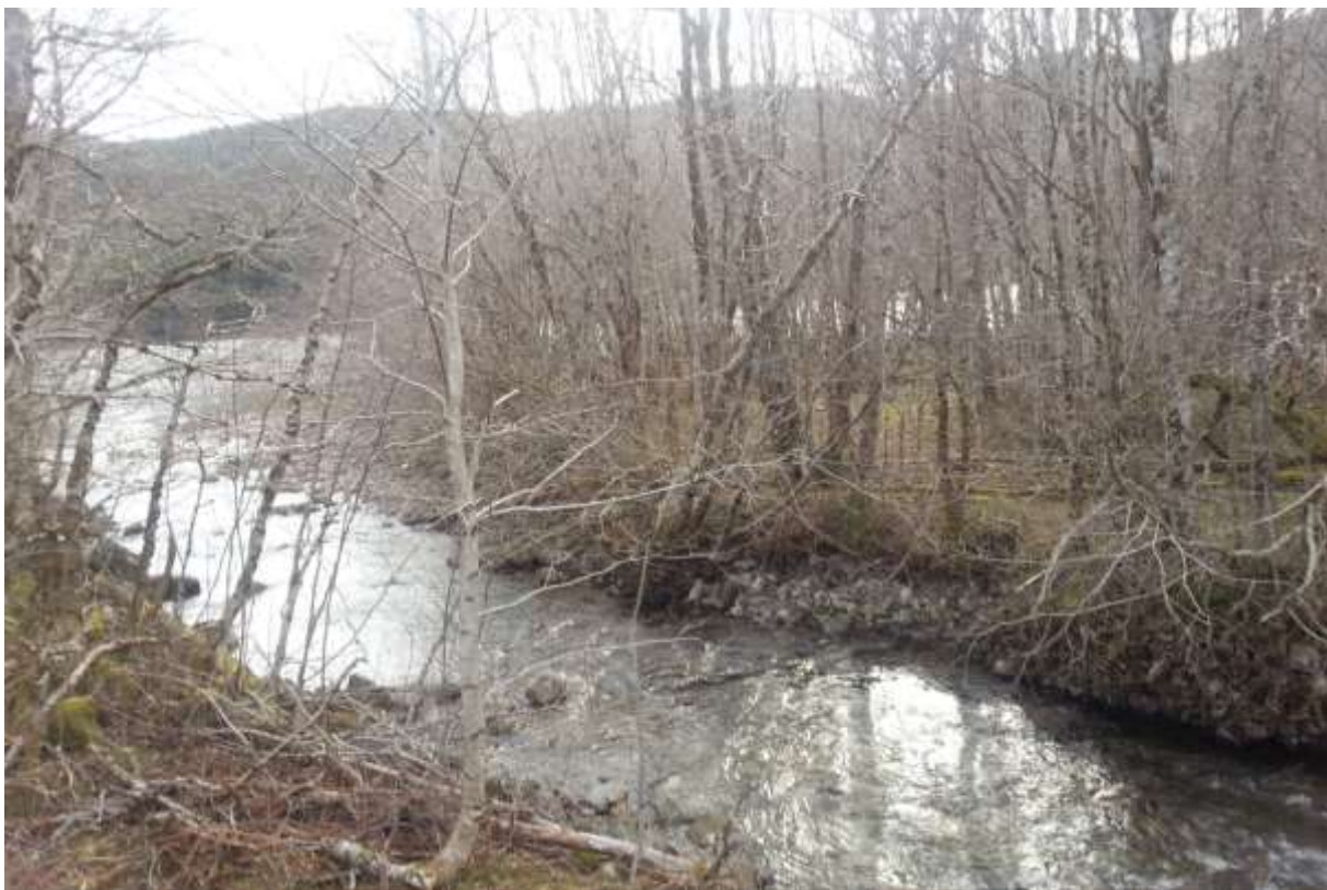
Figur 63. Biletet viser utlaupe av Skausetelva i Skausetvatnet.