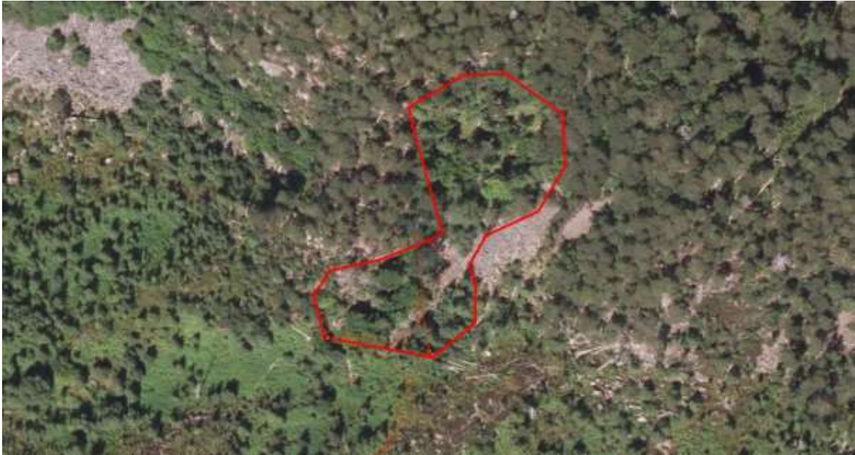
Figur 50. Avgrensing.

Finn Oldervik, private artslister for Aure