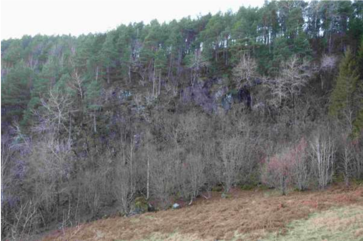
Figur 59. Den nordlegaste delen av lokaliteten.