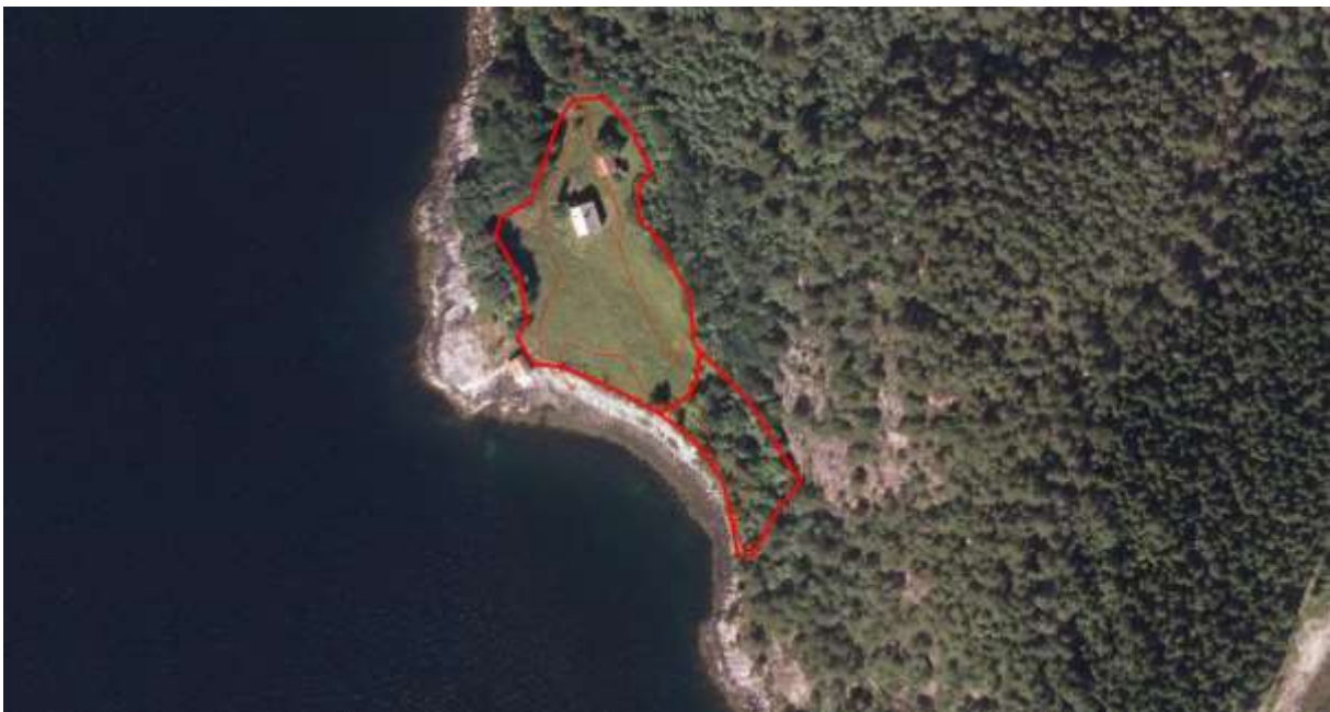
Figur 54. Avgrensing.

Verdivurdering: Lokaliteten får etter faktaark frå desember 2014 høg vekt på areal (om lag 4 daa), og elles låg vekt på alle parametra, noko som tilseier at lokaliteten skal ha verdien Lokalt viktig – C . Verdien kan truleg hevast ved gjenopptaking av slåtteskjøtsel.