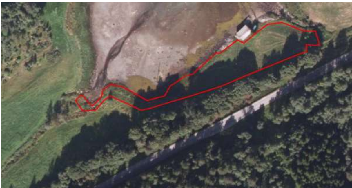
Figur 29. Avgrensing

Artskart: http://artskart.artsdatabanken.no/