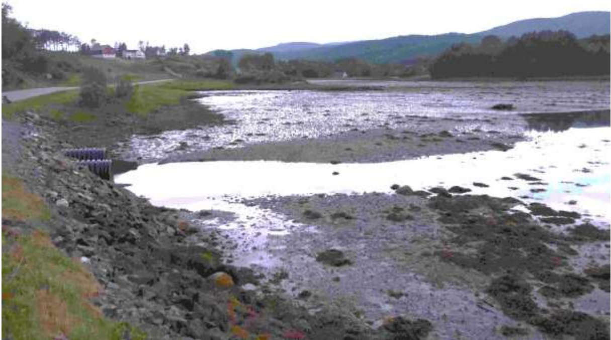
Figur 26. Frå Stemshaug sentrum i retning kyrkja.