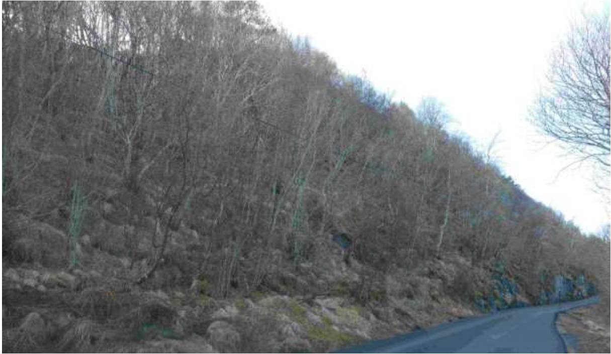
Figur 9 Lokaliteten sett frå aust mot vest. Inne i skogen finst fleire mindre opne bergveggar.