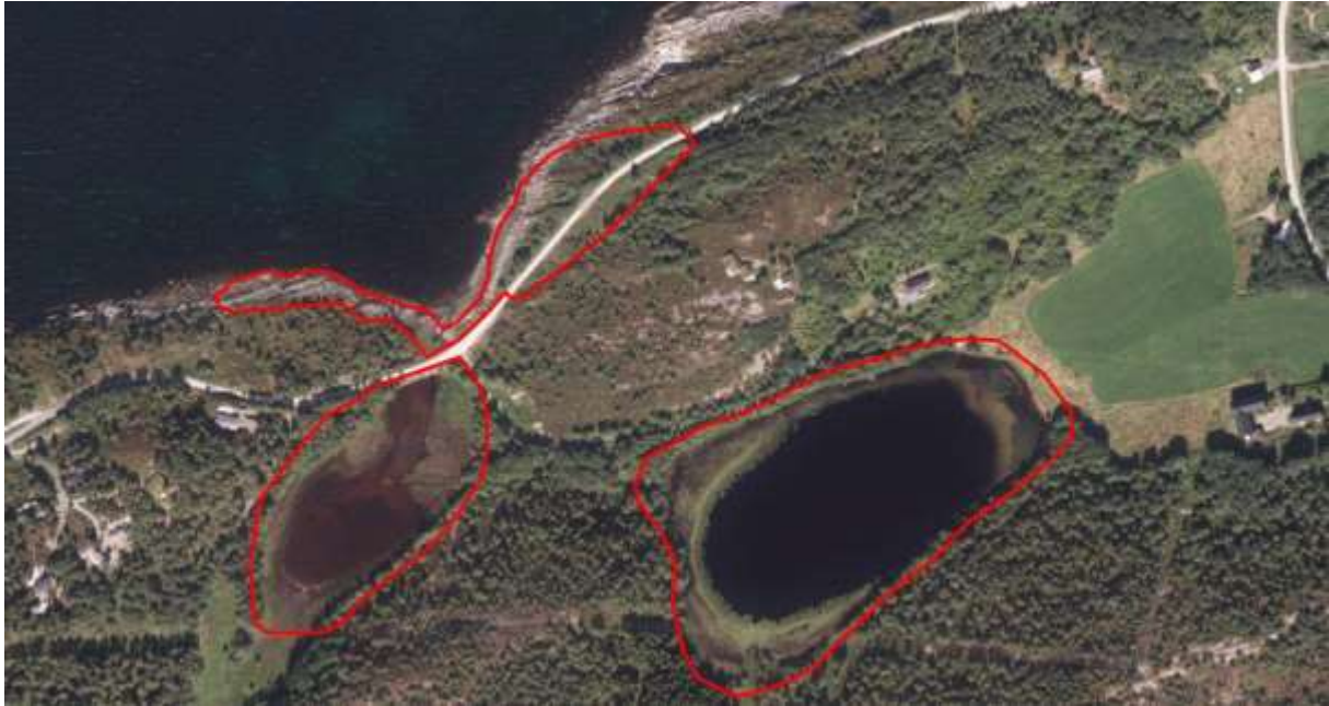
Figur 8. Avgrensing. Lokaliteten er den austlegaste av dei registrerte naturtypene i området.