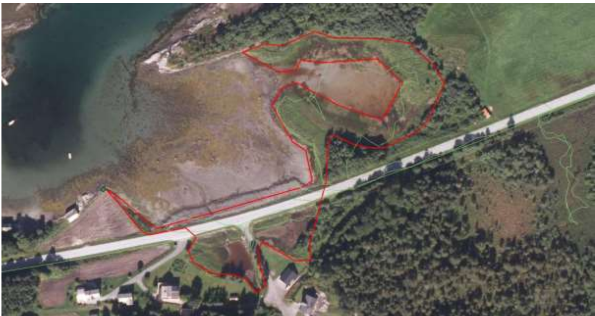
Figur 20. Avgrensing.

Rapport Møre og Romsdal fylke, areal- og miljøvernavdelinga 2006:3. Forvaltningsplan for Melland og Mellandsvågen naturreservater