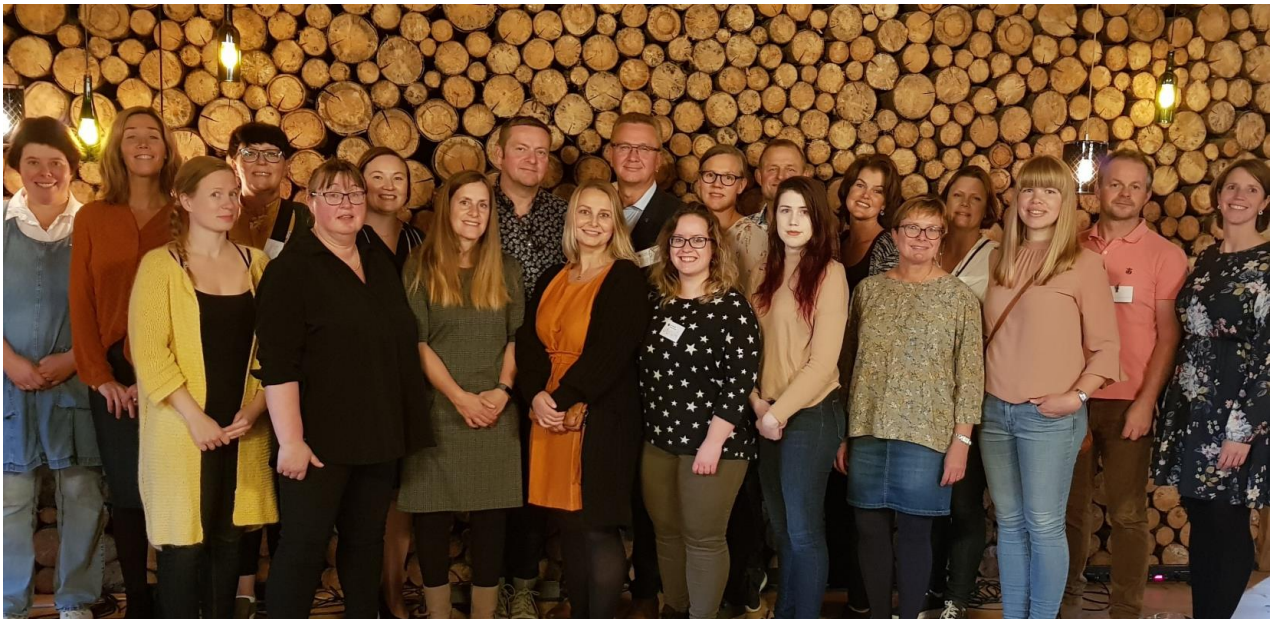
Deltakerne på studieturen

Det var totalt 21 deltakere med på studieturen inkludert reiseledelsen fra Fylkesmannen i Nordland som bestod av tre personer fra avdelingene for landbruk og reindrift, helse og omsorg og sosial og vergemål. Deltakerne kom fra 11 av fylkets 44 kommuner, og representerte kjøpergruppen, landbruksansatte, gårdbrukere og godkjente Inn på tunet-tilbydere. Deltakerliste finnes helt bakerst i denne rapporten.