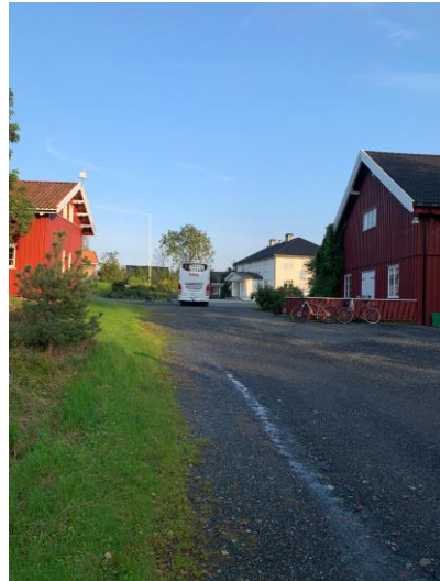
Vestre Kjærnes gård – Kunst i naturen – Vestre Kjærnes gård

På kvelden ble det servert middag på Låven, ja den man ser i tv-programmet, bestående av en buffet med lokale råvarer tilberedt av gårdens kokk. Vi gjennomførte også en presentasjonsrunde av deltakerne der de fortalte litt om hvem de er og hvorfor de deltok på denne studieturen. Kvelden ble avsluttet med sang og musikk av deltakerne selv.