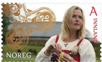
Frimerke, utgitt av Posten Norge. Fotograf Kjell Ove Storvik, Design Kristin Kristin Granli

Og hvem gjetter hvem vi har fått til å lede oss gjennom hele konferansen: Hallvard Holmen—for oss kanskje mest kjent som "Roy" fra Himmelblå!