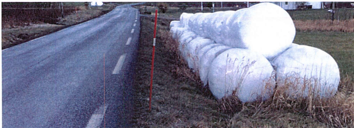
Figur 1 Eksempel på trafikkfarlig lagring langs en fylkesveg

Statens vegvesen arbeider etter en visjon om at ingen skal bli drept eller hardt skadd i trafikken. Et viktig bidrag for trafikksikkerheten er gode forhold langs vegene. Statens vegvesen registrerer at det lagres/hensettes diverse tett opp til offentlig veg flere steder i fylket. Dette kan være seg rundballer, tilhengere, containere og så videre. Dette representerer en betydelig trafikkfare ved utforkjøring, samt at rundballer tiltrekker seg hjortevelt som øker sjansen for vilt påkjørsel.