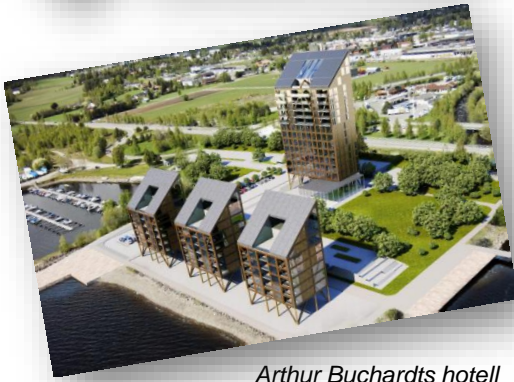
Arthur Buchardts hotell Mjøstårnet blir verdens høyeste trehus på 80 meter og 18 etasjer.

Hvilke muligheter ligger i bruk av tre i bygg i klimasammenheng, utnyttning av lokale grønne ressurser til verdiskaping og etablering av næringsvirksomhet.