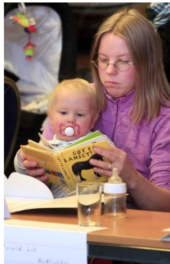
Både store og små på vår første fellessamling

Den videre utviklingen hos prosjektdeltakerne ønsket vi å arrangere lokalt, for å forsterke samarbeidet og samhørigheten i de lokale klyngene.