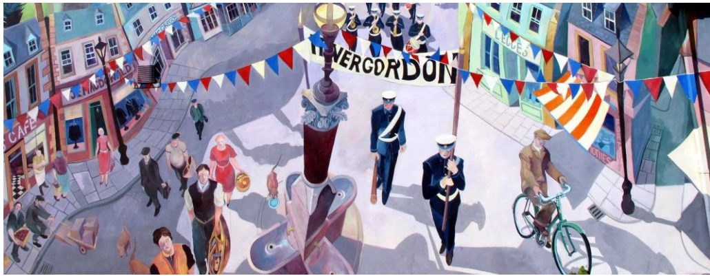
Parti fra bygning i byen Invergordon - såkalt "mural art"

Formålet med besøket her var å høste kunnskap og utveksle erfaringer for prosjektdeltakerne – både i Rogaland og Skottland. Studieturen ble en suksess, og fikk en flott tilbakemelding fra deltakerne, se for øvrig vedlagte program og referat fra turen.