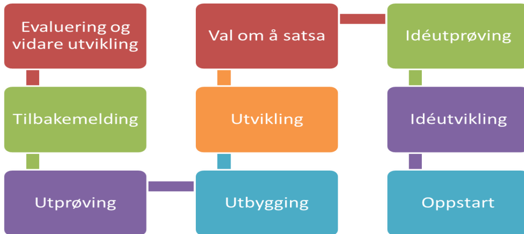
Fig 2: Fasene i utviklingsprosjekter.

Fra enkelte av prosjektdeltakerne kom det underveis tilbakemelding på at det ble brukt mye tid på enkelttema - blant annet arbeid med forretningsideene til prosjektdeltakerne. Dette har muligens sammenheng med at prosjektdeltakerne stod på til dels forskjellige stadier i utvikling av sine forretningsideer, og at enkelte var utålmodige etter «å komme videre». Kanskje bør man i fremtidige prosjekter forsøke i større grad å se det individuelle i fellesskapet - klyngetenking til tross. Sistnevnte forhold - individuell vurdering - er noe som kanskje også i større grad kunne vært benyttet overfor deltakerne - kanskje særlig med tanke på den utarbeidede utbetalingsmodellen - muligens har denne vært for mye på linje med resultatkravene i prosjektet - og vært for ambisiøs/rigorøs. Kanskje burde denne vært definert i samarbeid med prosjektdeltakerne, etter at en var blitt nærmere kjent med disse og etter at en hadde fått bedre informasjon om forretningside og øvrige forhold knyttet til prosjektdeltakerne.