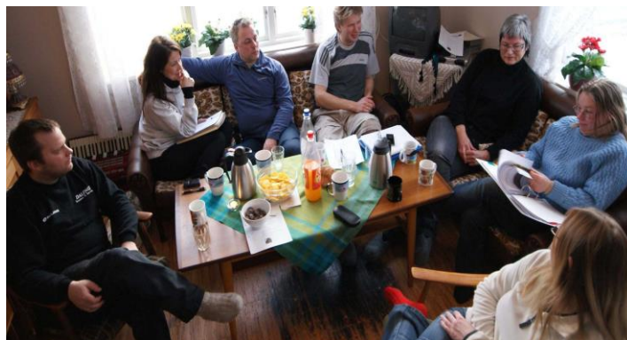
Gruppearbeid på Furuheim gård, Susendal

Formål med samlingen: For det meste som beskrevet overfor i Hamarøy/Steigen. Kommunens rolle og forventninger ved ordfører. Hva kunne de bistå med? Dessuten presentasjoner av- og videre arbeid med deltakernes forretningsplaner.