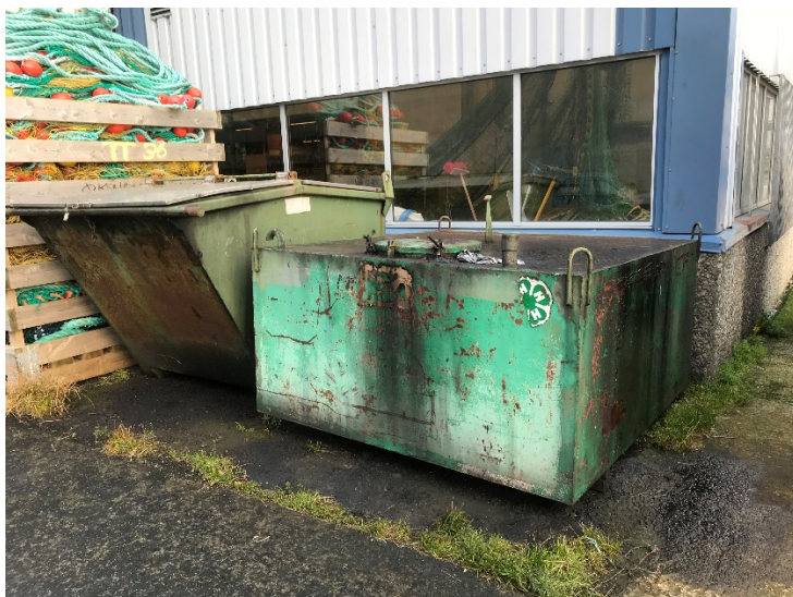
Bilde 1 , stasjon for mottak av farlig avfall på Myre Redskapsentral.