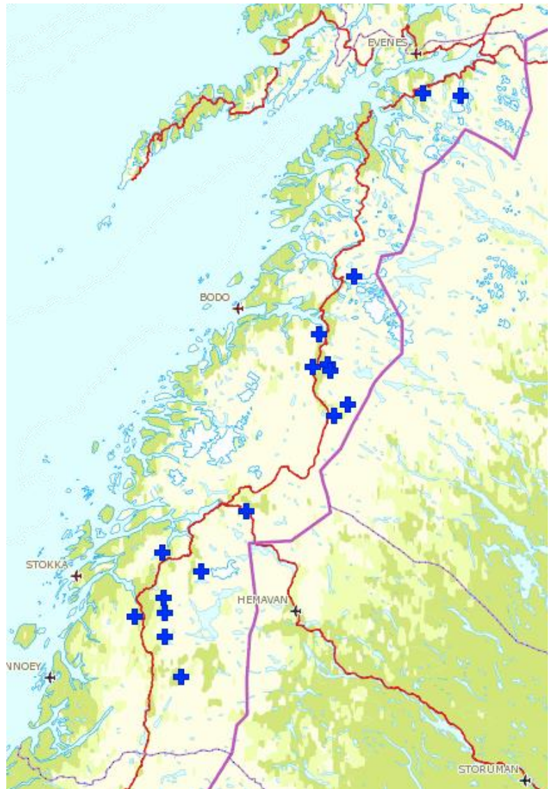
Figur: Kart over felte jerver under lisensfellinga i 2012/2013.

Områdene på fastlands-Nordland nord for Rombaken inngikk i kvote fastsatt av Rovviltnemnda i region 8, jf. avtale mellom nemndene. Det var tilgjengelig kvote i dette området hele fellingsperioden uten at det ble felt jerv.