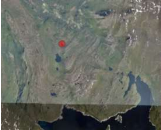
Figur 3 Tiltaksområdet (markert med rød sirkel) er del av et større sammenhengende uberørt beiteområde for reindrifta.