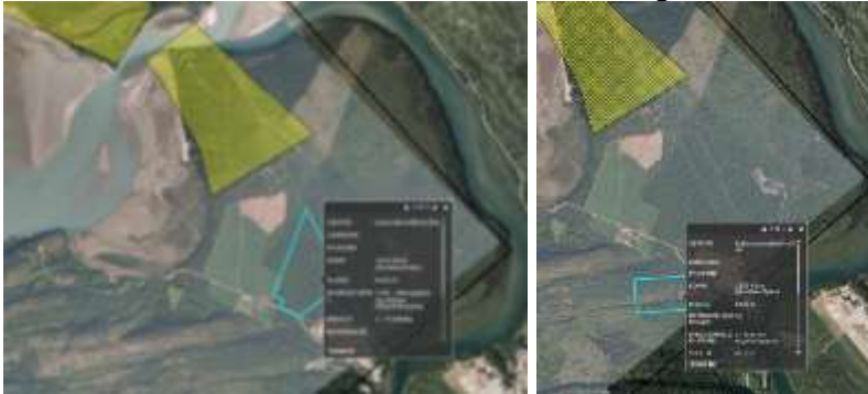
Figur 1 og 2 Fylkesmannen fremmer innsigelse til deler forslag til to utvidelser av eksisterende massetak. Flyttlei slik den er tegnet på reindriftras arealbrukskart er vist med gulstiplet polygon.

Etter Fylkesmannens vurdering vil utvidelsen medføre at flyttlei for rein i vest stenges. Det er etter reindriftsloven § 22 ikke adgang til å stenge flyttleier. Fylkesmannen foreslår at arealet reduseres slik det er vist i figur 2 nedenfor.