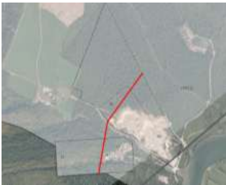
Figur 2 Fylkesmannen vil vurdere å trekke innsigelsen dersom områder avsatt til fremtidig grusuttak reduseres til å være øst for rød strek.