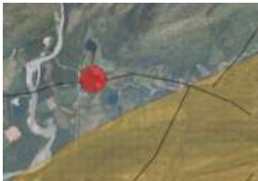
Figur 4 Trekklei markert med svarte linjer. Planlagt tiltak markert med rød sirkel.

Byggeområdet som berører også en trekklei øst-vest som ikke må stenges. Dersom det åpnes for boliger i dette området, bør det komme klart frem for utbyggere at det er trekklei i området og at rein i området må påregnes.