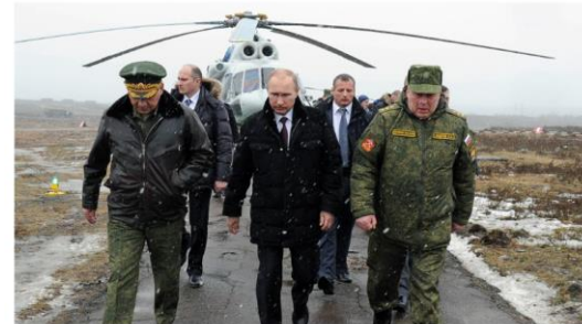
Putin til stede på øvelsesstedet Kirilovskij i for, sammen med blant andre forsvarsminister Sergej Sjogu og sjefen for den russiske hærens avdeling for kampforberedelser, Ivan Buvaltsev.

Russlands militære tilstedeværelse i Arktis vil bli styrket ved utgangen av 2015 med sjø- og luftforsvar.