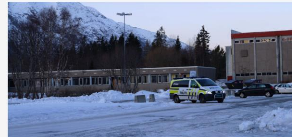
Til sammen tre skoler, en ungdomskole og to videregående, er stengt etter at det er framsatt trusler på appen Jodel.