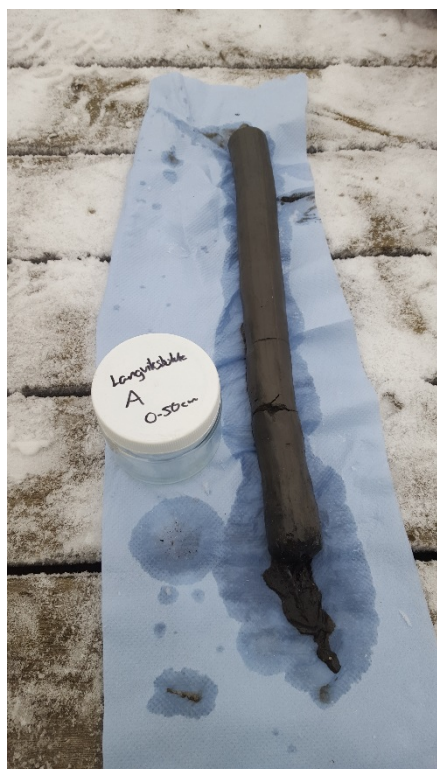
Bilde 1 Prøve A