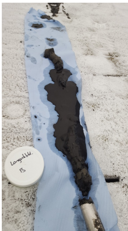
Bilde 2 Prøve B