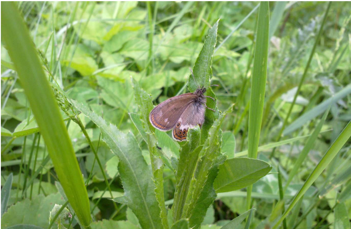
Figur 9. Asker: Nesøya: Ottes vei. En av de fire hannene av heroringvinge som ble funnet der den 11. juni 2019.