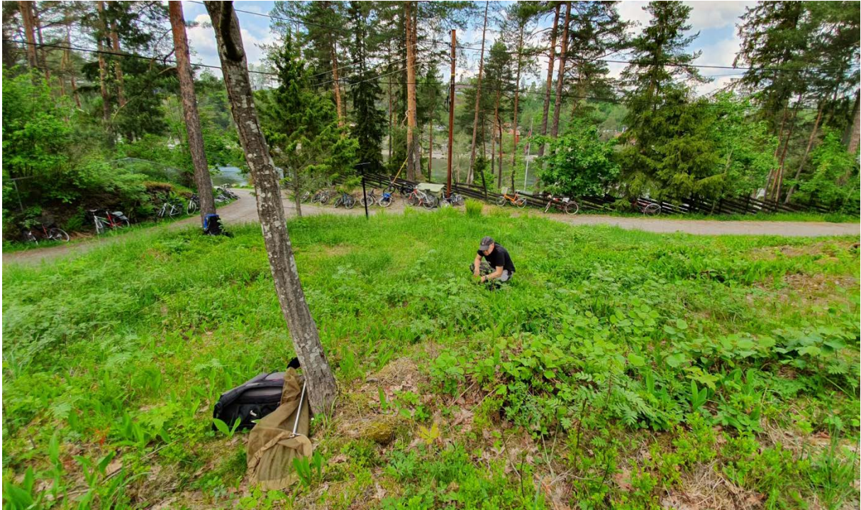
Figur 6. Asker: Brønnøya: Vendelveien 70. Søk etter unge stadier av heroringvinge 21. mai 2019. På bildet Roald Bengtson.