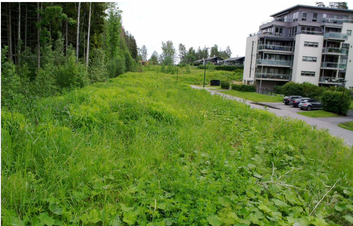
Figur 7. Asker: Nesøya: Søndre vei. Bilde fra undersøkelsen den 11. juni 2019. Lokaliteten er en ca. 10 år gammel, konstruert jordvoll med gjengroingseng som ligger langs et nybygd boligområde i Søndre vei. Mye av fremmedplanten kanadagullris. Fire hanner av heroringvinge ble funnet der under besøket. Arten ble også funnet der i 2017.