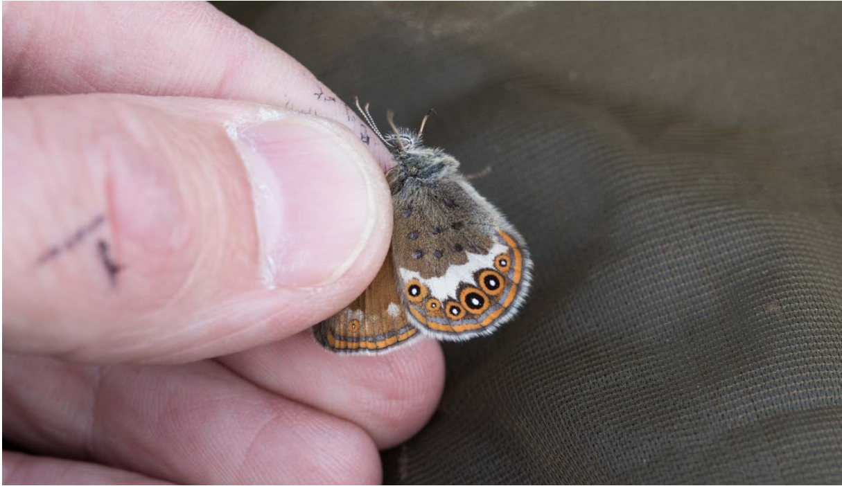
Figur 12. Bærum: Borøya. Bilde fra utsettingen av heroringvinge den 7. juni 2019. Ti individer fra Brønnøya ble satt ut på den store enga øst på Borøya. Før utsettingen ble alle individene merket individuelt med sprittusj på undersiden av høyre bakvinge.