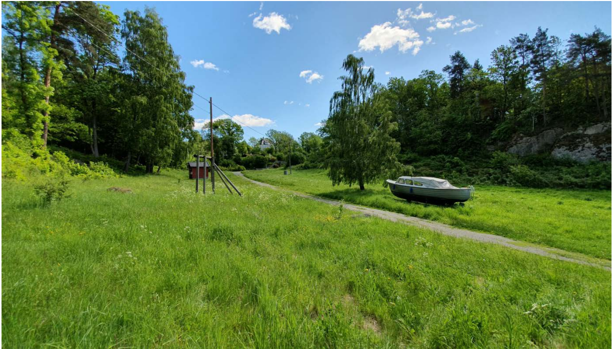
Figur 2. Asker: Brønnøya: Brønnøyveien 15 (Sandbukta). Bilde fra forundersøkelsen 29. mai 2019. Tre hanner av heroringvinge ble funnet på dellokaliteten under besøket.