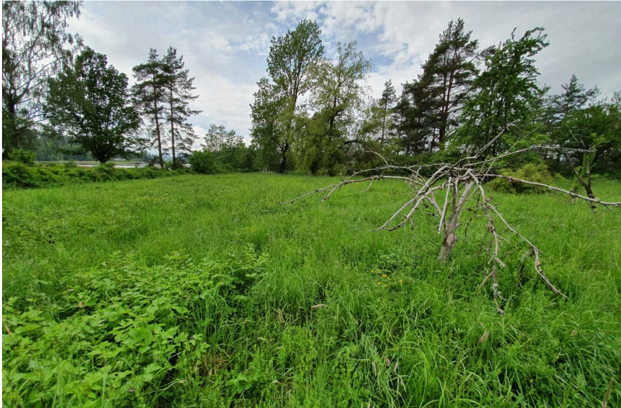
Figur 4. Asker: Brønnøya: Vendelveien 9A (forgrunn) og 9B (bakgrunn). Bilde fra flyttedagen 7. juni 2019.