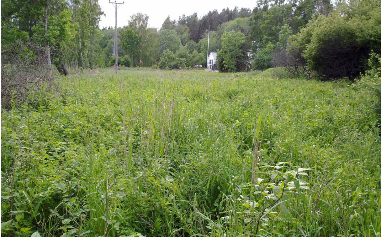
Figur 8. Asker: Nesøya: Ottes vei. Bilde fra undersøkelsen den 11. juni 2019. Lokaliteten er en stripe med gjengroingseng som løper langs et felt med nybygde eneboliger i Ottes vei. Stripen er en rest av tidligere åpen kulturmark. Fire hanner av heroringvinge ble funnet der under besøket.