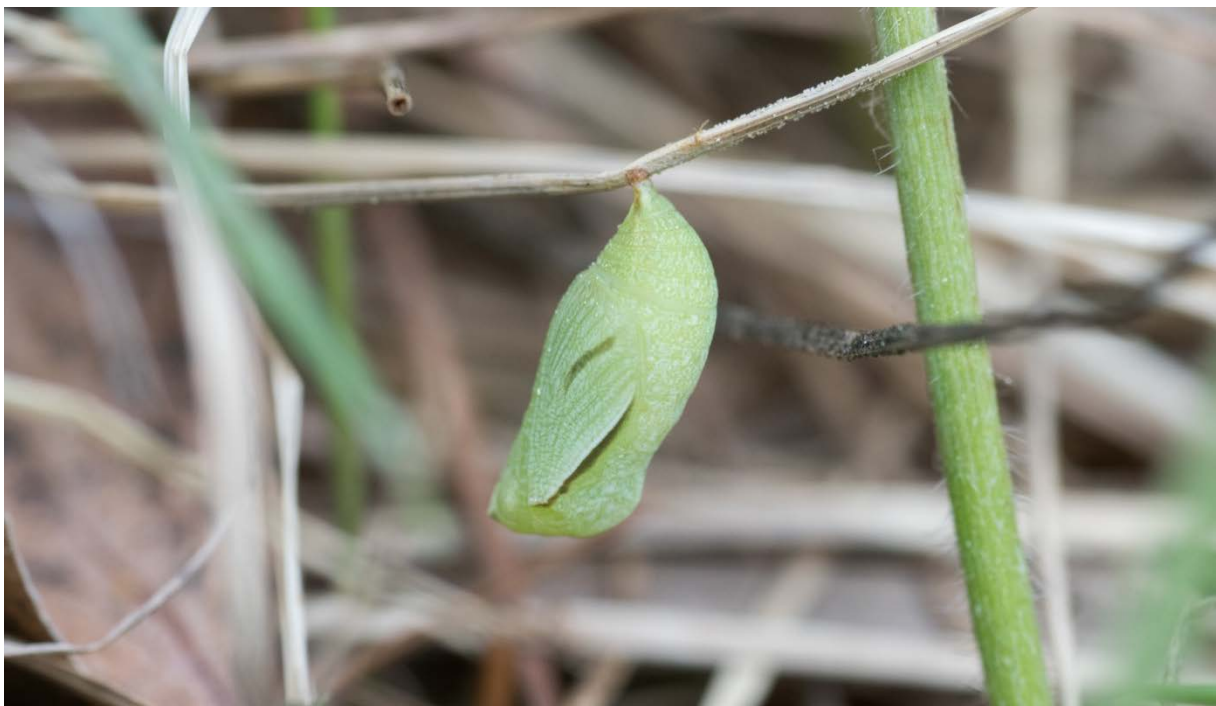
Figur 5. Asker: Brønnøya: Vendelveien 9A. Puppen av heroringvinge som ble funnet under søket etter unge stadier av heroringvinge på Brønnøya den 21. mai 2019. Puppen hang festet til et fjorårsstrå lavt over bakken i søndre del av enga. Funnet bekrefter at arten bruker denne gjengroende enga til egglegging og larveutvikling.