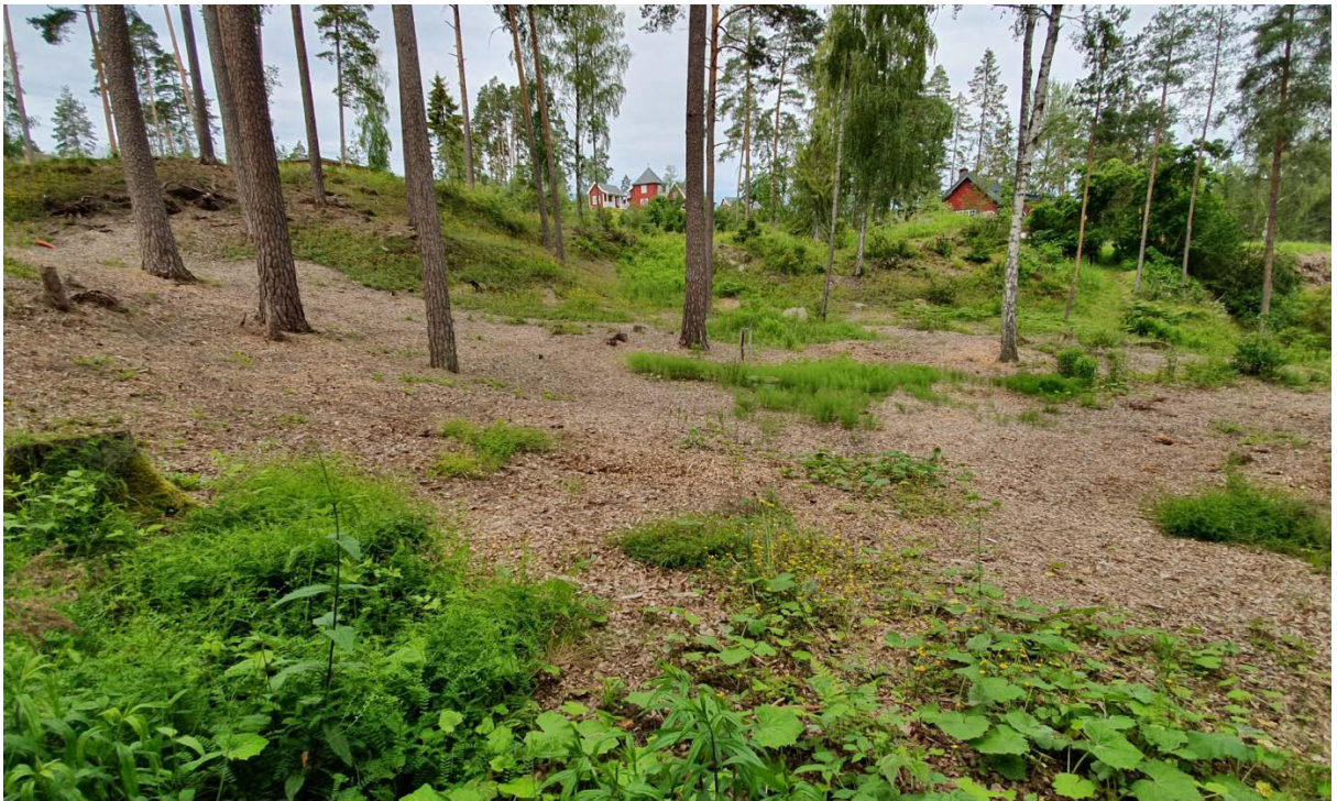
Figur 11. Bærum: Grimsøya: Tomt 44/273. Bilde fra undersøkelsen den 11. juni 2019. Dette og flere andre arealer på øya har blitt «flislagt» i forbindelse med hogst og rydning, trolig som et tiltak for å hindre ny vegetasjon i å skyte opp. Tiltaket har imidlertid effektivt utryddet den naturlige, verneverdige kalkmarksfloraen på disse arealene.