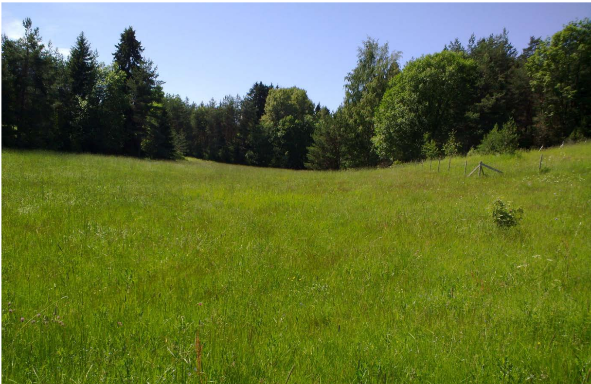
Figur 13. Bærum: Borøya. Den store enga øst på øya hvor utsettingen fant sted. Bilde fra etterundersøkelsen den 15. juni 2019. Ingen av individene som ble satt ut 7. juni ble gjenfunnet. Det ble i løpet av undersøkelsene i 2019 heller ikke funnet noen etterkommere etter utsettingen i 2018.