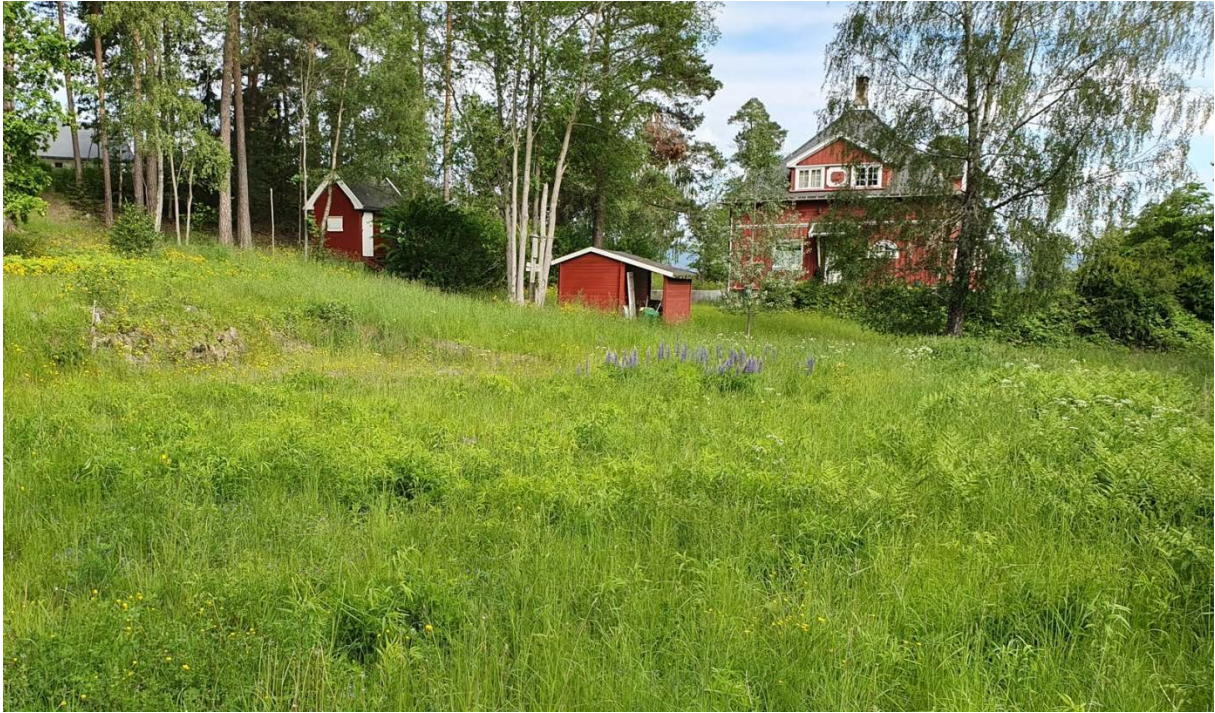
Figur 10. Bærum: Grimsøya: Hans Hanssens vei 11 A. Bilde fra undersøkelsen den 11. juni 2019. Tomta var en av flere tomter på øya som kan være aktuelle for heroringvinge. Merk dog bestanden av den sterkt problematiske fremmedarten hagelupin midt på enga. Både denne og flere andre problematiske fremmedarter er i begynnende spredning på Grimsøya, men har ennå ikke fått ordentlig fotfeste.