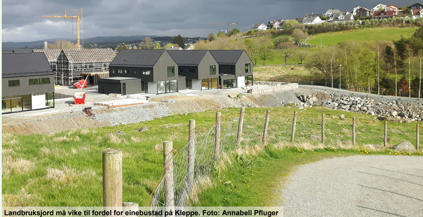
Landbruksjord må vike til fordel for einebustad på Kleppe.