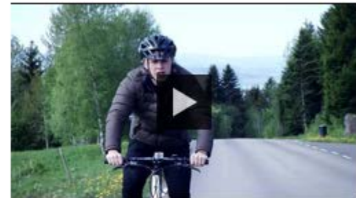
Del C - Kommunen og innbyggerne