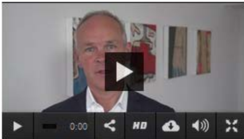
Del A - Kommunen som demokratisk institusjon