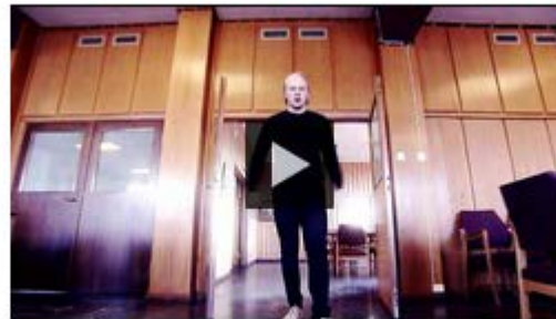
Del B - Politisk organisering og politikernes rolle