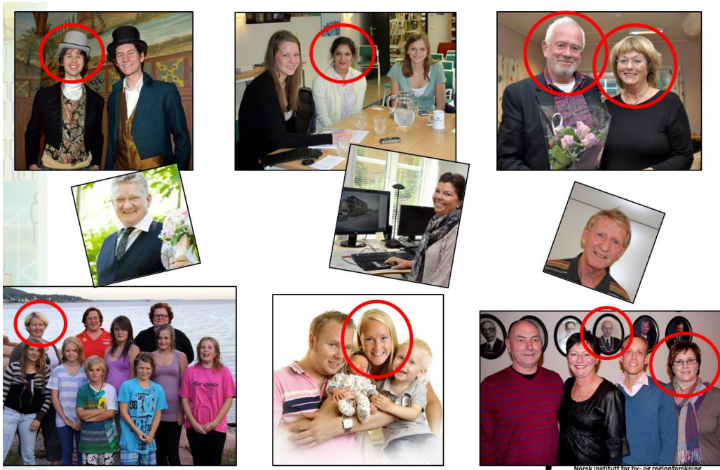
Gjestebudsverter i Svelvik (A.S.Horten)

”Glimrende opplegg. Engasjerer engasjerte mennesker som normalt er avskåret fra å bidra fordi de enten ikke ønsker å gå inn i lokalpolitikken eller de ønsker av forskjellige årsaker ikke ... å tone flagg på åpne møter” (deltaker).