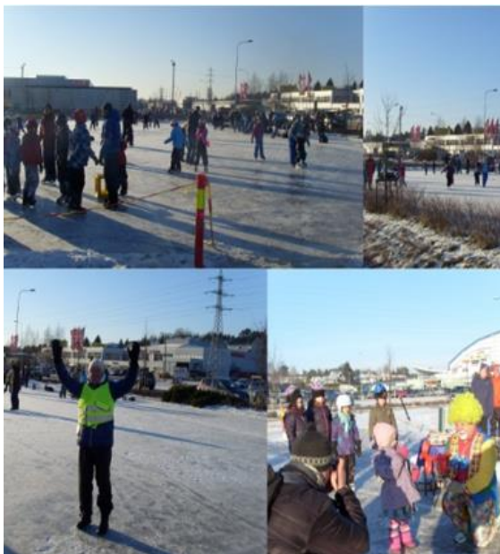
Lokalsamfunnsutvalg i Fredrikstad kommune lagde egen isbane på dugnad.

Kommunen har årlige fellesmøter med utviklingslagene og bydelsrådene. Utviklingslagene bestemmer selv hvordan de vil organisere seg og hva slags aktivitetsnivå de legger seg på. Kommunene bidrar med driftstilskudd, men svært mye av arbeidet som gjøres baserer seg på frivillig arbeid.