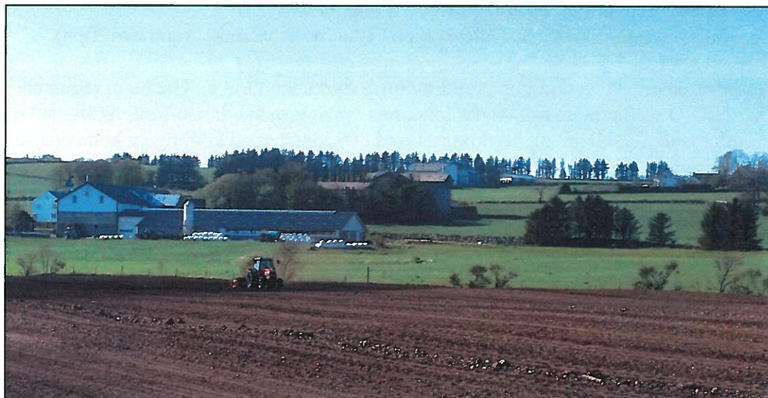
Frå Jæren 2016