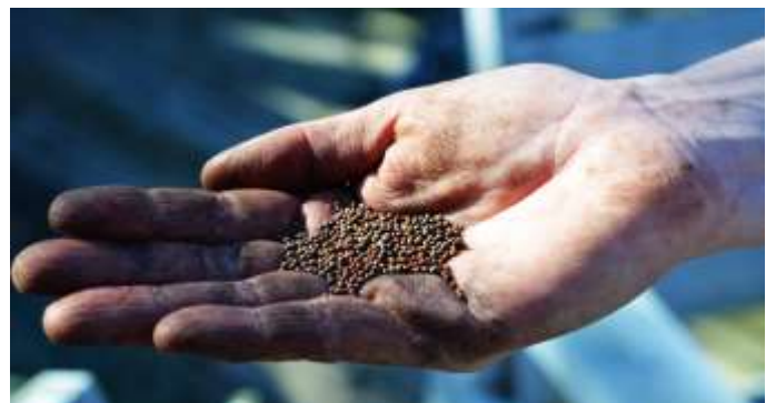
Frø i handa