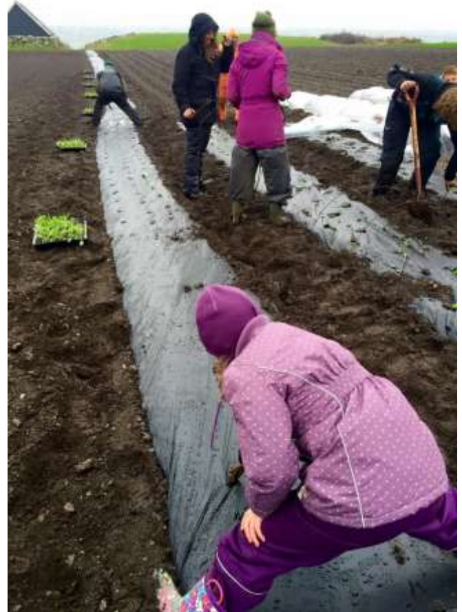
Utplanting av småplanter.

Meir om andelslandbruk på www.andelslandbruk.origo.no