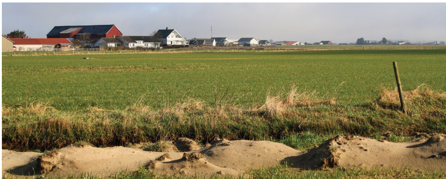
Figur 8. Jordbruksareal dominert av flygesand.

Den største delen av sandjorda finnes i flygesandområdene langs kysten, som vist i figur 6 og 8. Denne jorda har vanligvis lavt innhold av organisk materiale og er derfor både tørkesvak og utsatt for vinderosjon. Den siltige sanda dominerer i moreneområdene innenfor. Den vanligste jordtypen her består av siltig mellomsand med lavt grusinnhold og et humusrikt matjordlag. En fjerdedel av det kartlagte morenejordarealet har behov for dreneringstiltak.