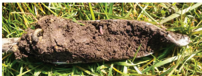
Figur 4. Rik tilgang på husdyrgjødsel gir en god fruktbar jord, med mye liv i jorda.