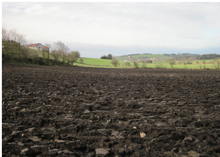
Figur 2. Jordbruksareal med et høyt innhold av organisk materiale i plogsjiktet.

Av det jordsmonnkartlagte arealet i Klepp kommune har 35 % av jorda dårlige dreneringsegenskaper, og behov for dreneringstiltak fra naturens side. Tilstanden på eventuelle grøftesystem er ikke vurdert.