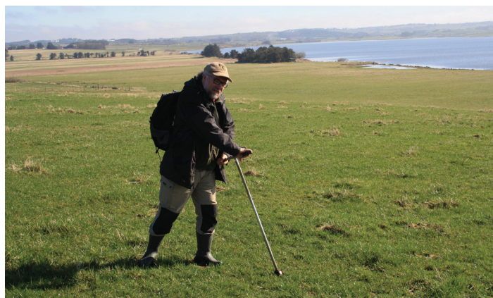
Figur 6. Kartlegging av arealer med selvdrenert sandjord.

Ei jord består av mineralpartikler med ulik størrelse. Det fine materialet utgjøres av partikler mindre enn 2 mm. I denne kategorien er sandpartiklene størst, med en størrelse på 0,06 mm – 2 mm. Leirpartikler er mindre enn 0,002 mm. Størrelsesfraksjonen mellom sand og leir, kalles silt. Ut i fra fordelingen av sand, silt og leir i hvert lag i jorda, inndeles jord i ulike teksturgrupper. Teksturen kan være homogen nedover i dybden og den kan variere med dybden. Jordas tekstur vil ha stor innvirkning på blant annet jordas dreneringsegenskaper, jordas evne til å motstå erosjon og hvor utsatt jorda er for pakking. I tillegg vil teksturen også ha betydning for jordas innhold av næringsstoffer. Leir har en svært god evne til å binde vann og næringsstoffer. I ei sandjord vil vann i de fleste tilfeller infiltreres lett. Ei siltjord vil ha god evne til å holde på vann, men vil samtidig ha liten motstand mot vannerosjon. Den vil også være utsatt for pakking. Under feltarbeidet vurderes jordas tekstur på stedet gjennom visuell bedømmelse og ved å kna, klemme og