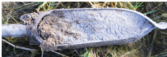
Figur 7. Sandjord i detalj.

rulle jord etter gitte kriterier. For å kvalitetssikre feltbedømmelsen av tekstur tas det enkelte prøver for analyser på laboratoriet.