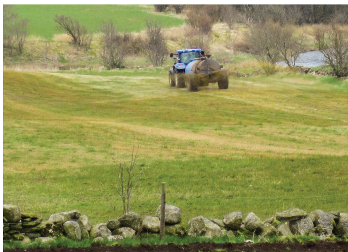
Figur 3. Bruk av husdyrgjødsel gir tilførsel av organisk materiale i plogsjiktet.