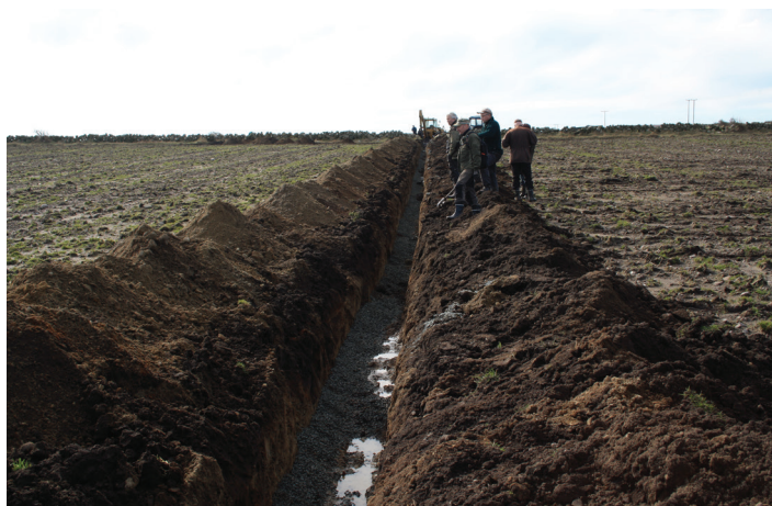
Figur 5. Utføring av dreneringstiltak på et areal med jordsmonn som har dårlige dreneringsegenskaper.