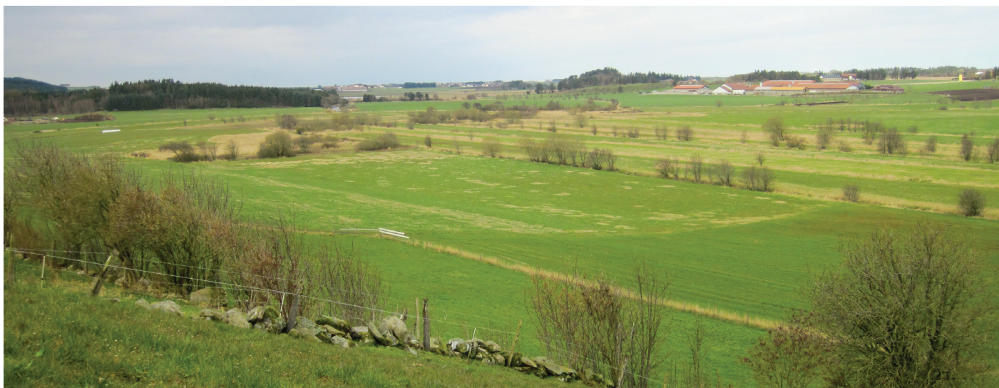
Figur 1. Bildet viser et stort, sammenhengende jordbruksareal i Klepp kommune.

På kartportalen Kilden presenteres utvalgte karttema med opphav i jordsmonnkartleggingen. Jordkvalitet , Jordressursklasser , Begrensende egenskaper , Dreneringsforhold og Årsak til dårlig drenering er eksempler på tema som presenteres. Rapporten bruker disse temaene som utgangspunkt for beskrivelsen av jorda i Klepp kommune.