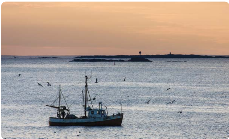
Fiskebåt og måker ved Kjørholmane naturreservat.

Mange av sjøfuglbestandene har endret seg en god del gjennom de siste 50 årene. Flere arter som tidligere var svært vanlige, er nå nesten helt borte. Det skyldes i hovedsak at fuglene ikke finner nok fisk i sjøen til ungene sine. Når det er for lite mat, går produksjonen av unger ned. Matmangelen har vedvart over flere tiår, og har resultert i en katastrofal svikt i hekkebestandene. Dette har særlig rammet alkefugler som lomvi og lunde, men også terner og de fleste måkeartene.