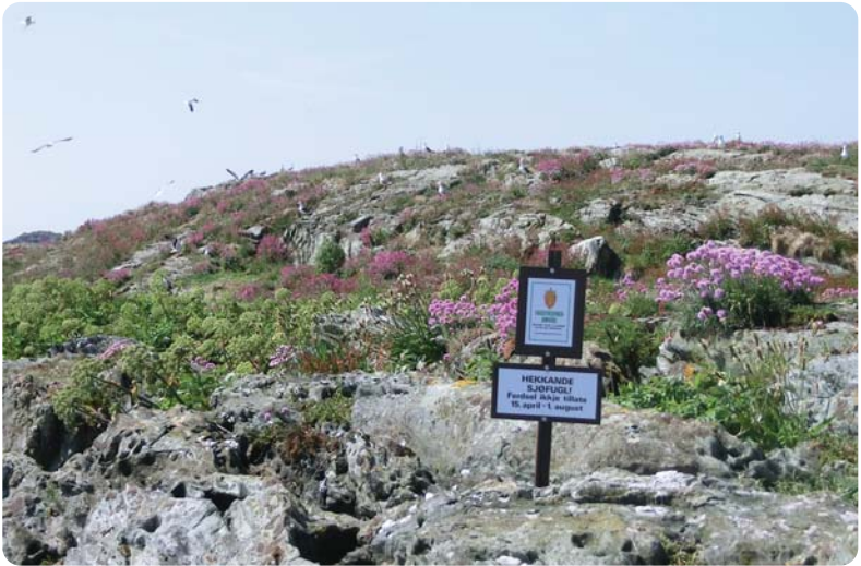
Naturreservatene er merket med skilt.

Sjøfuglene er sårbare i hekketiden. Ferdsl og forstyrrelser kan føre til tap av egg og unger. For å beskytte sjøfuglene er flere viktige hekkel-plasser vernet som naturreservat. Reservatene er vernet etter Natur-mangfoldloven og er vår strengeste verneform. Her er det forbud mot ferdsl i hekketiden fra 15. april til 1. august. I fuglefredningsområdene er det forbud mot jakt hele året. I noen fuglefredningsområder er det fri ferdsl, i andre er det ferdslsforbud i hekketiden. Hvilke kan du se på kartet.