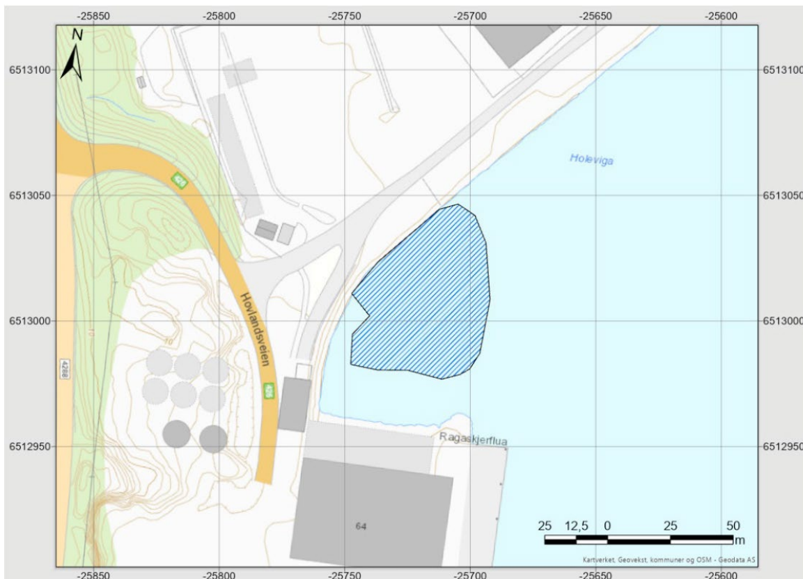
Figur 1. Oversiktskart som viser foreslått utfyllingsområdet (blå skravur). Utsnitt i 1:1000. Kartkilde: Kartverket.

utfyllingsarealet, med en tykkelse på minimum 15 cm. Det skal legges en motfylling i ytre deler av fyllingen, da det er nødvendig med stabiliserende tiltak. Høyden på motfyllingen blir minimum 4 m. Videre skal vil utfylling utføres fra land til endelig nivå på ca. kote +2,7 iht. sjøkartnull (kote +2,2 iht. NN2000). Bunnlag/tildekkingslag, motfyllingen og første del av fyllingen utføres med mudringsmasser bestående av rene sand/grus fra Kystverkets utdyping ved Maurholen. Utfylling fra land vil bli utført med sprengsteinsmasser fra et område like i nærheten, dvs. fra Pelagias industriområde på Grønehaugen.