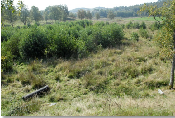
Figur 6: Rett nord for hagemarka, skyt svartor opp. Denne vil etter kvart kunne bli ein fin biotop om den får utvikle seg fritt.