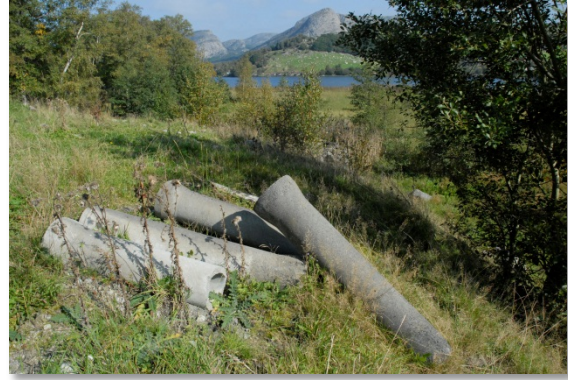
Figur 7: Mot nordgrensa av reservatet, ligg ein gamal tipp med mellom anna gamle betongrøyr oppe i dagen.