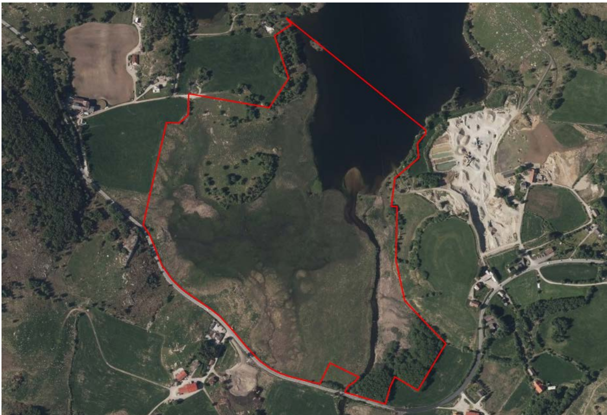
Figur 3: Flyfoto frå 2013 syner eit mindre vassarealet vest for elveutlaupet enn kva som var tilfellet i 1937. Reservatgrensa er den raude streken.