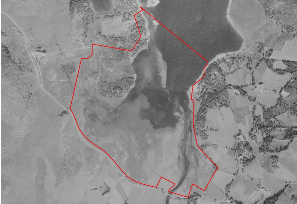
Figur 2: Dette flyfoto frå 1937 syner eit klart større vassarealet vest for elveutlaupet enn kva som er tilfellet i dag. Reservatgrensa er den raude streken.