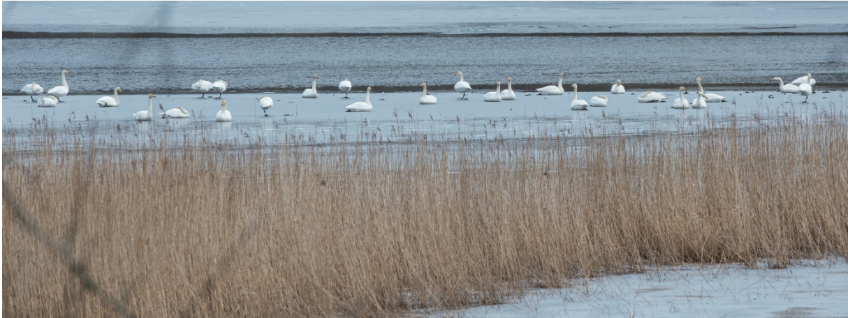
Figur 4: Songsvaner er ein vanleg overvintrande art. Denne januardagen i 2015 var det nærare 80 individ til stades.