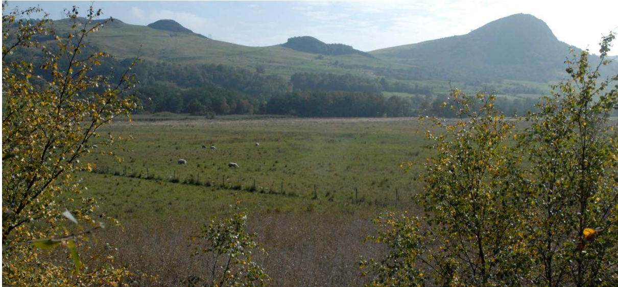
Figur 3: Fuktenga sør i reservatet som i 2014 blei beita av villsau. Gjerdet mellom dei to eigedomane 9/9 og 9/16 ses tydeleg i biletet.

Frå vernet i 1996 og fram til 2013, blei området vest for Svilandsåna hovudsakleg beita av storfe. Nå er eigedomsgrrensa mellom 9/9 og 9/16 delt med eit gjerde. På 9/9 gjekk det i 2014 opp til 32 sau, og på 9/20 10 ungdyr av storfe. Nokre få individ av sau blei i 2014 sleppt ut i reservatet frå byrjinga av mai, mens hovudmengda blei sett ut i juni. Alle storfe blei slept ut i juni. Juni er noko seint i forhold til optimalt beitebruk, men er sett på som naudsynt for til å unngå forstyrring av hekkande fugl.