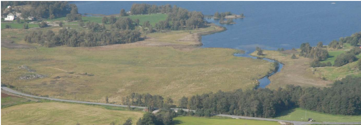
Figur 8: Dei store, opne flatene med sumpvegetasjon er det viktig å bevare.

Det er eit generelt forbod mot gjødsling og bruk av kjemiske sprøytemiddel i reservatet. Det er likevel nokre område kor bruk av gjødsel og plantevernmiddel er tillate, jf. kap. V pkt. 6. Dette er den beita fuktenga og beitemarka på kartet i vedlegg 2., jf. og skjønnsføretnad av 2. august 1999. Det er i januar 2015 opplyst frå Sandnes kommune at det ikkje blir brukt gjødsel og plantevernmiddel på nokon av areala i verneområdet. Utanfor områda med tillate bruk av gjødsel og plantevernmiddel, kan Fylkesmannen etter søknad vurdere å gje dispensasjon til bruk av sprøytemiddel mot ugras i særlege tilfelle, når desse ikkje er i strid med formålet for fredinga. Eventuell sprøyting må gjennomførast som punktsprøyting med rygg- eller handsprøyte. Sprøyting i nærleiken til vatn vil bli vurdert spesielt strengt, jf. naturmangfaldslova §§ 9 og 12, og vil normalt vere forbode etter anna lovverk.