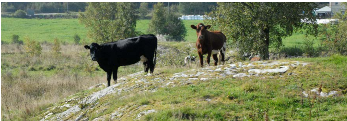
Figur 5: Beite med storfe, her frå eit tørrare område nord i verneområdet.

Området vest for Svilandsåna blei i 2014 beita av storfe på gardsbruk 9/16, og småfe på 9/9. Etter vernet i 1996 har området for ein stor del blitt beita felles med 10-20 storfe på dei to gardane. I 2013 blei det satt opp eit gjerde, som gjorde det mogleg å ha ulike beitereregimer på dei to gardsbruka. Som eit forsøk blei det i 2014 beita med villsau på gardsbruk 9/9. Dette blei gjort fordi villsau av grunneigar blei sett på som best skikka til å beite lauv og greiner frå oppveksande buskar. Vinteren 2013/2014 blei det og gjort eit ryddearbeid på gardsbruk 9/9, for å ta ein del av buskvegetasjonen som då hadde vokse opp i sumpmarka. På ei synfaring 7. november 2014 med grunneigar Tor A. Lomeland, blei det observert nedbeita buskar i fuktmarka kor villsauen gjekk.