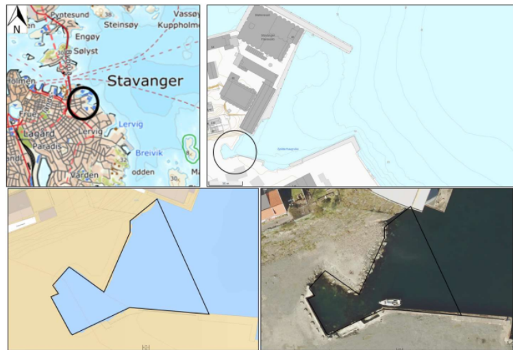
Figur 1: Tiltaket er planlagt innerst i Spilderhaugvika, Støperigata 18 i Stavanger kommune. Tiltaksområde er illustrert med polygon. Det må mudres for å oppnå stabilitet, før det er planlagt utfylling.

Lervigveien Bolig AS søker om mudring og utfylling i sjø i forbindelse med etablering av en tidevannspark samt å opparbeide en hensiktsmessig og trygg avslutning mot sjø i forbindelse med boligprosjektet Sjøkanten park. Det er beskrevet at mudring er nødvendig for å oppnå tilstrekkelig stabilitet ved fyllingsfoten, og det er ønskelig at mudrede masser bli gjenbrukt i utfylling bak sprengsteinssjetéen. Tiltaket gjennomføres fra leker eller med spesialmaskin (lang arm) fra land. Søker har planlagt å benytte siltgardin ved mudring og utfylling i sjø for å hindre spredning av forurensede partikler.