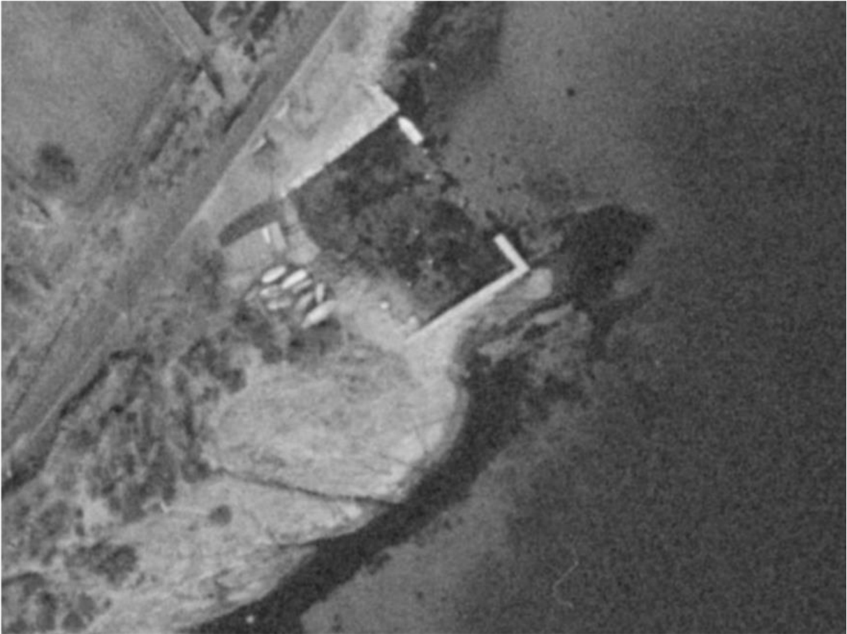
Figur 4 : 1973