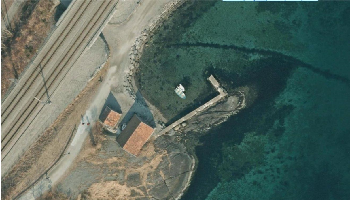
Figur 2 : 2013