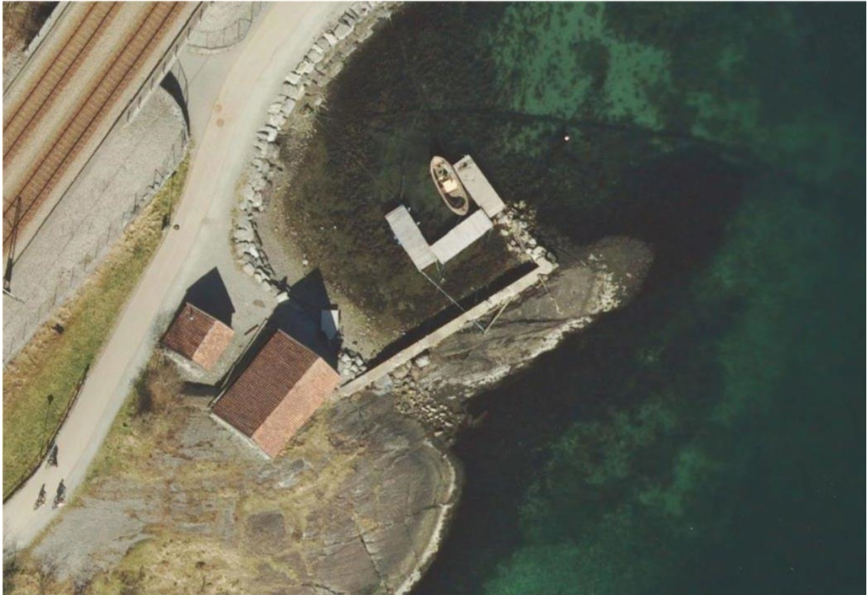
Figur 1 : 2020