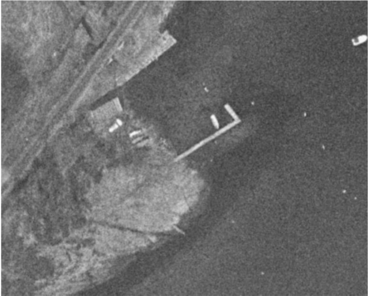
Figur 5 : 1968