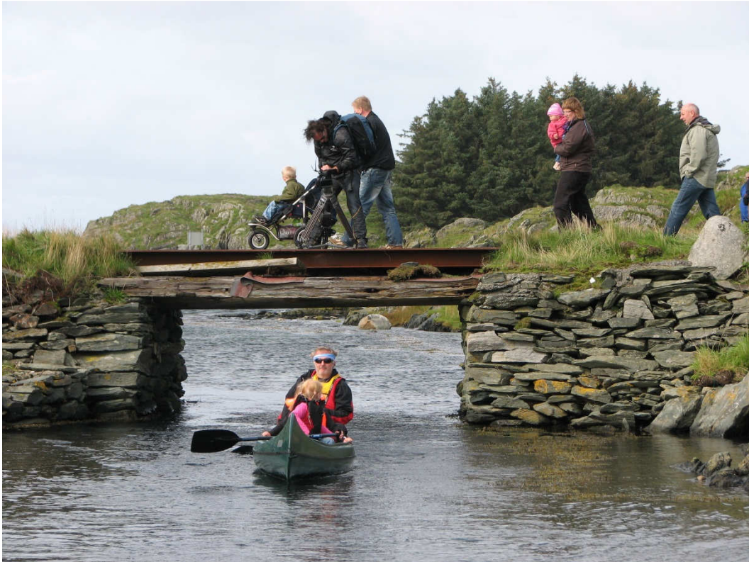
Vibrandsøy innbyr til friluftaktiviteter av mange forskjellige slag...