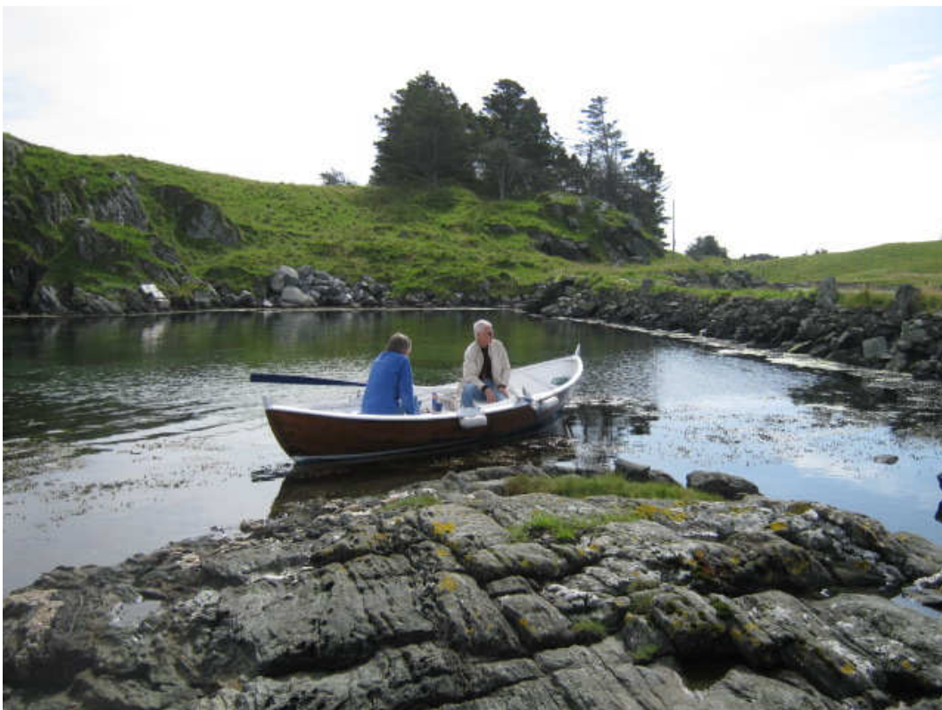
På Vibrandsøy er det mulig å finne fred og ro, bare et åretak og to fra den pulserende byen...