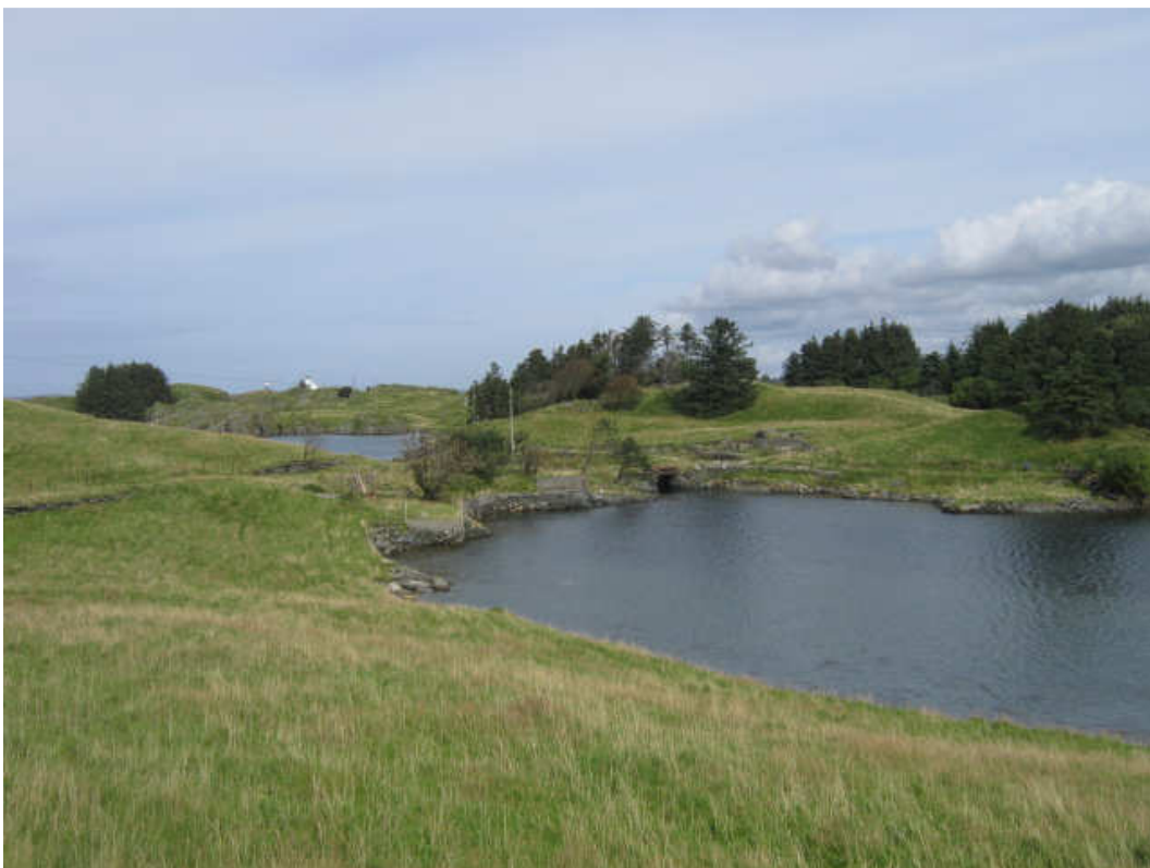
På Vibrandsøy dominerer gammelt kulturlandskap