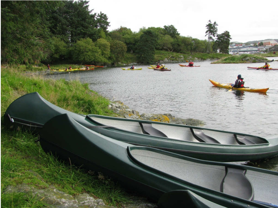
I Nordre Løvågen finner padlerne ly i nordavinden