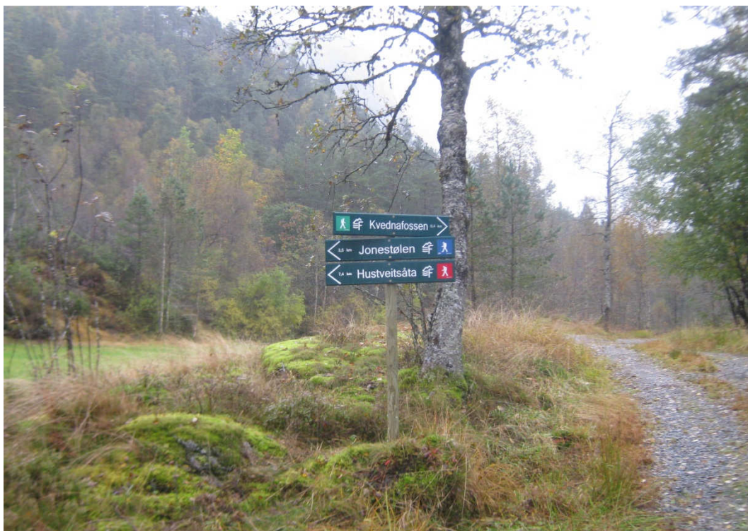
Hustveitområdet byr på mange turmuligheter