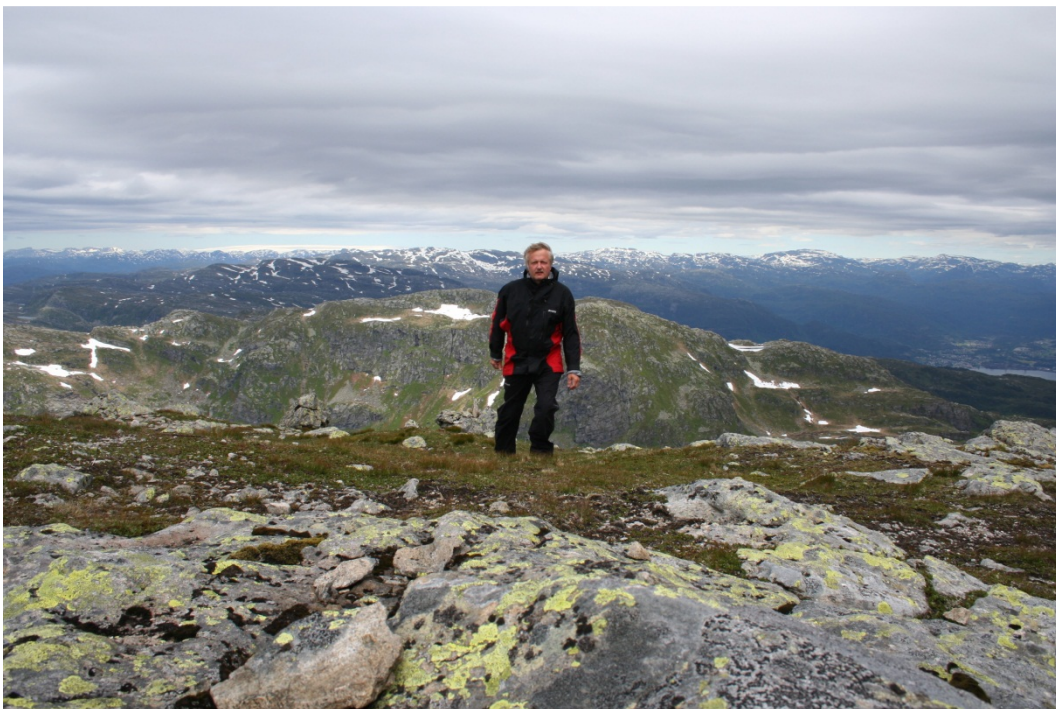
Her har turgåeren funnet vegen helt til topps på Hustveitsåta, 1187 moh