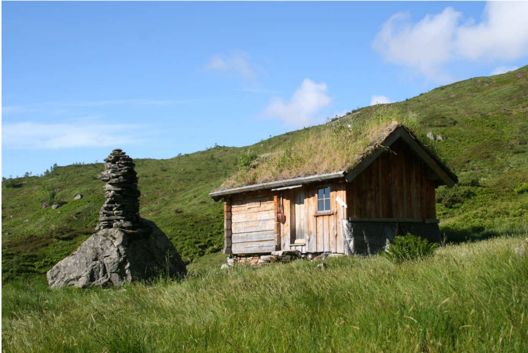
På Hustveitstølen har Friluftsrådet Vest satt opp laftet overnattingshytte etter gammel modell og byggeskikk