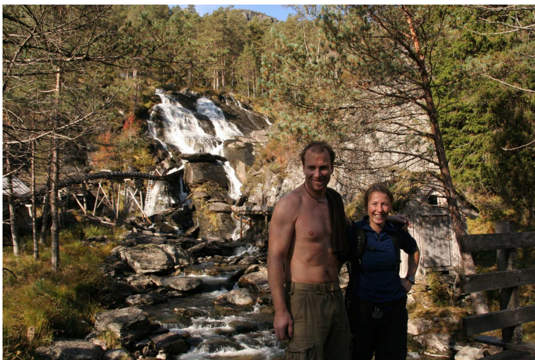
Ved Kvednafossen kan de besøkende oppleve fossefall og restaurert sagbruk