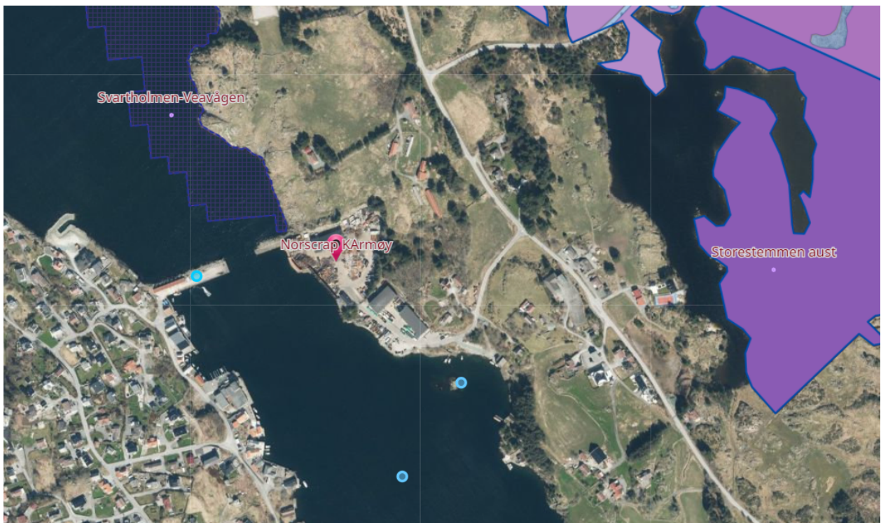
Figur 2: Oversiktsbilde med naturverdier. Informasjon hentet fra temakart-rogaland.no

Norscrap er lokalisert i et område regulert til industri. Det er annen industri, boligfelt, og LNF-områder i nærheten. Øst for anlegget er det områder med sterk trua naturtype kystlynghei. Området Storestemmen aust ligger i luftlinje ca. 500 m øst for anlegget til Norscrap.