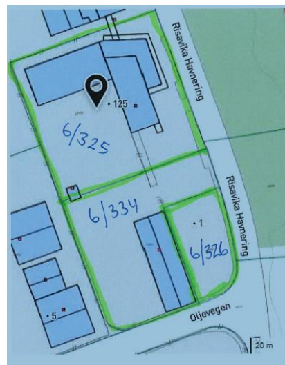
Markert område for utvidelse Gnr 6 og bnr 325, 326 og 334