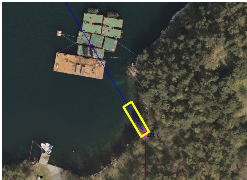
Figur 3: Område for graving på Sølyst.

Område aktuell for graving på Sølyst er 3 m * 20 m , vises i figur 3.