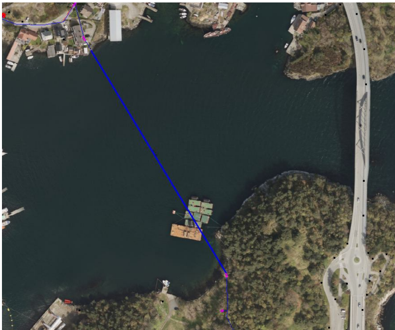
Figur 1: Kartutsnitt, vannledning som skal skiftes.

Eksisterende vannledning er en 200 mm PEH ledning fra 1963. Lengden på ledningen er cirka 300 meter. Det er nå avdekket et større ledningsbrudd/sprekk på ledningen og ledningen må derfor skiftes. Ledningen ligger i Engøysundet mellom Sølyst og Engøy (se figur 1).