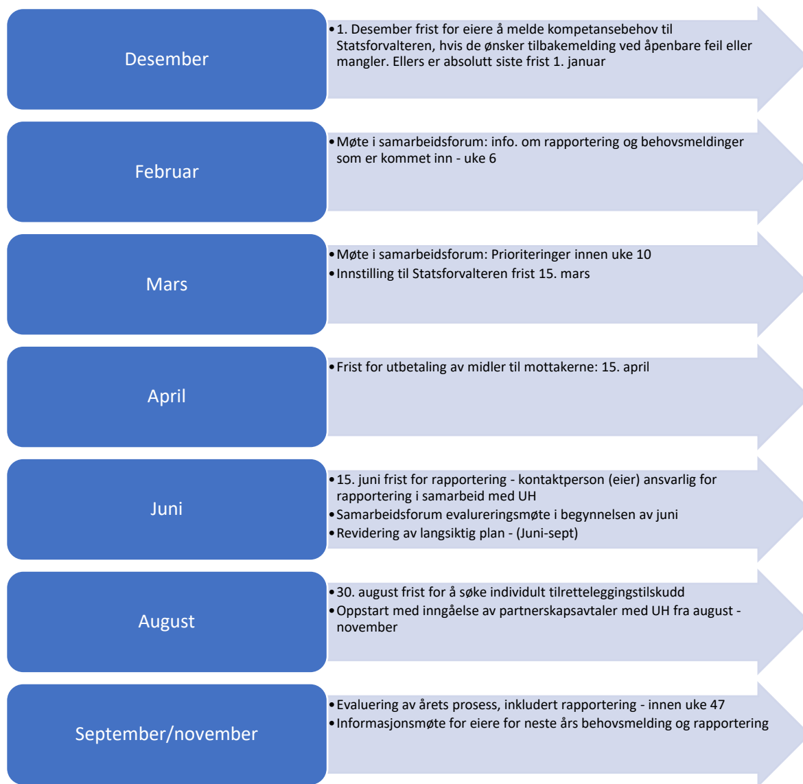
Figur: Årshjul – tidsplan for ReKomp i Troms og Finnmark

Hvem som er representanter i samarbeidsforum, finnes det en oversikt over på Statsforvalterens hjemmeside 22 .