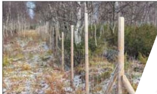
SNARVEI: Her går gjerdet et stykke over utmark for å unngå store snarveier, som igjen fører til mer vedlikehold.