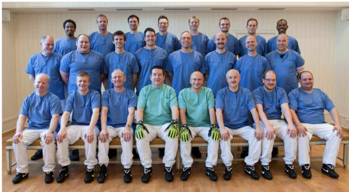
MANNSLAGSTROPPEN: Helsefagarbeidere i Trondheim kommune samlet til et lagbilde som få offentlig ansatte i Norge trolig kan vise maken til.

– Jeg likte veldig godt det som ble gjort for, men det å være i en jobb som er så viktig og å få tilbake ting fra dem gir ting en annen verdi, avslutter Frønes.