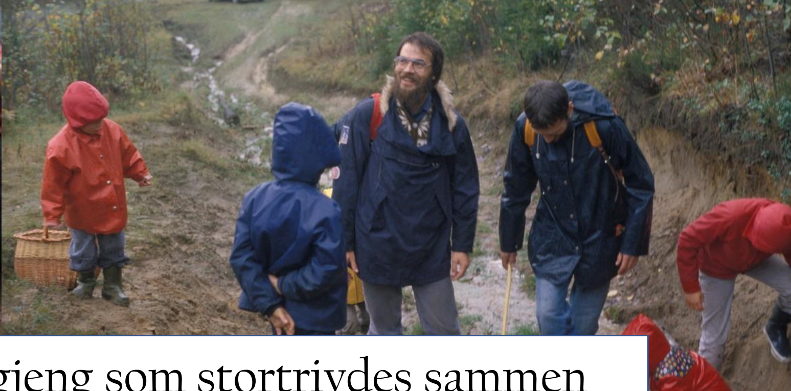
Vi var en vennegjeng som stortrivdes sammen