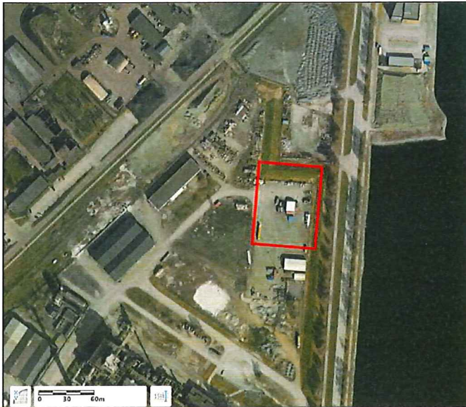
Figur 2 Flyfoto av tiltaksområdet (innrammet med rødt)