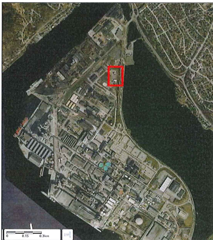
Figur 1 Området hvor Metallco AS skal etablere nytt bygg er markert med rødt.

Det er ikke vurdert at etablering av nybygg eller den planlagte driften vil forårsake ytterligere forurensning av grunnen.